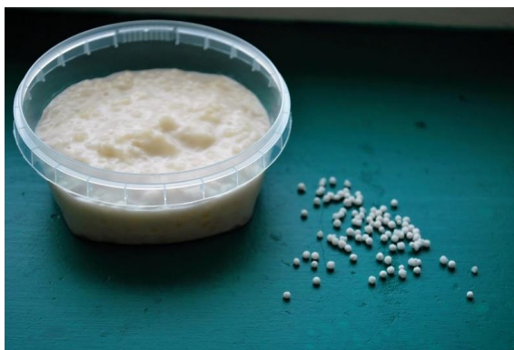
Obr. 4 Tapiocový puding

Tapioca obsahuje vápník, fosfor, draslík a hořčík. Je také zdrojem železa, kyseliny listové a vitamínu B. Tapioka je rovněž přirozeným zdrojem omega-3 a omega-6 mastných kyselin.