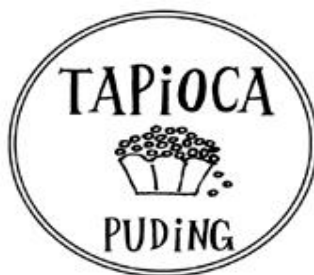
Obr. 5 Ochranná známka TAPIOCA PUDING