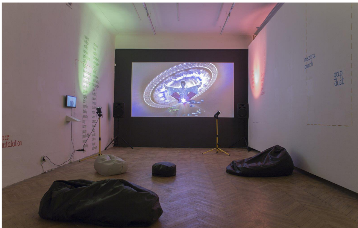
Pohľad do inštalácie.