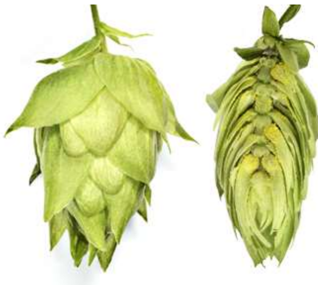
Obrázek 2.3: Odrůda Kazbek (Bohemia Hop, 2022).

Další odrůdou je odrůda Kazbek. Tato odrůda má výnos 2,1-3,0 t/ha. Odrůda si udržuje hodnotu \alpha -hořkých kyselin v rozmezí 4,5-8,0 % (Nesvadba et al., 2012). Jedná se opět o pozdní chmel s dlouhou vegetační dobou, u kterého se provádí časný řez chmele (Ježek et al., 2015). Odrůda Kazbek se v pivovarnickém průmyslu využívá pro druhé chmelení, popřípadě pro chmelení za studena. Odrůda Kazbek obsahuje 2-4 % silic, což je příčinou jeho citrusového aroma v následně uvařeném pivu (Krofta et al., 2019).