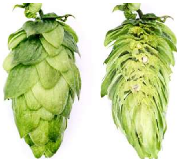
Obrázek 2.6: Odrůda Saaz late (Bohemia Hop, 2022).

Další pěstovanou odrůdou na území České republiky je odrůda Saaz late. Odrůda zajišťuje výnos 2,0-2,6 t/ha. Saaz late obsahuje 3,5-6,0 % \alpha -hořkých kyselin (Nesvadba et al., 2012). Jedná se o polopozdní odrůdu s dlouhou vegetační dobou a pozdně prováděným řezem. Česatelnost je zhoršena z důvodu hustého nasazení hlávek. V pivovarnickém průmyslu se využívá pro druhé a třetí chmelení (Ježek et al., 2015).