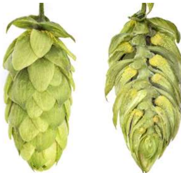
Obrázek 2.4: Odrůda Premiant (Bohemia Hop, 2022).

u které se řez provádí v první dekádě dubna. Oproti odrůdě Sládek je tolerantní na nedostatek vody. Premiant však vyžaduje vyšší zásobení dusíkem (Ježek et al., 2015). Odrůda získala svůj název od tradičního českého dvanáctistupňového piva. Vyšlechťena byla stejně jako odrůda Sládek za účelem doplnění tradičního Žateckého poloraného červeňáku. Jedná se o hořkou odrůdu určenou pro druhé a třetí chmelení s výrazným chmelovým aroma a vysokou plností chuti. Pivu poskytuje silný říz. Spolu s odrůdou Sládek a Žatecký poloraný červeňák se jedná o odrůdu, která může být užita na nápoje s označením České pivo. Kombinace či výběr z těchto odrůd je pak závislá na receptuře daného piva (Patzak a Nesvadba, 2021).