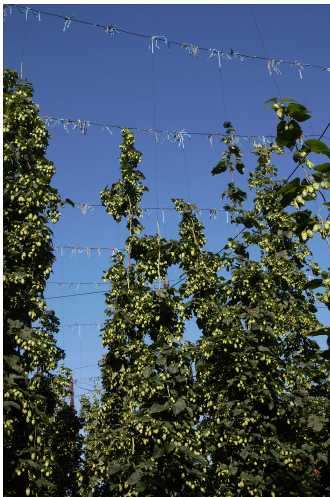
Obrázek 4.6: Pohled na habitus rostliny v době sklizně.

Obrázek 4.6 ukazuje naprosto nepřírozený habitus rostliny v době sklizně, kdy rostliny nedosahovaly vrcholu chmelniční konstrukce, avšak zmohutněly ve výšce, které dosahovaly v době bouřky, a tedy v době, kdy došlo k ulámání vrcholků rostliny. Kromě nižšího výnosu měl tento habitus vliv i na sklizňové procesy, které byly komplikované (nerovnoměrné zaplnění česačky chmele či například nerovnoměrné zatížení vozů při převozu na česačku).