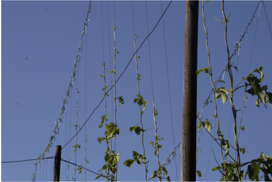
Obrázek 4.4: Detail poškození vrchní části habitu rostliny v den události.