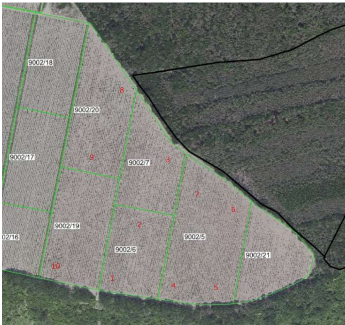
Obrázek 4.10: Místa odběru vzorků.

V archu, ve kterém je znázorněno vyhodnocení chemického rozboru zelených chmelových hlávek, mají vzorky s přípravkem NanoFYT Si čísla 4, 5, 6 a 7. Konkrétní místa odběrů jsou zaznamenána na mapce vytvořené z rozhraní LPIS. Tuto mapku obsahuje obrázek 4.10.