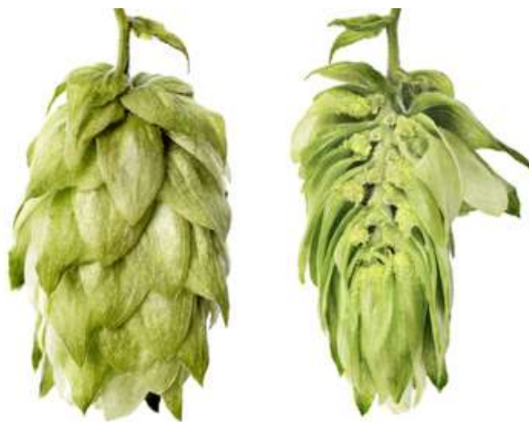
Obrázek 2.1: Odrůda Žatecký poloraný červeňák (Bohemia Hop, 2022).

odrůda je typická svým citrónovým a kořeněným aroma. Žatecký poloraný červeňák poskytuje výnos přibližně 0,8-1,5 t/ha. Při pivovarnickém využití se používá pro druhé a třetí chmelení, popřípadě pro chmelení prováděné za studena. Hořká chuť totiž není tolik výrazná, jako u jiných odrůd, avšak aroma této odrůdy je nenahraditelné (Ježek et al., 2015). Postup chmelení je přitom popsán v části 2.4.1 této práce, věnované potravinářskému využití chmele. Žatecký poloraný červeňák je pěstován v devíti klonch. V současné době se nejvíce využívají klony Oswaldův klon 31, Oswaldův klon 72 a Oswaldův klon 114. Volba konkrétního klonu přitom závisí nejvíce na půdních a klimatických vlastnostech dané lokality (HOP Products, 2021).