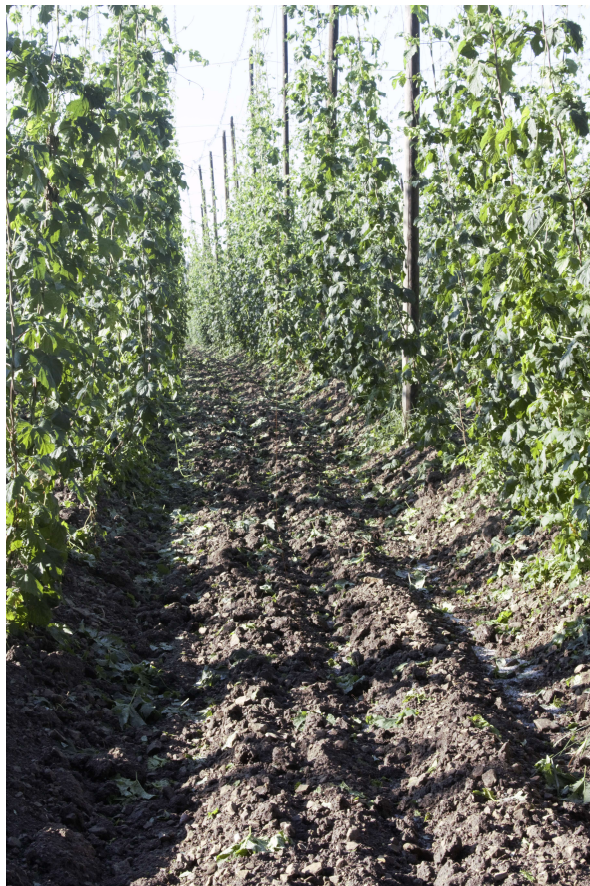
Obrázek 4.5: Pohled do meziřadí poškozené kultury v den události.