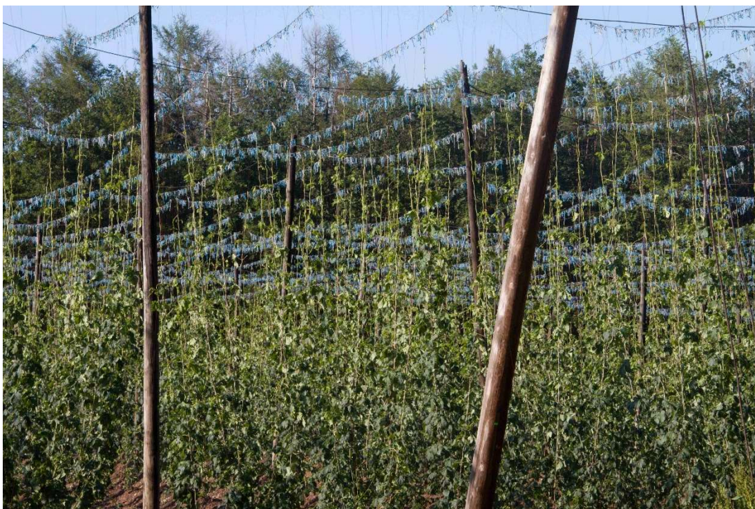
Obrázek 4.3: Poškození vrchní části habitu rostliny v den události.

Fotodokumentace také obsahuje fotografie ze sklizňového období, kdy je patrný nepřírozený habitus rostlin a také jejich nevyrovnanost, která vede ke komplikaci v průběhu sklizňového procesu a zároveň k nižšímu výnosovému prvku.