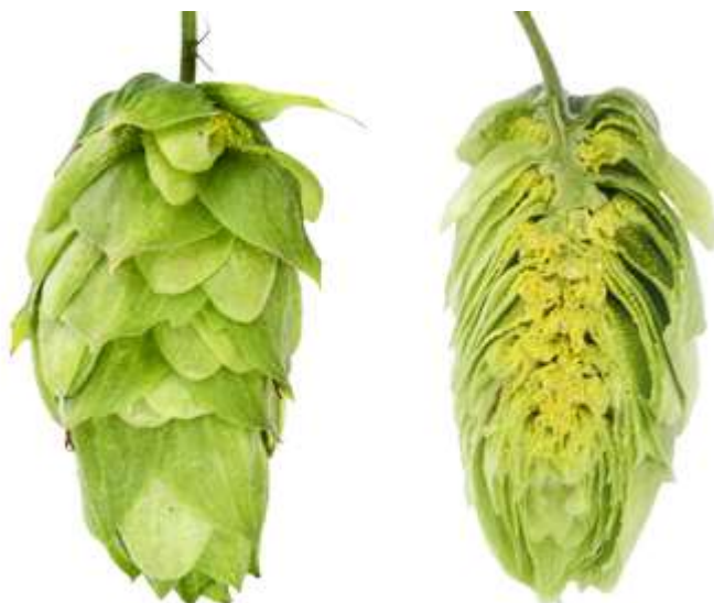
Obrázek 2.5: Odrůda Agnus (Bohemia Hop, 2022).

Další pěstovanou odrůdou na území České republiky je odrůda Saaz late. Odrůda zajišťuje výnos 2,0-2,6 t/ha. Saaz late obsahuje 3,5-6,0 % \alpha -hořkých kyselin (Nesvadba et al., 2012). Jedná se o polopozdní odrůdu s dlouhou vegetační dobou a pozdně prováděným řezem. Česatelnost je zhoršena z důvodu hustého nasazení hlávek. V pivovarnickém průmyslu se využívá pro druhé a třetí chmelení (Ježek et al., 2015).