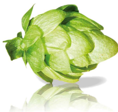
Obrázek 2.7: Odrůda Saaz special (HOP Products, 2021).

má podobné vlastnosti jako žatecký červeňák a odrůda Sládek. Využívá se na první nebo druhé chmelení a jedná se o odrůdu vhodnou pro ležáky (HOP Product, 2021).