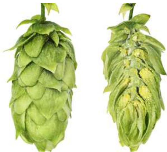
Obrázek 2.2: Odrůda Sládek (Bohemia Hop, 2022).

Další odrůdou je odrůda Kazbek. Tato odrůda má výnos 2,1-3,0 t/ha. Odrůda si udržuje hodnotu \alpha -hořkých kyselin v rozmezí 4,5-8,0 % (Nesvadba et al., 2012). Jedná se opět o pozdní chmel s dlouhou vegetační dobou, u kterého se provádí časný řez chmele (Ježek et al., 2015). Odrůda Kazbek se v pivovarnickém průmyslu využívá pro druhé chmelení, popřípadě pro chmelení za studena. Odrůda Kazbek obsahuje 2-4 % silic, což je příčinou jeho citrusového aroma v následně uvařeném pivu (Krofta et al., 2019).