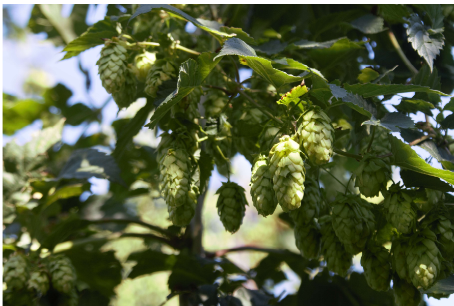
Obrázek 4.7: Chmelové hlávky v době sklizně.