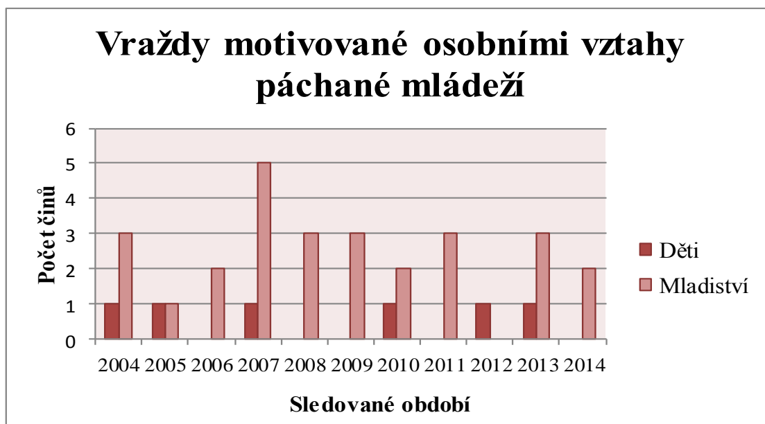
Graf 3: Vývoj počtu vražd motivovaných osobními vztahy spáchaných mládeží