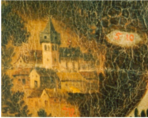
Sídliště Králova Lhota s dobově zakresleným gotickým kostelem v obrazové mapě panství Opočno.