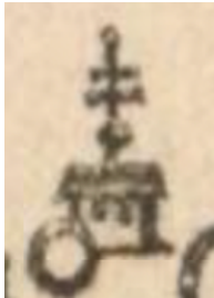
Značka kláštera v Müllerově mapě.