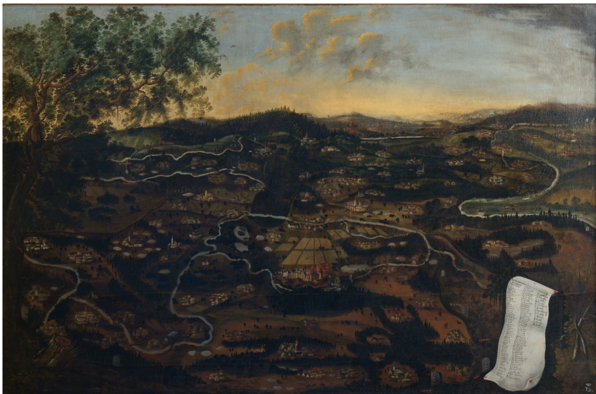
Obrazová mapa panství Opočno z roku 1667. Dostupné z fondu Památkového ústavu Josefov. Katalogové číslo: OP02403.