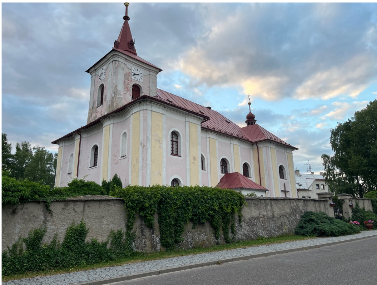
Kostel svatého Bartoloměje v Bystrém, vystavěný v letech 1716–1719.