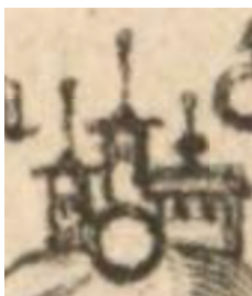
Značka městečka s trhem a zámkem v Müllerově mapě.