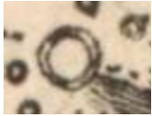
Značka sídliště bez kostela v Müllerově mapě.