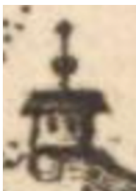
Značka zámku či hradu v Müllerově mapě.