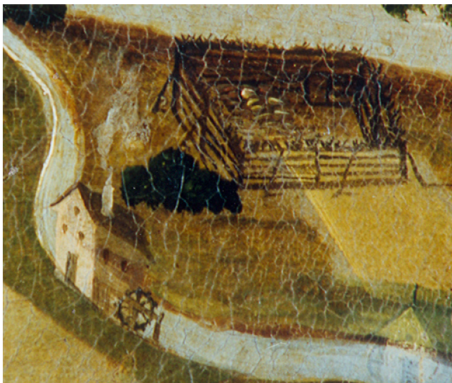
Zakreslený Ovčín a mlýn v obrazové mapě panství Opočno.