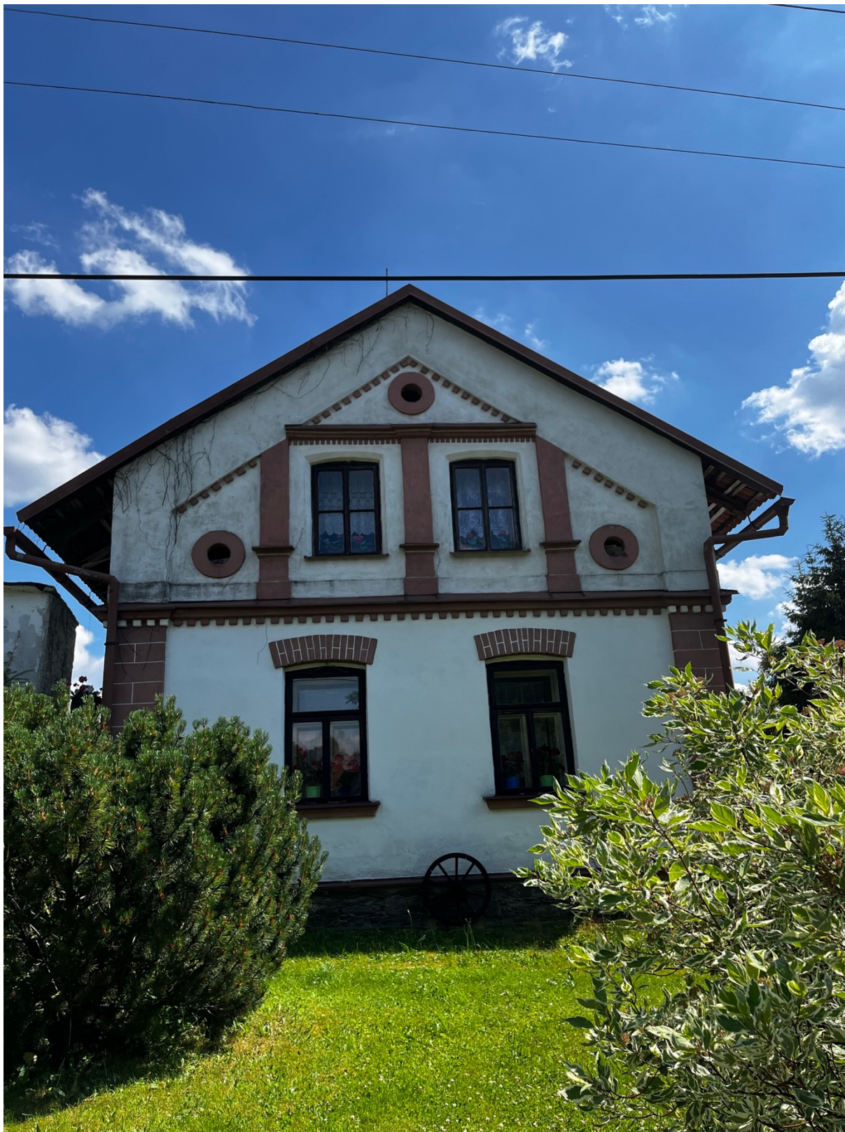
Bývalá kovárna v Bačetíně č. 31, byla postavena před rokem 1864, přesná datace chybí.