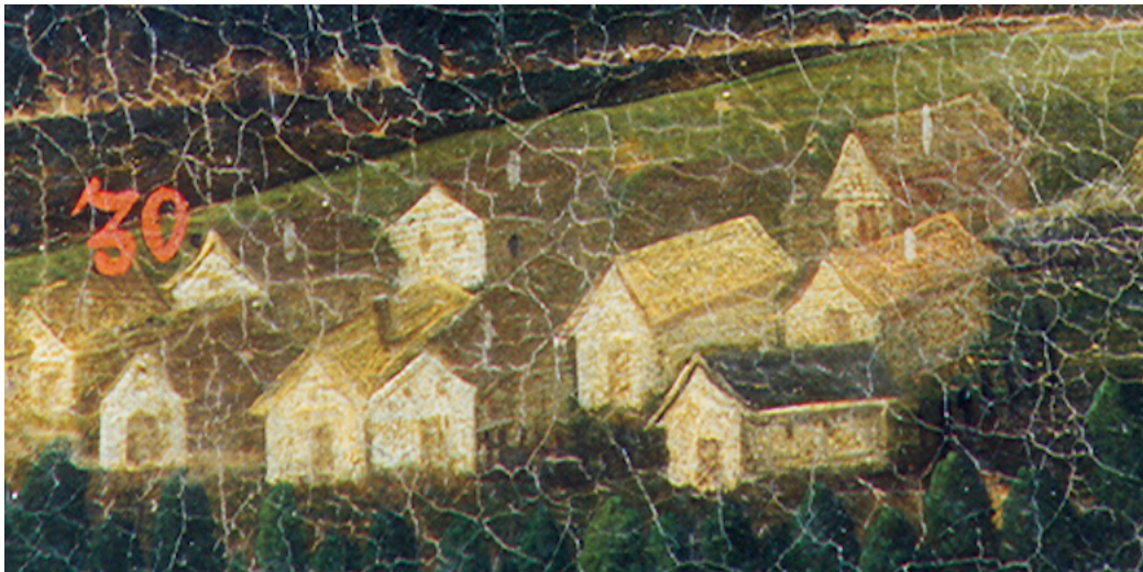
Schematicky zakreslené sídliště Bačetín v obrazové mapě panství Opočno.