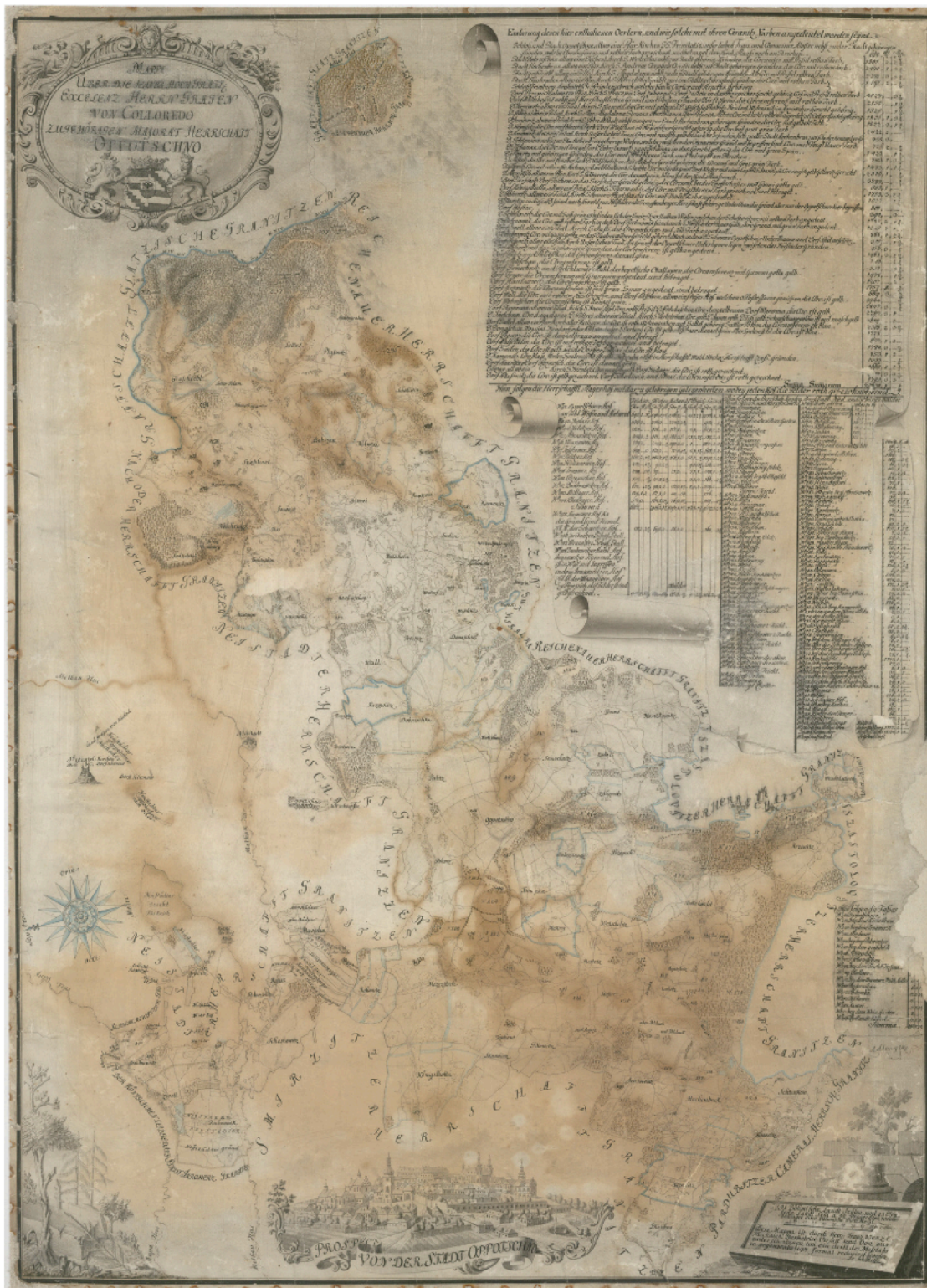
Mapa panství Opočno, datované přibližně rokem 1800, celek i s legendou – SOA Zámorsk, Vs Opočno, mapa č.2, nezpracované.