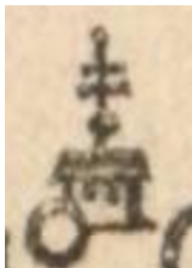
Značka kláštera v Müllerově mapě.