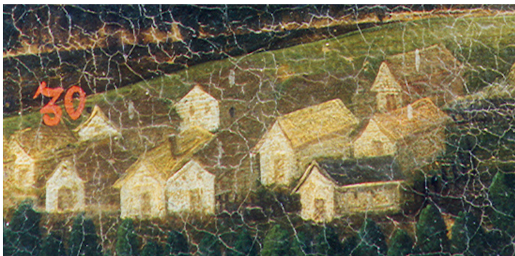
Schematicky zakreslené sídliště Bačetín v obrazové mapě panství Opočno.