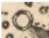
Značka sídliště bez kostela v Müllerově mapě.