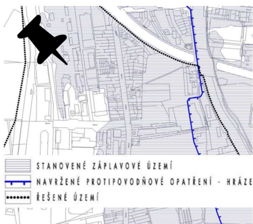
Obr. 7 – situační výkres záplavového území

V části města Brno-Horní Heršpice se nachází nejzásadnější vodní tok řeka Svratka a dle dané evidence záplavového území se daná část nachází z části v záplavovém území, jak je vyznačeno v daném situačním výkresu.