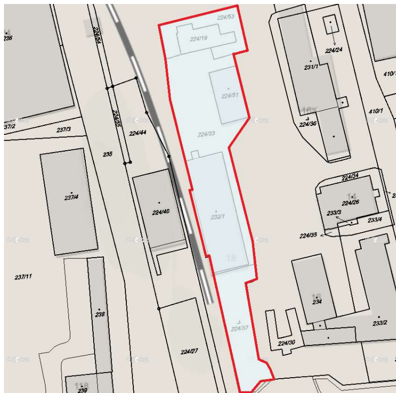
Obr. 2 - Situace s vyznačeným stavebním pozemkem

Samotný návrh novostavby autoservisu je na pozemcích s parcelními čísli: Parcelní číslo, 224/51, 224/33. Tyto parcely se nachází v katastrálním území Brno-Horní Heršpice [612065] (viz obr. 2).