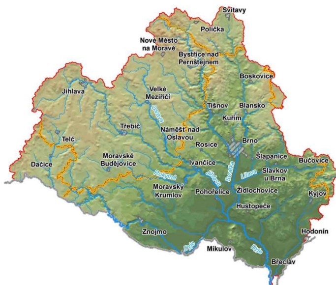
Obr. 6 – mapa hydrogeologických poměrů

Brno se nachází v oblasti povodí řeky Dyje, vodu odvádí prostřednictvím řeky Dyje do Moravy a dále do Dunaje. Hlavní pramenou oblast představuje východní a jižní část Českomoravské vrchoviny. V dané oblasti mají největší význam vodní nádrže budované na většině řek z Českomoravské vrchoviny (Dyje, Jihlava, Oslava, Svatka), vodní díla u nových Mlýnů na Dyji a u Dalešic na Jihlavě a dále rybníky na jižní Moravě. Mezi významná vodní díla v dílčím povodí Dyje patří vodní nádrž Dalešice, Mohelno, Mostišťe, Brno a Vír I. Brno vodní nádrž na toku Svatka provozovatelem je Povodí Moravy, s.p.- závod Dyje.