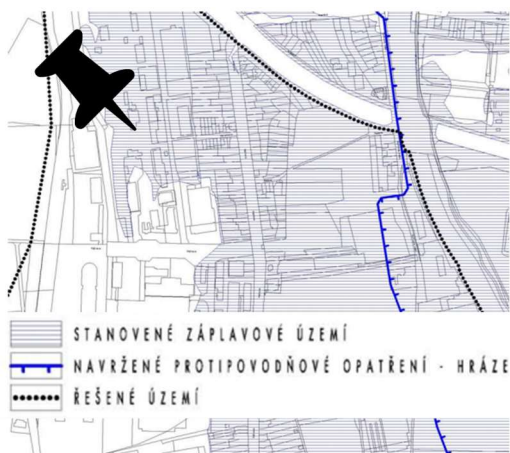
Obr. 7 – situační výkres záplavového území

Dle situačních výkresů města Brno – Horní Heršpice jsou již navržena protipovodňová opatření.