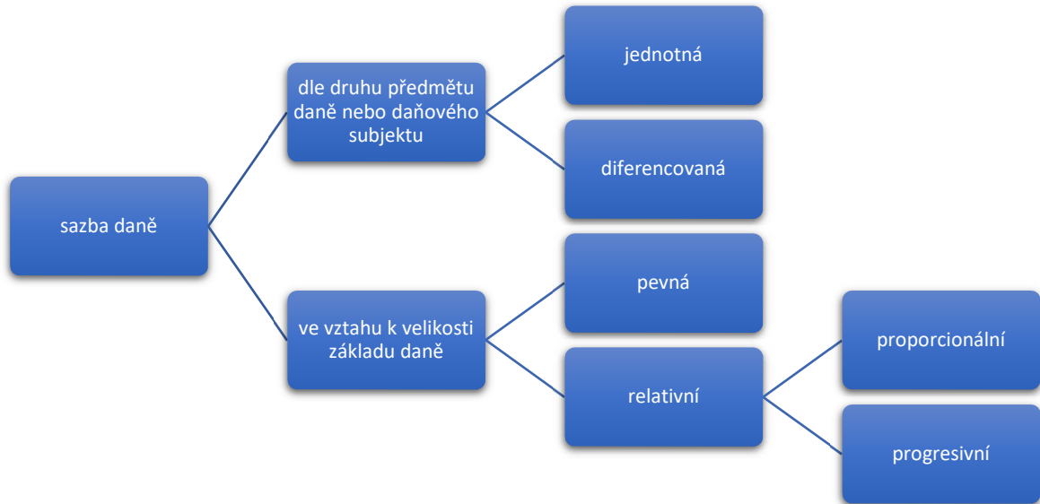
Schéma 2: Druhy sazeb daně