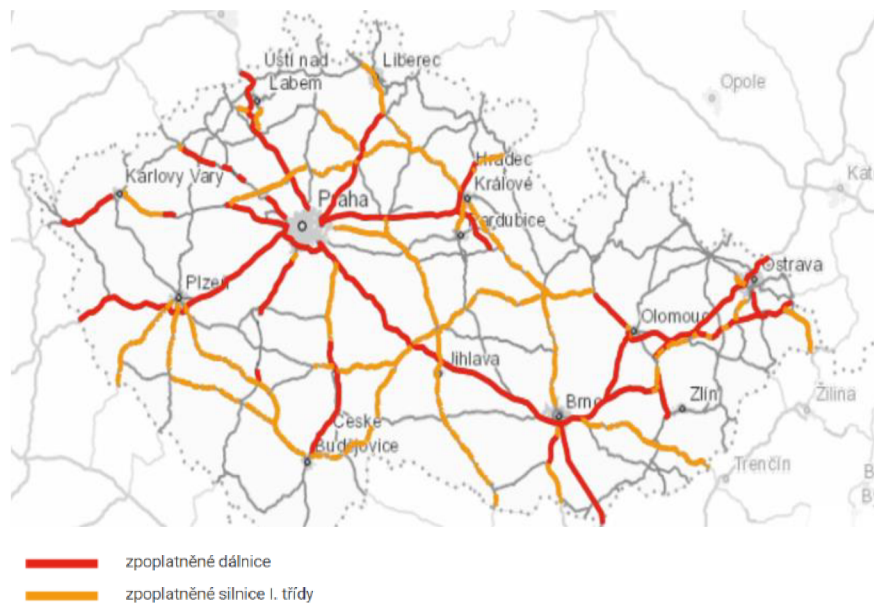
Obrázek 1: Přehled výběru mýtného na pozemních komunikacích v ČR