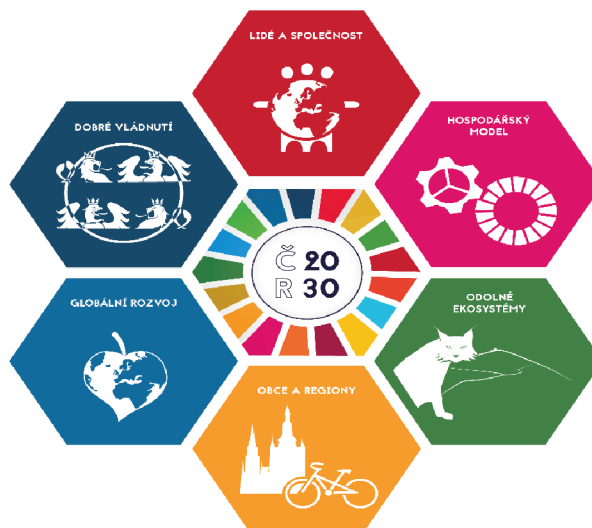
Obrázek 3: ČR 2030

k dispozici na oficiálních webových stránkách ( www.cr2030.cz ). O naplnění jednotlivých cílů rozhodují jednotlivá ministerstva, která se je snaží promítnout do krajských a obecních politik i každodenního života všech obyvatel.