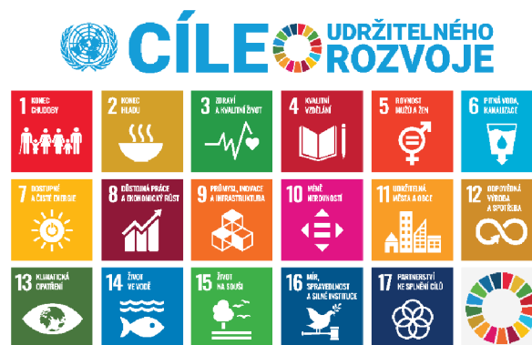
Obrázek 2: Cíle udržitelného rozvoje