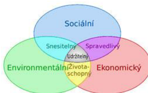
Obrázek 1: Pilíře udržitelného rozvoje

Dříve se udržitelný rozvoj zabýval pouze ochranou přírody. V současnosti se zabývá tématy nejen životního prostředí, ale také tématy dobrého a efektivní vládnutí a správy veřejných věcí. Důležitým pojmem, který je v souvislosti s udržitelným rozvojem nutné zmínit je politika životního prostředí. Ta slouží k tomu, aby se zlepšilo povědomí a informovanost veřejnosti o udržitelnosti. Dále politika životního prostředí napomáhá k tomu, aby cíle, které byly přijaty zákony, byly v souladu s environmentálními požadavky. Toho jde docílit podle (Mezřický, 2005) soustavnou činností veřejné správy, soudů a policejních orgánů.