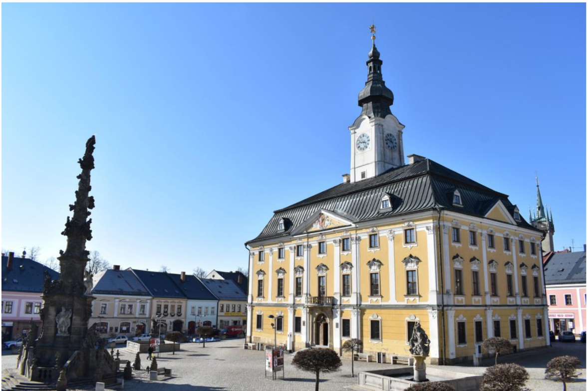
Obrázek 4-1 Palackého náměstí ve městě Polička

Město Polička se nachází v okrese Svitavy, v Pardubickém kraji. Město tvoří šest částí, a to Dolní Předměstí, Horní Předměstí, Město, Lezník (obec nacházející se 4 km na sever od Poličky byla k městu připojena v roce 1976), Modřec (obec nacházející se 5 km na jihovýchod od Poličky byla k městu připojena v roce 1974) a Střítež (obec nacházející se 4 km na severozápad od Poličky byla k městu připojena v roce 1980) ( www.policka.org ).