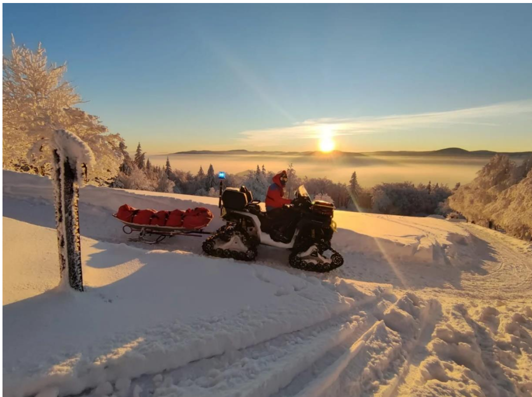
Obrázek č. 5 Čtyřkola vybavena pásovým „kitem“ pro jízdu ve sněhu 34

Mimo to horská služba v Krkonoších dále disponuje jedním speciální sněžným pásovým vozidlem, jež umožňuje komfortnější přepravu záchranářů nebo zraněných i skrze velmi náročným zasněženým terénem.