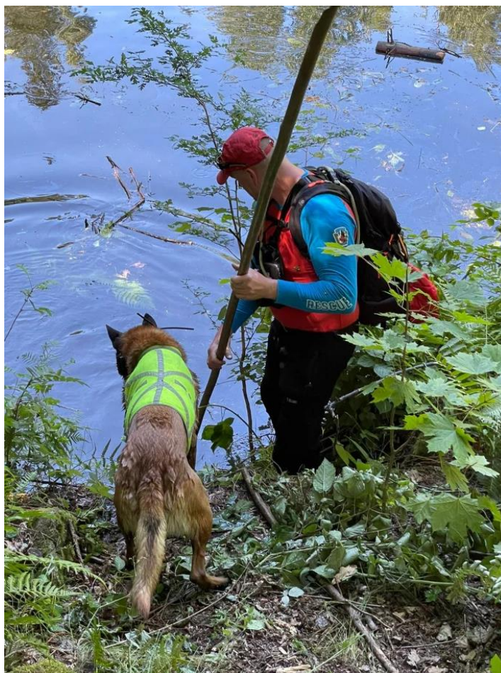
Obrázek č.3 Fotodokumentace z pátrací akce ze dne 8. 7. 2021 24