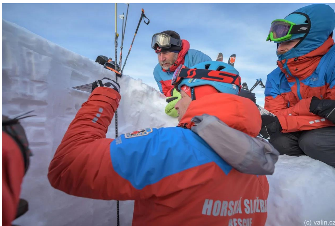
Obrázek č. 4 Lavinový kurz, ilustrační foto 33

Prognózní služba provádí vyhodnocení lavinového nebezpečí v několika krocích, které zahrnují specifické měření vybraných parametrů na lavinových svazích, vyhodnocení synoptické situace, jež zachycuje množství meteorologických prvků a výskyt meteorologických jevů v určitou dobu na daném území 32 , zpracování výsledků a následné vyhlášení zprávy pomocí veřejných prostředků. V souvislosti s lavinovým nebezpečím dále horská služba rozmisťuje výstražné tabule, které přímo varují před hrozícím lavinovým nebezpečím v dané oblasti.