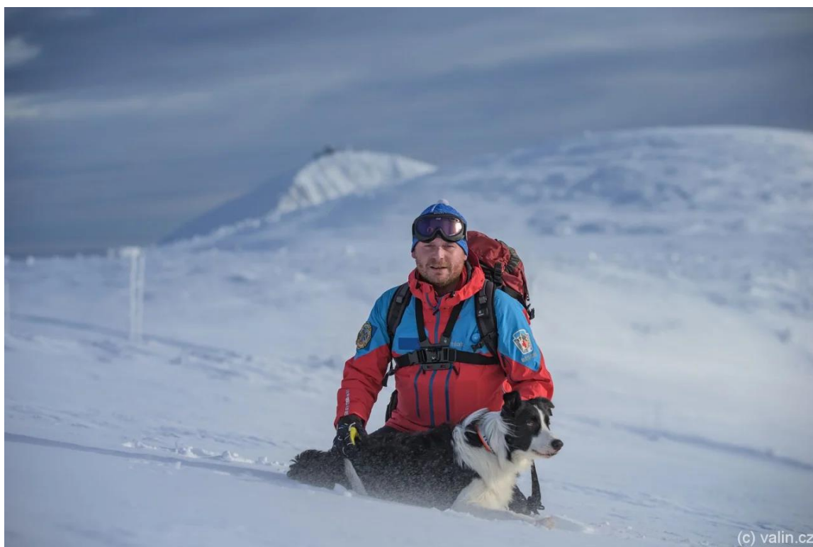
Obrázek č. 6 Ilustrační foto psovoda a psa horské služby 41