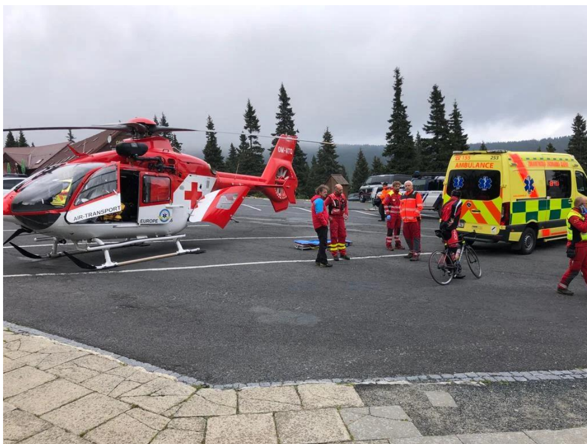
Obrázek č. 2 Spolupráce se zdravotnickou záchrannou službou 21