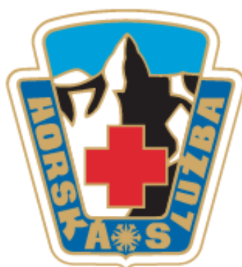
Obrázek č. 1 Znak horské služby 10

Horská služba jako celek funguje v rámci těchto dvou vzájemně propojených právnických osob, které mezi sebou uzavřely smlouvu o spolupráci a sdílení vzájemných úkolů dne 22. 12. 2004. Uzavřením této smlouvy zároveň došlo k převodu veškerého majetku spolku do vlastnictví nově vzniklé obecně prospěšné společnosti výměnou za zajištění třetiny míst ve správní a dozorčí radě, materiálního vybavení a výcviku včetně možností využívat prostředky pro záchranu. „Služba je zajišťována na 6 460 km 2 , z toho 2 250 km 2 tvoří exponovaný terén, dále 3 042 km běžecské trasy“. 11 Vnitřní sjednocení obou horských služeb je zcela zásadní pro správné plnění všech úkolů, které horské službě jako vzniklému celku náleží. Tyto úkoly lze dále rozdělit do dvou skupin dle působnosti, ve které jsou vykonávány – působnost v IZS a samostatná.