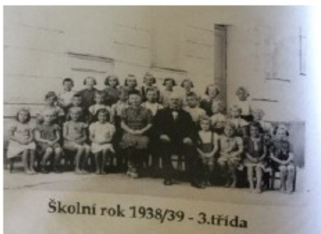
Školní rok 1938/39 - 3.třída