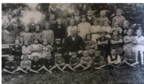
Školní rok 1935/36 - 3.třída