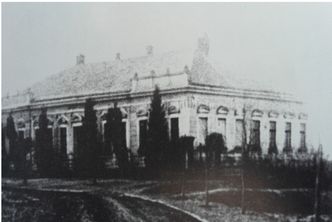
Příloha č. 6: Původní budova obecné školy z roku 1907