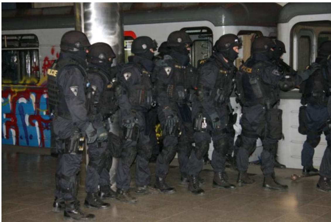
Obrázek 4: Policisté zásahové jednotky, nebo prvosledových hlídek

Policista v běžném výkonu služby je vybaven pistolí CZ 75 D Compact, dvěma zásobníky po 14 nábojích, obuškem, pouty, slzotvorným prostředkem, balistickou vestou a radiostanicí. Naproti tomu aktivní střelec může mít více zbraní, účinné střelivo, například s řízenou deformací, nebo vojenské střelivo s ocelovým jádrem, dlouhou zbraň, např. samopal vz.58, výbušniny (granáty, apod.), ale může mít také balistickou ochranu.