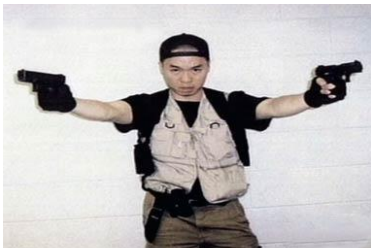
Obrázek 1: Jak může vypadat aktivní střelec