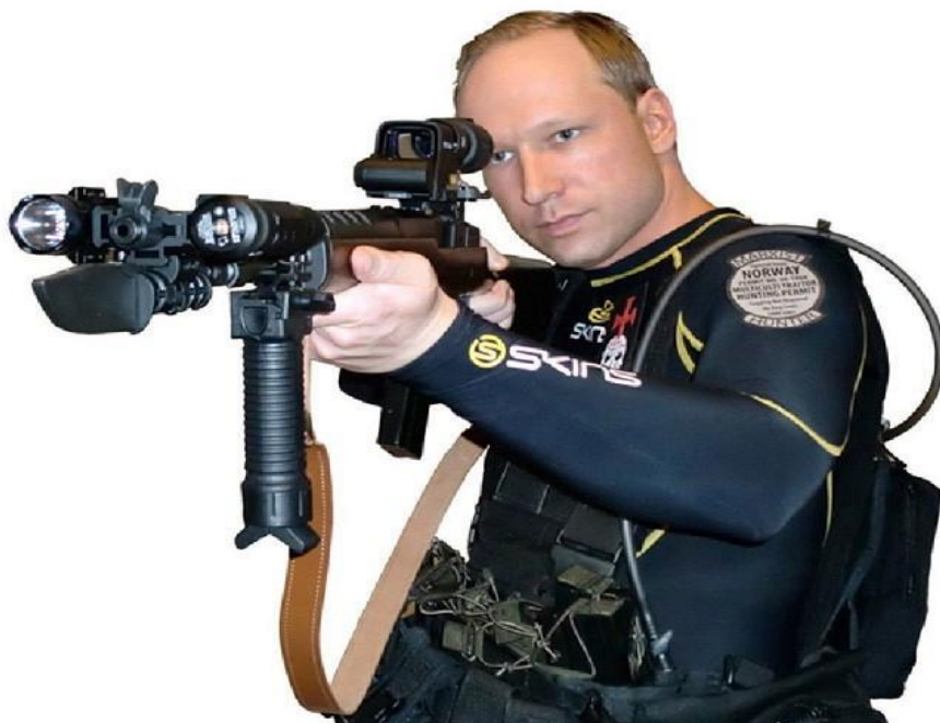
Obrázek 2: Anders Behring Breivik