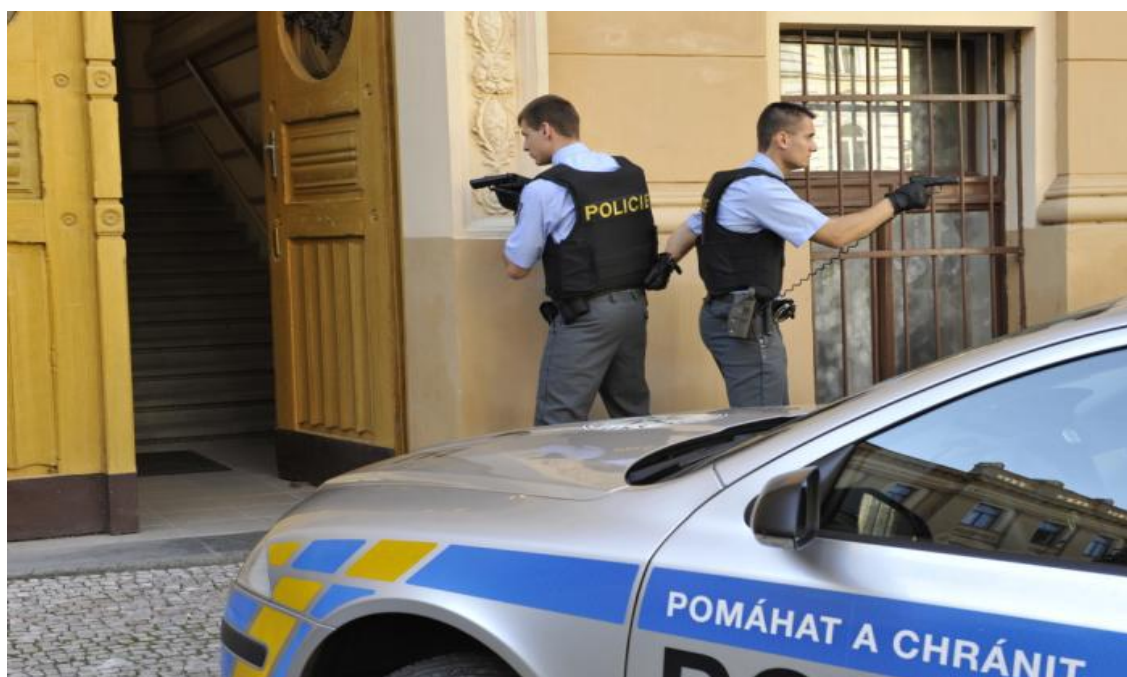
Obrázek 7: Výcvik hlídek na zákrok proti aktivnímu střelci v budově

předpoklad, že policista určený do prvosledové hlídky splňuje parametry, aby mohl zdárně vykonávat i tuto činnost. Součástí výcviku prvosledových hlídek, který probíhá čtyřikrát měsíčně je i nácvik taktických postupů při zadržování pachatele na veřejných prostranstvích, ve vozidle, v budovách atd. Výcvik je rozšířen i na střeleckou přípravu, kde se policisté učí používat speciální zbraně a i v této oblasti si zdokonalují své dovednosti, aby mohli adekvátně reagovat. Při následných zákrocích mohou aplikovat i zkušenosti získané z výcviku pořádkové jednotky. Výkon služby prvosledových hlídek je nepřetržitý, kdy dvoučlenná hlídka policistů vybavená shora uvedeným vybavením s přiděleným služebním dopravním prostředkem vykonává službu v rámci určitých teritorií, aby v případě nastalého incidentu mohla včas a adekvátně zakročit a započít zákrok proti šílenému střelci.