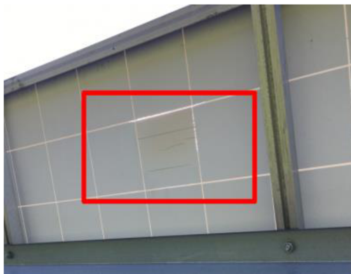
Obrázek 3: ukázka poškozených panelů [50]

Náklady na opravu: Opravy a renovace použitých solárních panelů mohou zahrnovat výměnu poškozených součástí, jako jsou solární články, zapouzdřovací materiály nebo vrstvy zadní strany, a také čištění a opětovné testování panelů, aby byla zajištěna jejich funkčnost a bezpečnost. Náklady na opravu solárních panelů se mohou výrazně lišit v závislosti na rozsahu poškození a konkrétních součástech, které je třeba vyměnit. Ve studii Mendonca (2009) autor odhaduje, že průměrné náklady na opravu solárního panelu se pohybují od 20 do 90 EUR na článek v závislosti na typu a rozsahu potřebných oprav [30]. Na obrázku č. 3 je zobrazena ukázka poškozeného tedlaru.