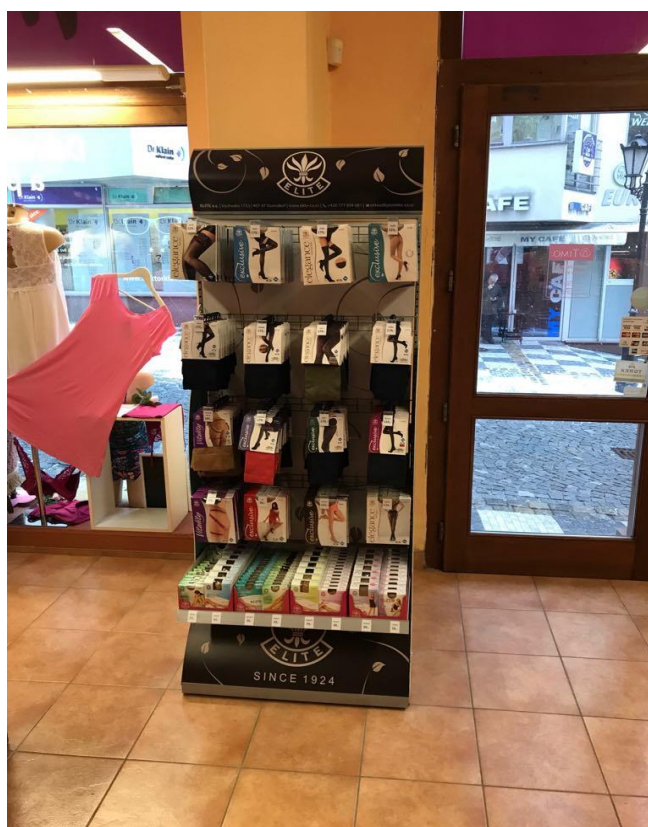
Obr. 5: Firemní stojan firmy Elite a.s.

Většina prodejen na nabídku reagovala spíše záporně, a to buď z důvodu malého prostoru, nebo mají jiné firemní stojany od konkurenčních značek. Prodejna v ulici 5. května, zboží firmy Elite a.s. nenabízí, ale zájem by o firemní stojan měla v malé velikosti a v papírové podobě, který by byl umístěný na prodejním pultu.