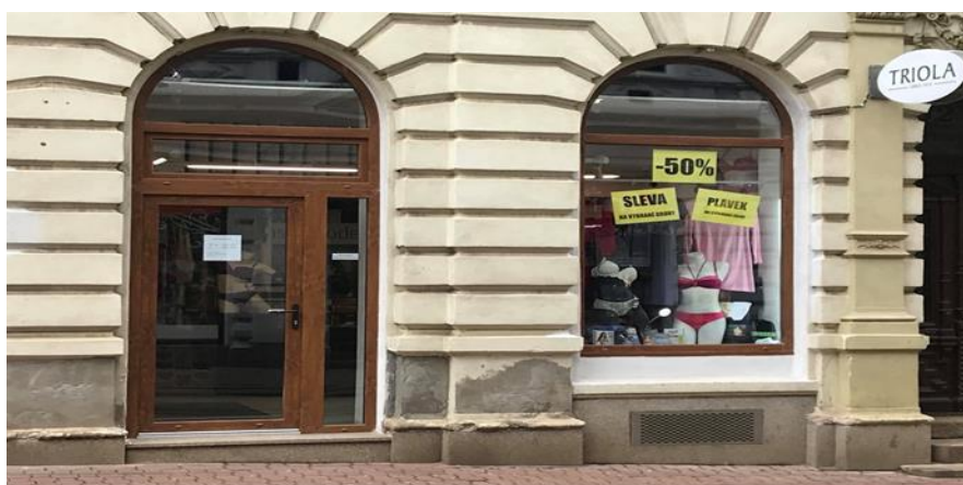
Obr. 7: spodní prádlo Triola v ulici 5. Května

V Liberci byl také nalezen jeden nový potenciální odběratel. Jedná se o prodejnu spodního prádla Triola v ulici 5. května (viz. obrázek 7).