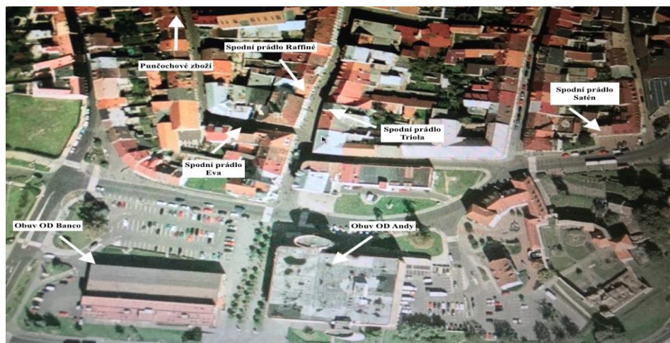
Obr. 3: Mapa města s prodejny v České Lípě

Ve městě bylo zjištěno, že dva obchody vůbec nenabízejí punčochové zboží, ale mohly by ho do svého sortimentu zahrnout. Jedná se konkrétně o svatební studio Nella v ulici U Vodního hradu a o pánskou a dámskou módu, kterou lze najít na tržním náměstí. Těmto prodejnám byly nabídnuty produkty punčochového zboží firmy Elite a.s., ale bohužel tyto dvě oslovené prodejny neměly zájem. Veškeré zjištěné informace jsou uvedeny v příloze 6.