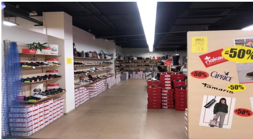
Obr. 6: Prodejna obuvi v OD Banco v ulici Sokolská

Specializují se spíše na prodej obuvi, ale punčochové zboží by měli jako doplněk ke svému sortimentu. Byl zde nabídnut i firemní stojan na zboží firmy Elite a.s., ale kvůli malému prostoru byl odmítnut.