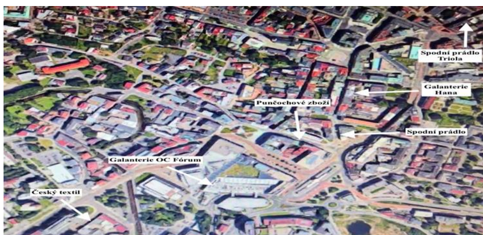
Obr. 4: Mapa města s prodejnami v Liberci

Liberec je stotisícové město, které kulturně žije, a proto je předpokládáno, že ženy budou nakupovat více punčochového zboží.