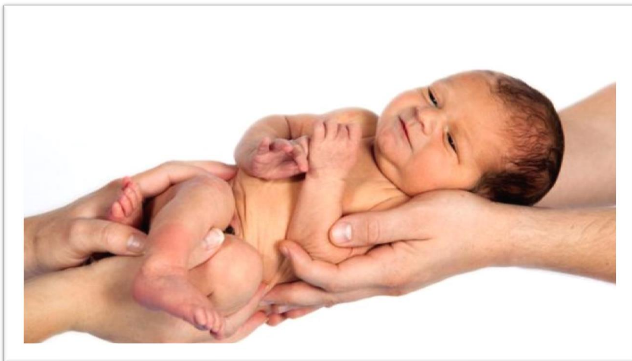
Obrázek č. 1: Soudržnost 1

„Všichni dospělí byli dětmi, ale málokdo si na to pamatuje.“