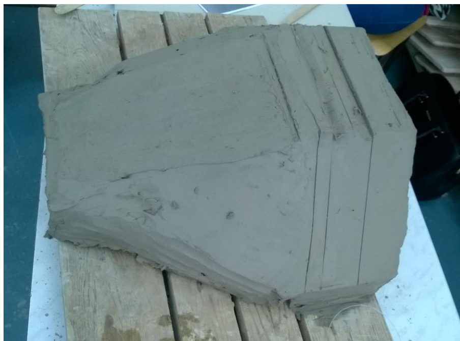
Obr. 9: Základní blok hmoty