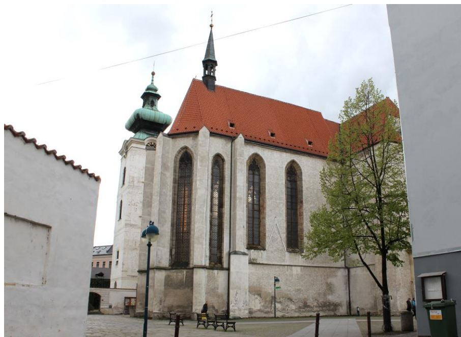
Obr. 2: Klášterní kostel Obětování panny Marie, dnešní podoba