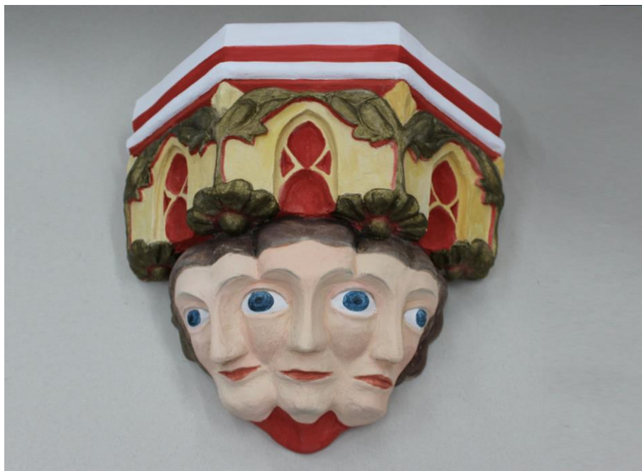
Obr. 14: Finální podoba objektu jako prvku sloužícímu k hapticko-taktilnímu vnímání osob se zrakovým postižením s motivem Svaté Trojice