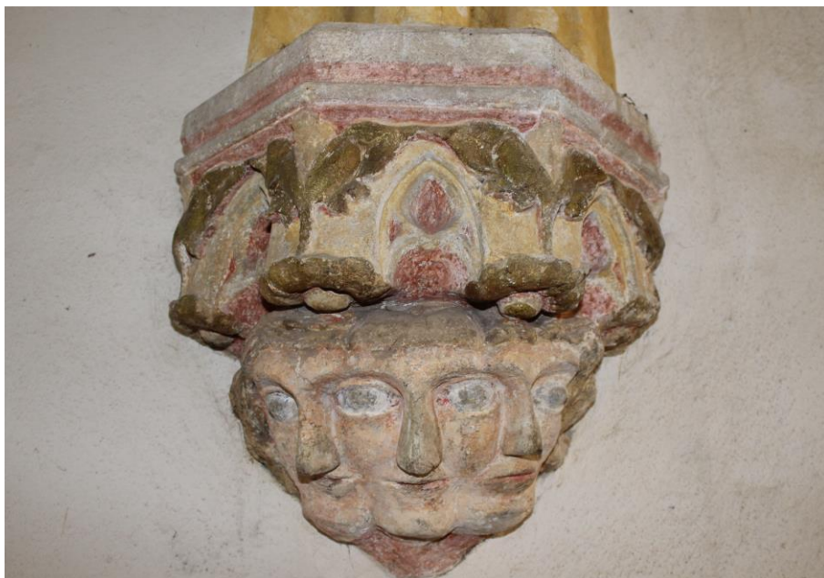
Obr. 5: Původní konzola s motivem Svaté Trojice