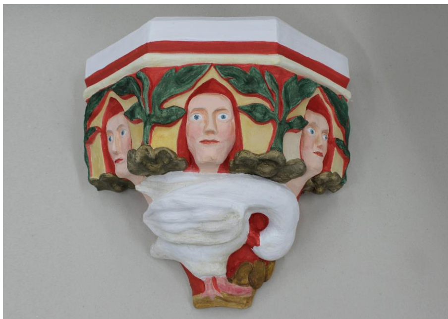
Obr. 15: Finální podoba objektu jako prvku sloužícímu k hapticko-taktilnímu vnímání osob se zrakovým postižením s motivem pelikána krmícího svá mláďata