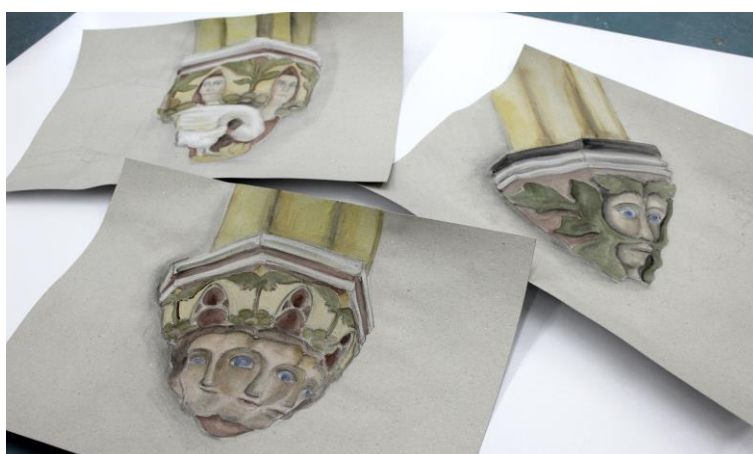
Obr. 8: Skici námětu a barevného řešení