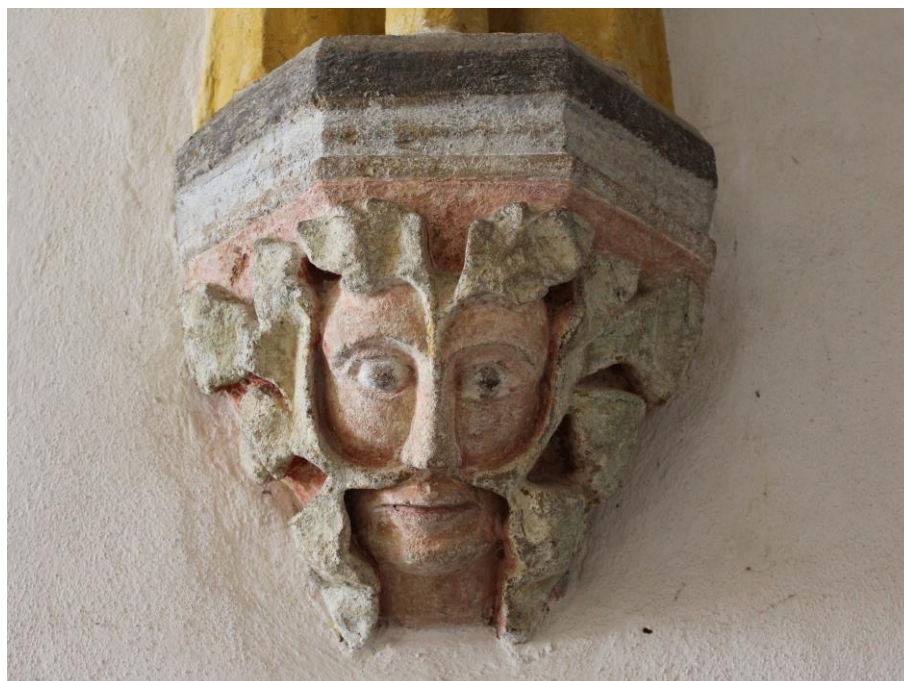
Obr. 4: Původní konzola s motivem divého muže