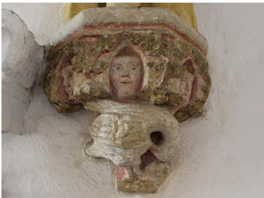
Obr. 6: Původní konzola s motivem pelikána krmícího svá mláďata