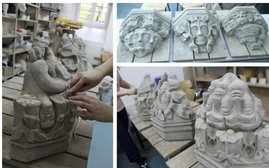
Obr. 12: Vyschlé objekty a jejich povrchová úprava