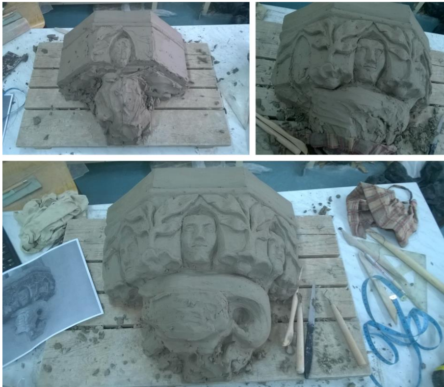
Obr. 10: Postupná modelace