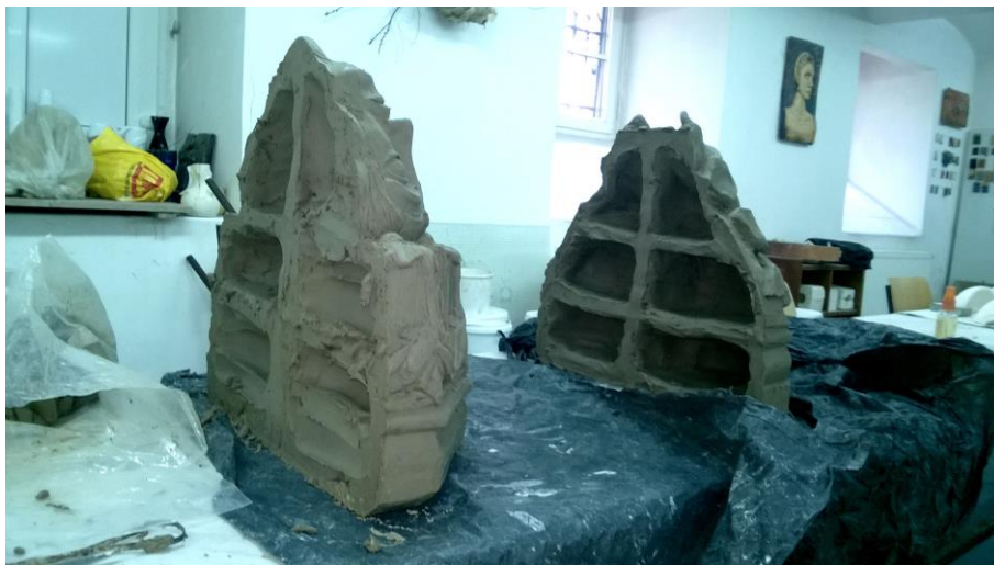
Obr. 11: Vybrání vnitřní hmoty