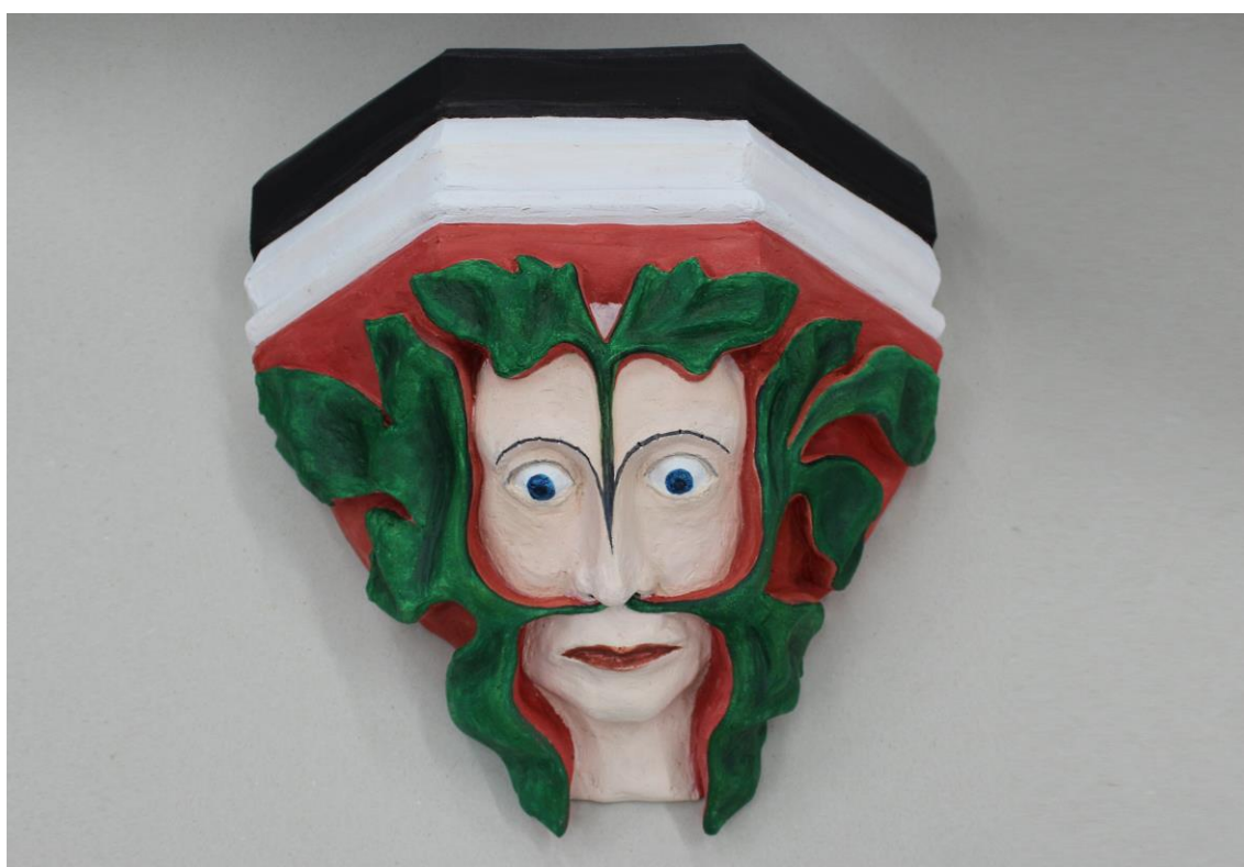
Obr. 13: Finální podoba objektu jako prvku sloužícímu k hapticko-taktilnímu vnímání osob se zrakovým postižením s motivem divého muže