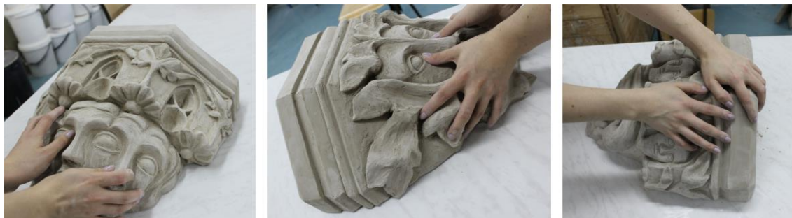
Obr. 7: Hapticko-taktilní vnímání prostoru