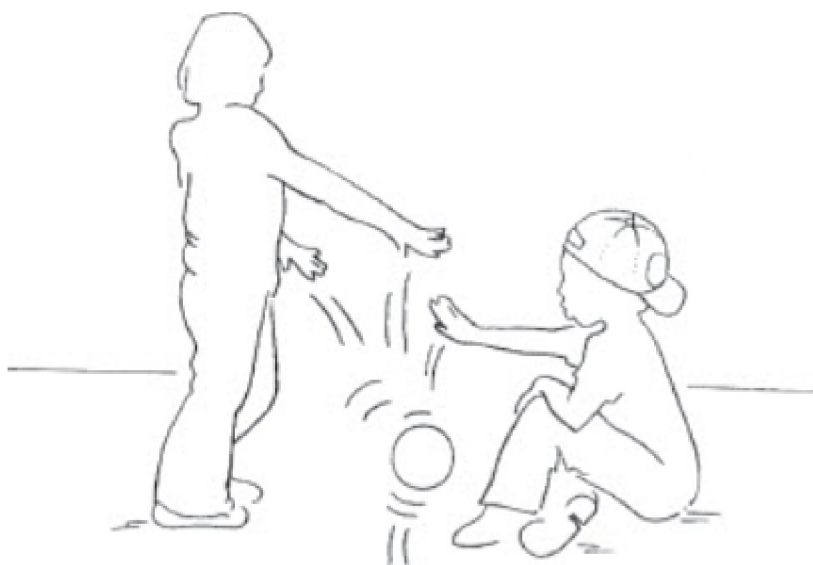
Obr. 2: Ukázka tabule AAP - neutrální podnět (George & West, 2012)

Administrace AAP trvá přibližně 30 minut a probíhá v soukromí. Jedinci je předložena kresba, může ji uchopit, a je požádán, aby popsal, co se na obrázku děje, včetně pozadí událostí, myšlenek nebo pocitů postav a toho, co bude následovat: “Popište, co se na obrázku děje, co k událostem vedlo, co si postavy myslí nebo co cítí, a co se bude dít dál.” Odpovědi jsou nahrány pro další transkripci a analýzu (podrobněji dále).