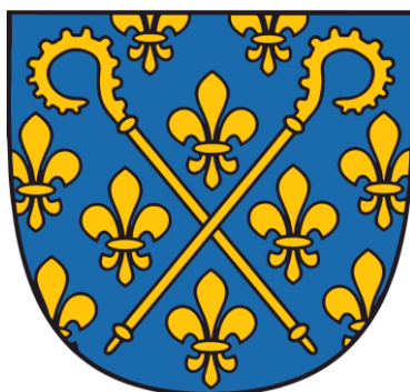
Obrázek č. 1 Znak premonstrátského řádu

Řeholní oděv premonstrátů je bílý, nebarvený hábit – proto jsou někdy premonstráti nazýváni „bílí bratři“. Dále škapulíř, cingulum, biret a v chóru je užívána mozeta s malou kapucí. 6