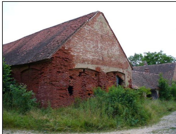
Obrázky č. 9 a 10 Hospodářské budovy – dvůr Nová Říše, r. 2014