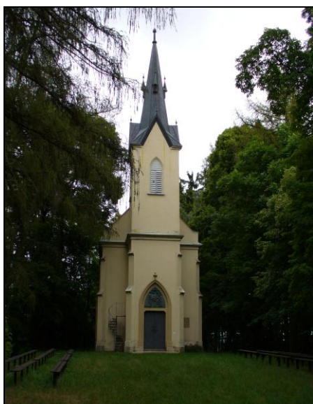
Obr. č. 19 Kaple Narození Panny Marie u Krasonic, r. 2014

Novoříšská kanonie při správě pěti farností vytvořila v brněnské diecézi jakousi vlastní malou církevní provincii. 224 Katastrální území, která spadala do této oblasti, měla celkovou rozlohou 11.298 ha. 225 V třicátých letech 20. století zde žilo přes 6.000 obyvatel a téměř všichni se hlásili k římsko-katolickému vyznání. 226