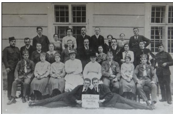
Obrázek č. 16 Jednota Orla v Nové Říši, r. 1922 192

tělovýchovného cvičení se věnovali také zpěvu, recitaci nebo podnikali společné výlety do okolí. Spolek provozoval také vlastní knihovnu, která měla v roce 1927 300 svazků, a pravidelně jí navštěvovalo 70 čtenářů. 190 Členové každoročně pořádali ples a nacvičovali divadelní hry pro veřejnost. V letech 1921 až 1928 odehráli celkem 28 divadelních představení. Kromě divadelních her pro dospělé hráli členové také každé nedělní odpoledne v klášteře loutkové divadlo pro děti. 191