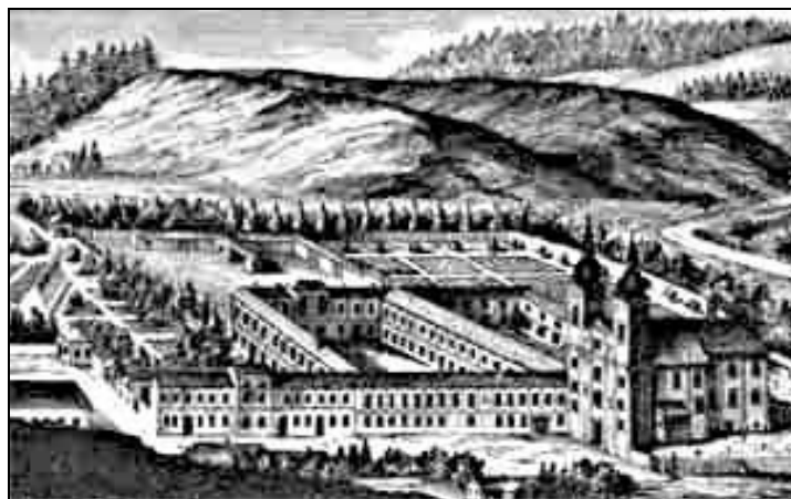
Obrázek č. 2 Původní podoba kláštera v Nové Říši

od Jana Lukáše Krackera. Největším úspěchem v tomto období bylo ale to, že za josefinských reforem nebyl klášter zrušen.