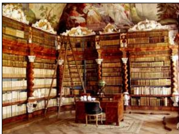
Obrázek č. 15 Klášterní knihovna – současný stav

Klášteř spravoval také velmi cennou knihovnu, která čítala 17.000 svazků z rozličných věd a tato knihovna byla veřejně přístupná. 187