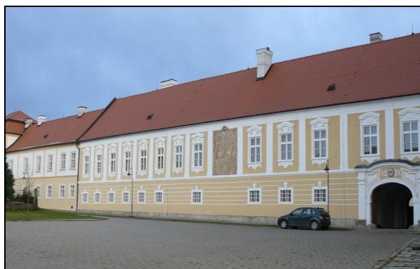
Obrázek č. 18 Klášter po rekonstrukci, r. 2008

Klášter podporoval příležitostně také další kulturní akce v okolí. Tak např. v roce 1934 daroval 500,- Kč na koncert sboru Moravan v Dačicích. 196