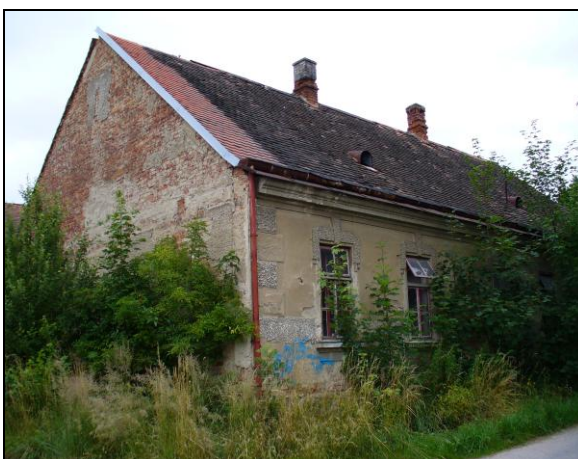
Obrázek č. 12 Dům správce velkostatku, r. 2014

Odpověď na to, zda byl klášterní velkostatek důležitý nejen pro řád premonstrátů v Nové Říši, ale také pro obyvatelstvo v nejbližším okolí, najdeme v dalších částech této práce.