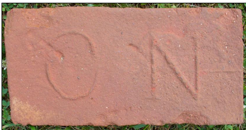
Obrázek č. 6 Cihla z klášterní cihelny v Nové Říši, r. 2014

K dispozici byly dvě pece, ale páliło se vždy jen v jedné z nich, zpravidla jedenkrát ročně. Roční produkce cihlářských výrobků se pohybovala mezi cca. 20.000 – 30.000 kusy. 70