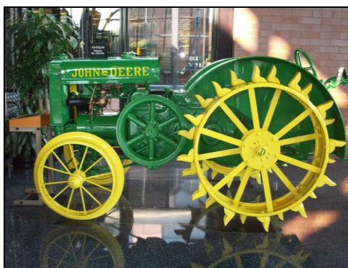
Obrázek č. 7 Traktor John Deere 15/27PS – ilustrační fotografie

Díky tomu mohl velkostatek zvyšovat produktivitu zaváděním technických inovací a novinek, mezi které patřilo např. motokolo pro správce velkostatku, zakoupené v roce 1926. 83 V roce 1931 nahradil starší traktor Fordson nový traktor John Deere 15/27PS. 84 Používání traktoru v té době bylo spíše neobvyklé, protože v roce 1930 v ČSR obstarávali tažnou sílu především koně, krávy a voli. Pouze 3% tažné síly vykonávaly traktory. 85