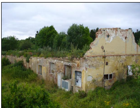
Obrázek č. 11 Dvůr Sedlatice, r. 2014