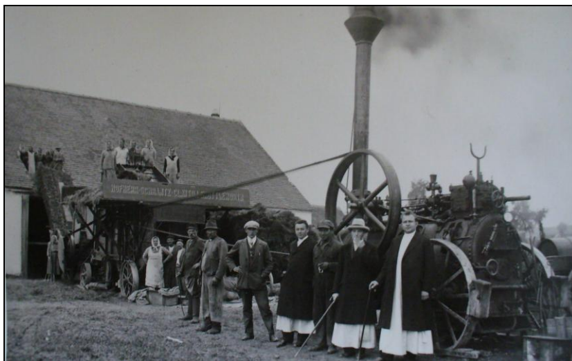
Obrázek č. 8 Řeholníci a zaměstnanci velkostatku Nová Říše u parní mlátičky, r. 1930

Klášterní velkostatek používal nové stroje na zpracování půdy a měl vlastní parní mlátičku. 87