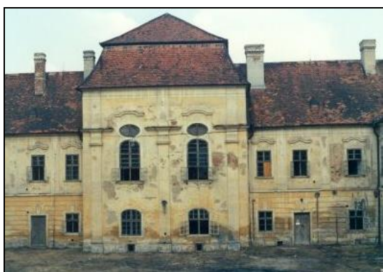
Obrázek č. 17 Klášter po navrácení, r. 1990

V roce 1938 – 1939 proběhly rozsáhlé a nákladné opravy klášterního chrámu. 194 Novoříšská kanonie se starala dále o fary, kostely, kaple a Boží muka okolních inkorporovaných farností – ve Staré Říši, Krasonicích, Dlouhé Brtnici, Rozseči a dále v Brně Židenicích. Areál kláštera byl pečlivě udržován až do uskutečnění „Akce K.“, kdy komunisté vyhnali řeholníky z jejich domovů. Areál kláštera byl ve výborném stavu a církevní tajemník ve své správě dokonce navrhoval, aby byl klášter využit jako rekreační středisko. 195