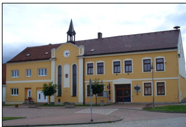
Obrázek č. 13 Obecní úřad Nová Říše, r. 2014

pomáhal chudým, sirotkům a nemocným. 128 V roce 1878 byl ústav vysvěcen a převzala ho kongregace Milosrdných sester sv. Karla Boromejského. Už při budování tohoto ústavu byl jedním z hlavních podporovatelů klášter, který poskytl finanční dary na výstavbu a zajistil dovoz stavebního materiálu. Ústav sídlil v čísle popisném 41, který místní obyvatelé nazývali „kláštyrek“. Dnes se v této budově nachází Úřad městyse Nová Říše.