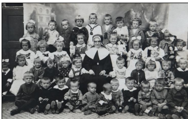
Obrázek č. 14 Děti z dobročinného ústavu v Nové Říši – 1. pol. 20. století

Hlavními příjmy spolku nebyly členské příspěvky, nýbrž úroky a dividendy z držených cenných papírů, nájem z pronajatých pozemků, příspěvek na učitelku, příspěvky na školu a příspěvky na sirotky od Nové Říše a okolních obcí. Klášter a klášterní velkostatek se organizačně podílely na chodu ústavu a kromě finančních darů podporovaly ústav také materiálně, např. tím, že ústavu dávaly dřevo na topení. 134