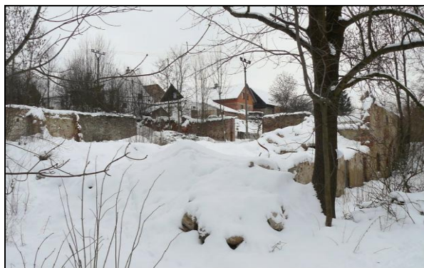
Obrázek č. 4 Původní pivovar – 1. pol. 20. století Obrázek č. 5 Torzo klášterního pivovaru, r. 2009