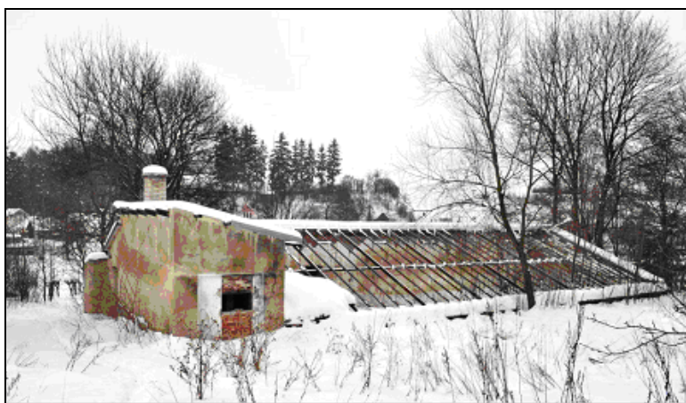
Obrázek č.3 Skleník v klášterní zahradě, r. 2010

Na rostlinné produkci se podílelo také klášterní zahradnictví. Z ročního výkazu za rok 1925 můžeme vidět, že zaměstnanci zahradnictví pěstovali a prodávali následující plodiny a výpěstky: ovoce, zeleninu, květiny a sazenice, ovocné stromky. 56