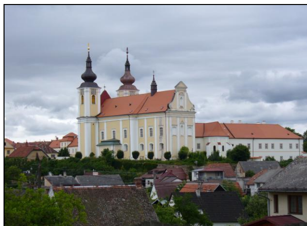
Obrázek č. 21 Kostel sv. Petra a Pavla a areál kláštera Nová Říše, r. 2014