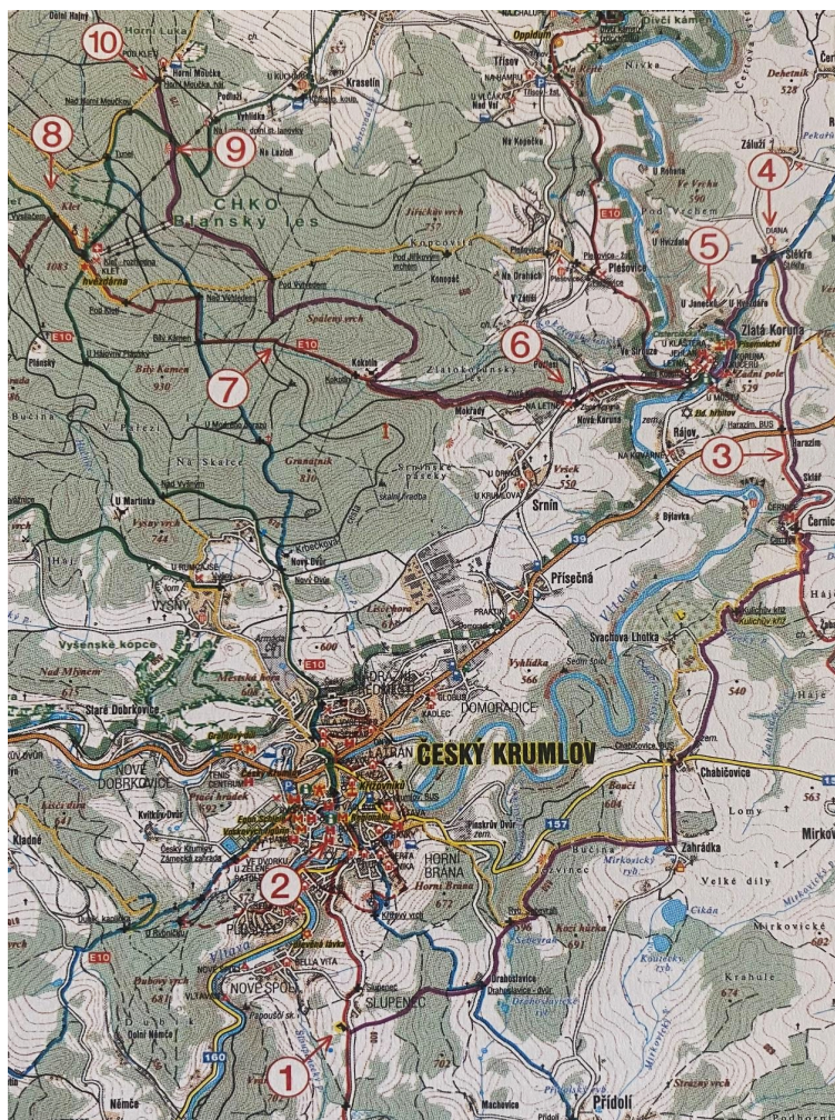
Obrázek 5 Stezka -Po stopách koní pánů Rožmberka