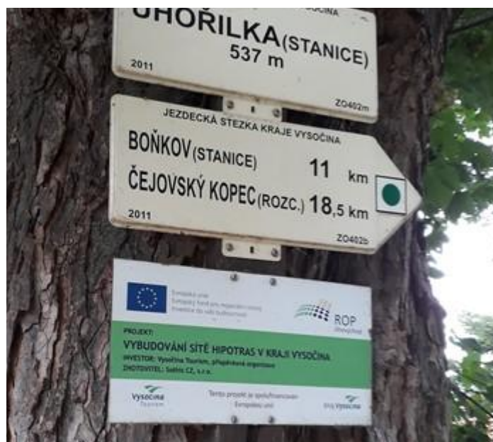
Obrázek 4 Směrovka na trase v kraji Vysočina

Tabulky a směrovky se na trasách pro putování na koni opět neliší, jak barvou tak textem od těch, které značí pěší turistiku, a to také platí o pravidlech pro jejich umístění. Jediným znakem odlišující jezdeckou značku od té pěší je uvedený text v rohu značky - Jezdecká stezka KČT (Pobořilová, 2014).