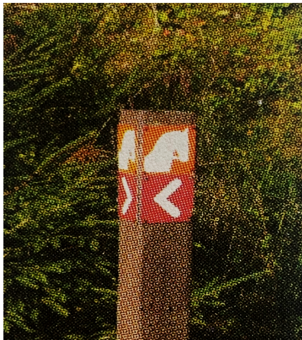
Obrázek 8 Rakouské značení jezdeckých stezek, Zdroj: (Andrlová, 2008)

Rakousko je skvělým příkladem, který jen dokazuje, že ačkoliv je sousedním státem naší země, pravidla pro hipoturistické stezky a značení jsou odlišné od těch našich. Pravidla, které upravují pohyb koní na stezkách jsou velmi striktní. Stezky jsou označeny na sloupech čtvercovými tabulkami, na kterých je hlava koně. Na těchto sloupech jsou uvedeny i směrovníky se vzdáleností dané trasy. Oproti České republice je jízda na některých stezkách zpoplatněná a tyto vybrané peníze jsou dále využity na výstavbu nových stezek či údržbu těch starších.