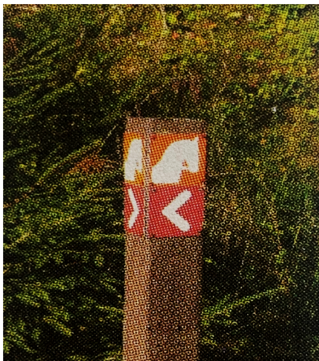
Obrázek 8 Rakouské značení jezdeckých stezek, Zdroj: (Andrlová, 2008)

Rakousko je skvělým příkladem, který jen dokazuje, že ačkoliv je sousedním státem naší země, pravidla pro hipoturistické stezky a značení jsou odlišné od těch našich. Pravidla, které upravují pohyb koní na stezkách jsou velmi striktní. Stezky jsou označeny na sloupech čtvercovými tabulkami, na kterých je hlava koně. Na těchto sloupech jsou uvedeny i směrovníky se vzdáleností dané trasy. Oproti České republice je jízda na některých stezkách zpoplatněná a tyto vybrané peníze jsou dále využity na výstavbu nových stezek či údržbu těch starších.