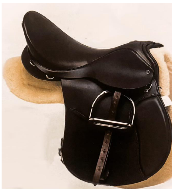
Obrázek 2 Drezurní sedla, Zdroj: (Edwards, 1992)

Je známý také jako evropský styl. U tohoto stylu je výhodou, že oproti westernovému stylu ježdění, který je vhodný především pro práci na rovinné ploše, se anglické sedlo díky snadné úpravě třmenů na sedle, hodí jak pro aktivity na rovinné ploše, tak i pro skoky. Při ježdění anglického stylu je též výhodné to, že pravidla, ačkoliv jsou velice přísná, jsou jednoduchá na zapamatování, avšak povely pro koně jsou jednoduché a není příliš obtížné koně povely naučit (Cleggová a Harrisová, 2007).