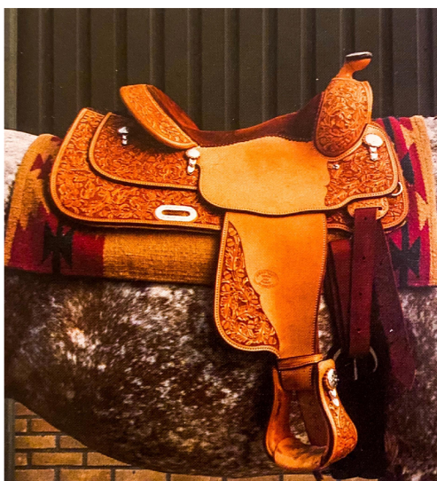
Obrázek 1 Westernové sedlo

Westernové ježdění vzniklo na západě USA. Do světa se rozšířilo díky španělským dobyvatelům do Nového světa. Westernoví koně jsou velice vnímaví, pokud je kůň dobře vycvičený, můžeme jeho chování snadno předvídat až tak, že se jezdí s minimálním kontaktem. Dnes je westernový způsob jízdy také soutěžní sport mající velmi specifické prvky (Cleggová a Harrisová, 2007).