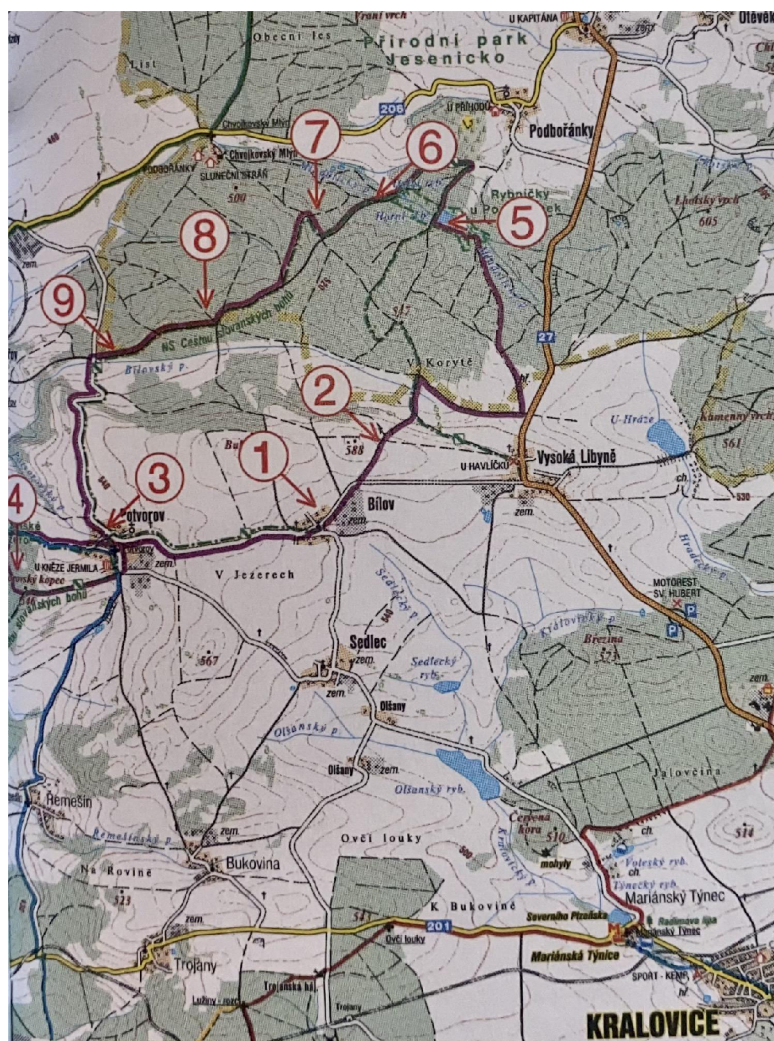
Obrázek 6 Stezka - Cestou slovanských bohů