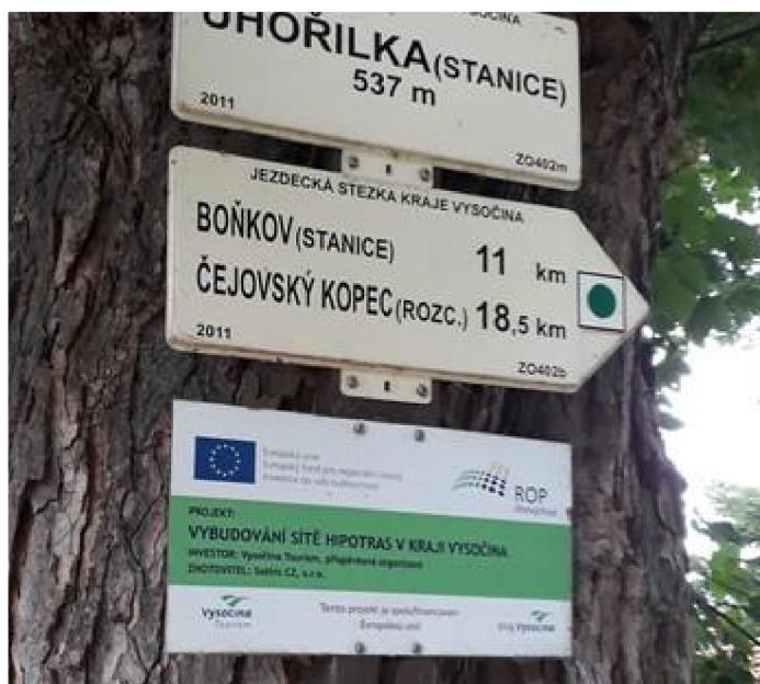
Obrázek 4 Směrovka na trase v kraji Vysočina, Zdroj: (vysocinatourism.cz)

Tabulky a směrovky se na trasách pro putování na koni opět neliší, jak barvou tak textem od těch, které značí pěší turistiku, a to také platí o pravidlech pro jejich umístění. Jediným znakem odlišující jezdeckou značku od té pěší je uvedený text v rohu značky - Jezdecká stezka KČT (Pobořilová, 2014).