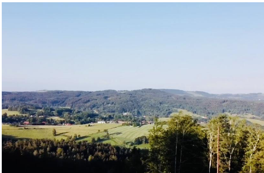
Obrázek 10 Výhled z rozhledny Proseč, Zdroj: (Vlastní)

navrhované trasy. Odtud vede cesta stejným směrem k TJ JO Nisa. Trasa má přibližně 10 km a při standardní vyjížďce je její časová náročnost okolo 1,5 hodiny.