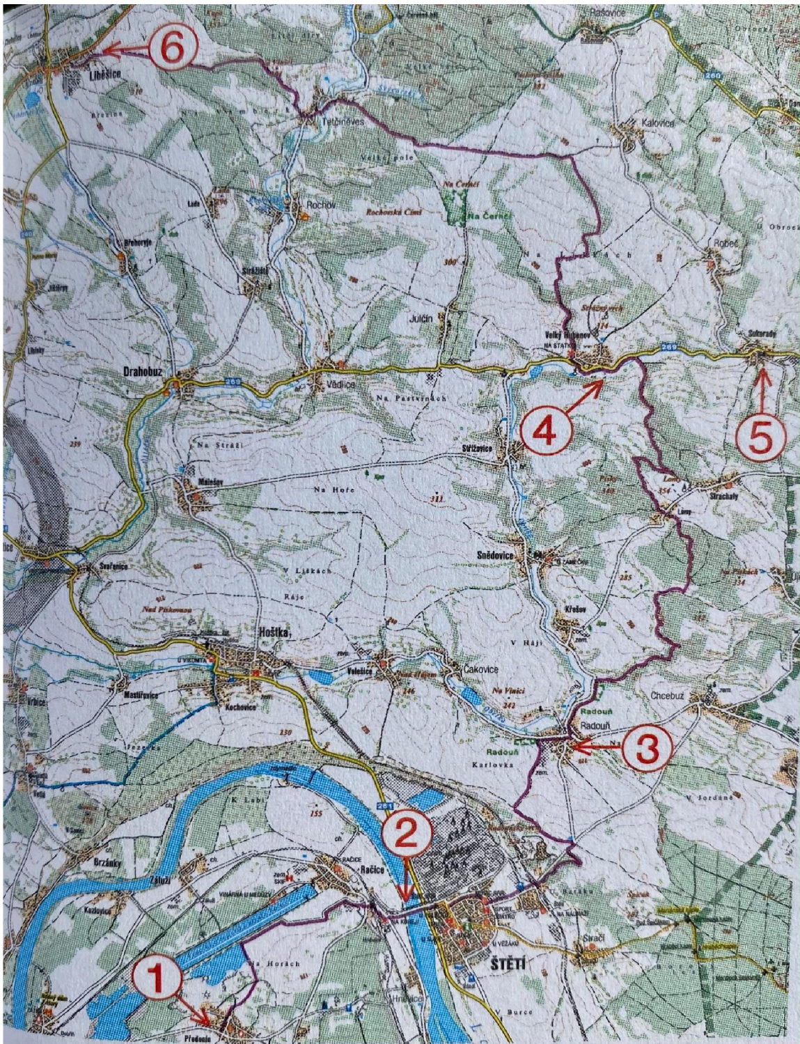
Obrázek 7 Stezka - Na pomezí tří krajů