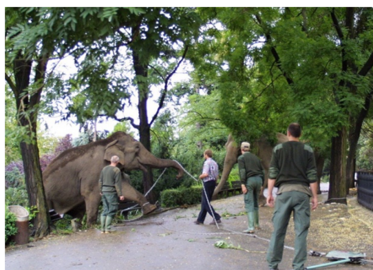
Obrázek č. 3, 4: Zoologická zahrada Praha sloní výběh a evakuace slonice