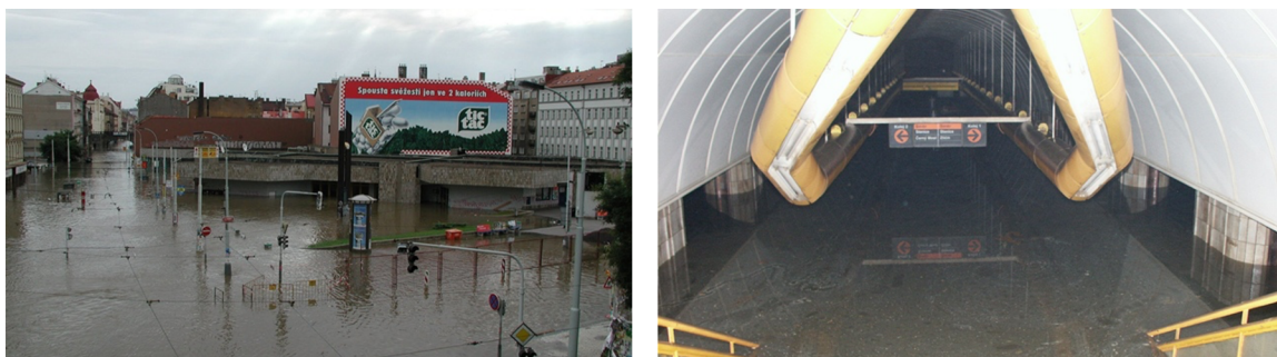
Obrázek č. 5, 6: Zatopená stanice metra B Florenc

V pražském metru došlo k zatopení celkem 17 stanic a celkem 20 kilometrů tunelu. Z toho tři stanice byly z trasy metra A (Malostranská, Staroměstská, Můstek), jedenáct stanic z trasy metra B (Anděl, Karlovo náměstí, Národní třída, Můstek, Náměstí republiky, Florenc, Křižíkova, Invalidovna, Palmovka, Českomoravská a Vysočanská) a tři stanice z trasy metra C (Nádraží Holešovice, Vltavská, Florenc). Mimo tyto zatopené stanice se voda dostala také do dalších stanic, ne však v takové míře. 43 Výše zmíněná zaplavená stanice metra Florenc viz obrázky 6 a 7, kde můžeme vidět stanici na povrchu země a přímo nástupní stanici metra na lince B.