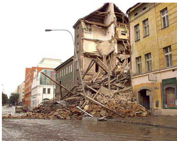
Obrázek č. 2: Zřícený dům v pražském Karlíně