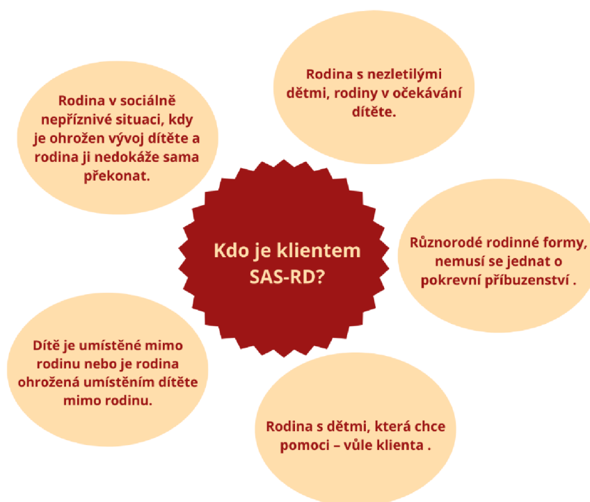
Obrázek 1: Klientela SAS-RD (Moravskoslezský kraj, 2022)

Kdo je klientelou SAS-RD můžeme vidět na následujícím obrázku: