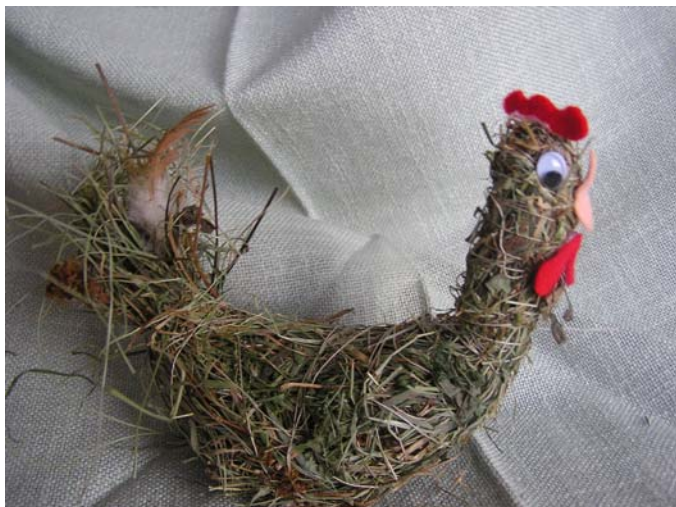
Obrázek č.5 Pletení z proutí, sena a jiných rostlinných materiálů