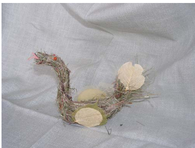
Obrázek č. 6 Velikonoční vazba