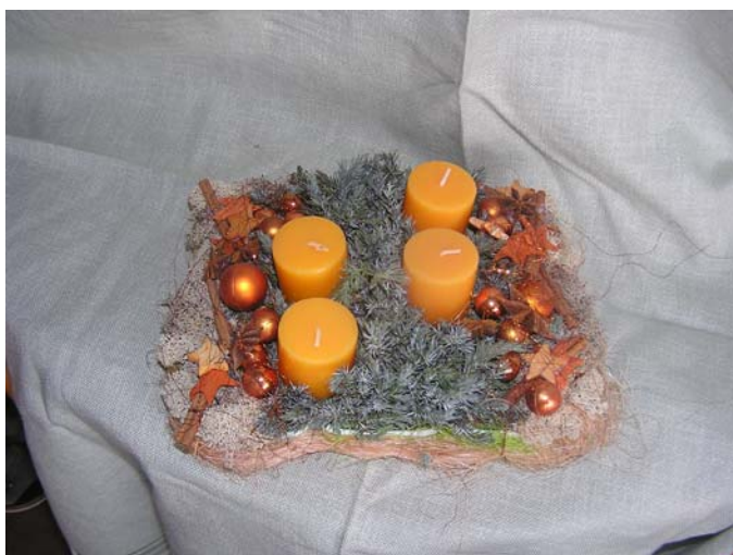
Obrázek č.3 Pletení z proutí, sena a jiných rostlinných materiálů