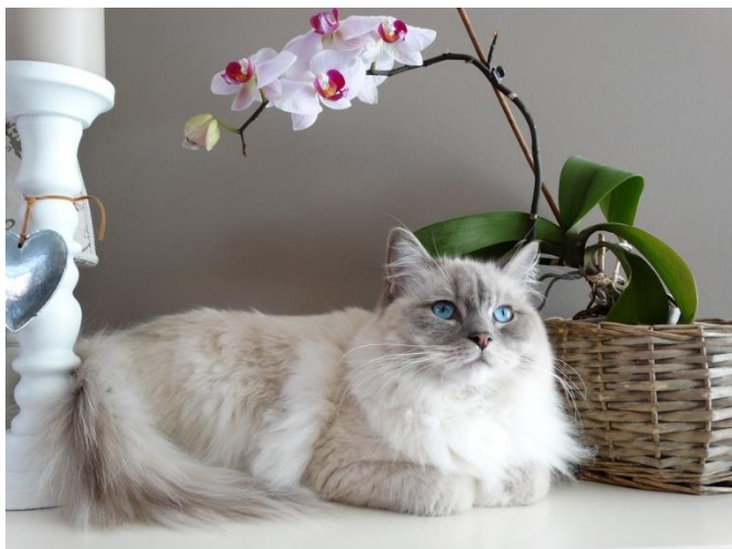
Obr.5 – Ragdoll

Řadí se k největším plemenům světa. Známe jsou díky jejich klidné povaze a oddanosti. Péče není náročná, pouze v době línání je nutné vyčesávání (Hypšová, 2007).