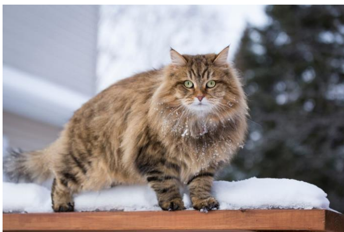
Obr. 6 – Sibiřská kočka

Také patří k velmi velkým plemenům koček. Péče o ně je podobná jako u plemene ragdoll. Povahou jsou velice přátelské a nejsou náročné (Hypšová, 2007).