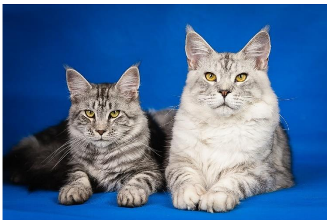
Obr.3 – Mainská mývalí kočka

Jedná se o původní americké plemeno. Jde o velmi mohutné kočky s polodlouhou srstí. Jsou inteligentní, podobně jako perské kočky, ale jsou temperamentnější. Nevýhodou může být jejich větší hmotnost, která bývá okolo 9-12 kg (Hypšová, 2007).