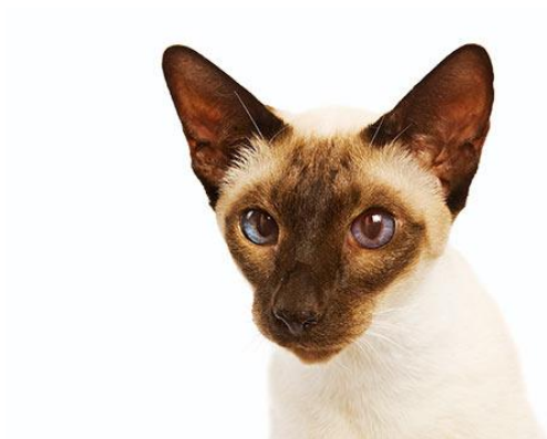
Obr. 2 – Siamská kočka

Siamské kočky lze zařadit k nejstarším plemenům na světě. Kočky javánské byly vyšlechtěny v 60. letech v Kalifornii a jedná se o plnobarevné dlouhosrsté siamské kočky. Společnými znaky těchto druhů je štíhlá tělesná konstituce, nenáročná péče o srst, nesmírná inteligence a oddanost k lidem. Nevýhodou mohou být jejich hlasitější projevy (Hypšová, 2007).