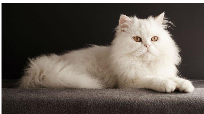
Obr.4 – Perská kočka

Řadí se k nejrozšířenějšímu chovanému šlechtěnému plemenu. Mají dlouhou a hustou srst. Jsou velmi přátelské k lidem, mohou působit až flegmaticky. Nevýhodou mohou být vyskytující se obtíže s dýcháním během horka v létě a línání jejich srsti (Hypšová, 2007).