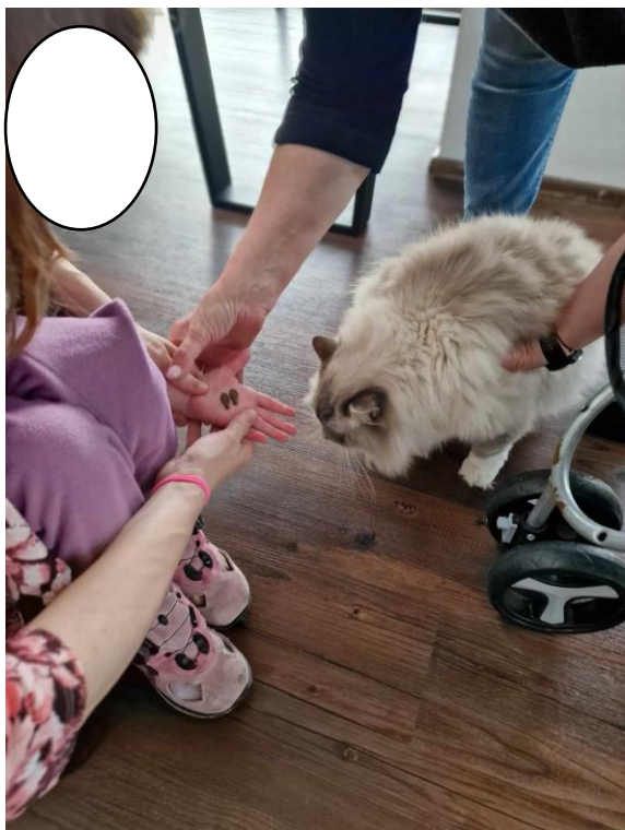
Obr. 7 – krmení kocoura

jsem poděkovala rodičům dívky a felinoterapeutce za spolupráci na samotném pozorování, ale rovněž také na již proběhlém rozhovoru a rozloučili jsme se.