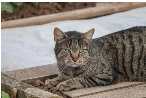
Obr.1. Kočka domácí

Nemají průkaz původu. Mohou být krátkosrsté, polodlouhosrsté, ale také dlouhosrsté. Výhodou tohoto plemene je nenáročnost. Povahově však bývají temperamentnější na rozdíl od koček, které jsou šlechtěné (Hypšová, 2007).