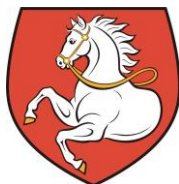
Obrázek 2 Znak města Pardubice