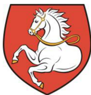
Obrázek 2 Znak města Pardubice