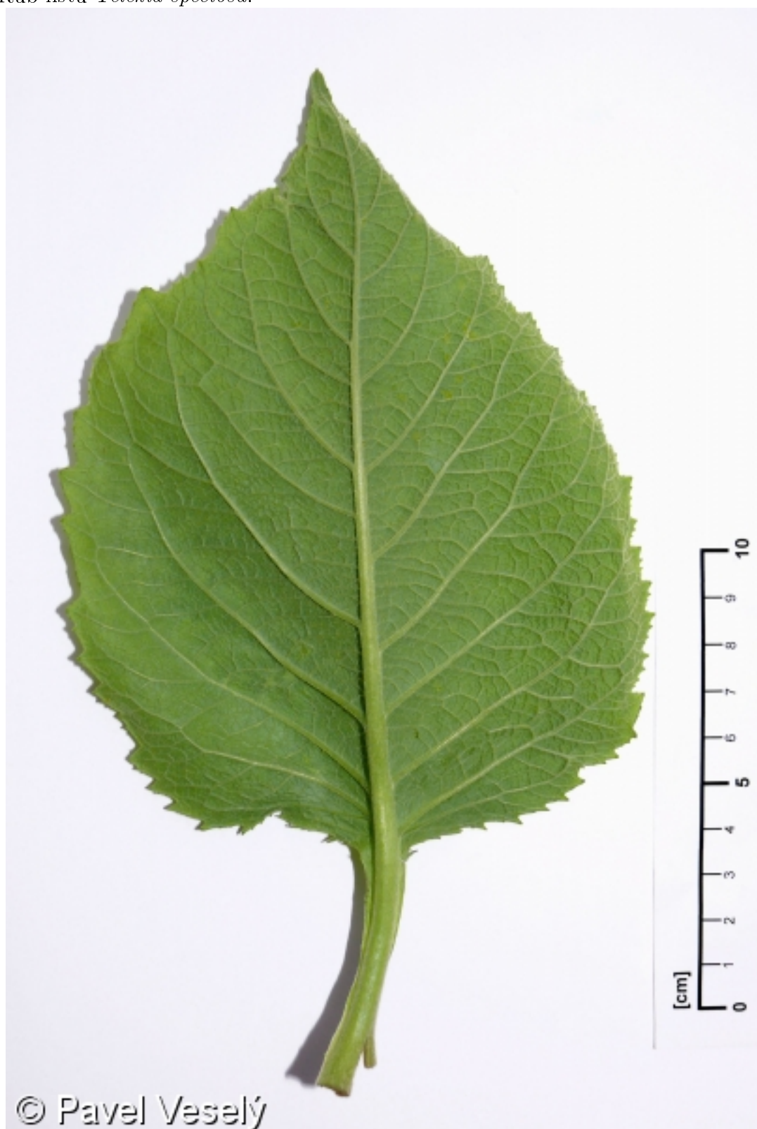
Příloha IV Rub listu Telekia speciosa .