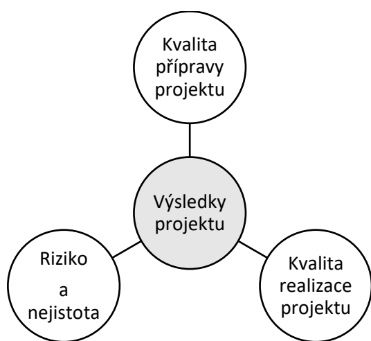
Obrázek 1: Faktory ovlivňující výsledky projektu

Riziko a s ním úzce spojená nejistota je součástí především aktivit v podnikatelské sféře jako je zavádění nových technologií do společnosti, výzkum a následný vývoj výrobků, změna ve struktuře podniku, vstup podnikatelského subjektu na nové trhy nebo významné investiční plány. Veškeré zmíněné aktivity jsou prováděny vždy s nejistotou a může se stát, že se skutečné výsledky budou odchylovat od těch plánovaných, ať už v menší či větší míře. Závěry podnikatelských aktivit jsou jednoznačně ovlivněny kvalitou přípravy podnikatelských projektů. Ty mají za cíl zmírnit negativní varianty, které mohou výrazně ovlivnit průběh plánů a jejich budoucí výsledky. Obrázek 1 popisuje faktory ovlivňující výsledky projektu. (Fotr a Hnilica, 2014)