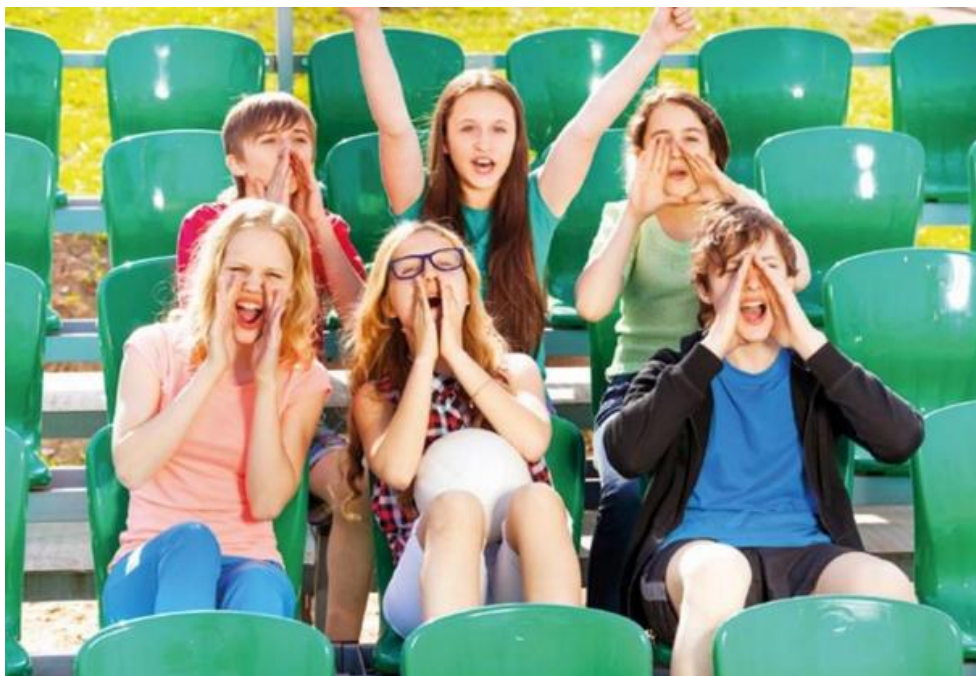
Obrázek č. 2 - Děti staršího školního věku