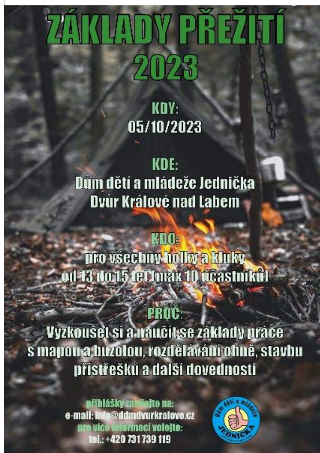
Obrázek č. 7 - Plakát Kurzu přežití