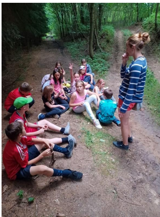
Obrázek č. 3 - Trávení volného času dětí v přírodě