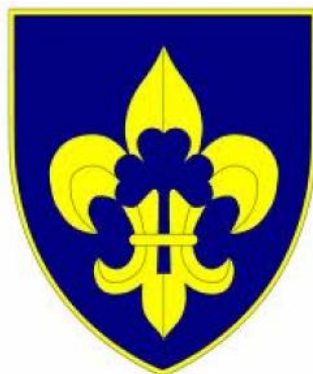
Obrázek č. 5 - Znak Skauta ABS

organizace. Vše vyústilo až k sestavení osnov sdružení, přičemž 21. listopadu 1999 došlo k ustavení Přípravného výboru. Stanovy nové skautské organizace pak byly schváleny ze strany Ministerstva vnitra České republiky konkrétně 6. ledna roku 2000, čímž v podstatě zároveň došlo ke vzniku této organizace (Skaut ABS, 2023a).