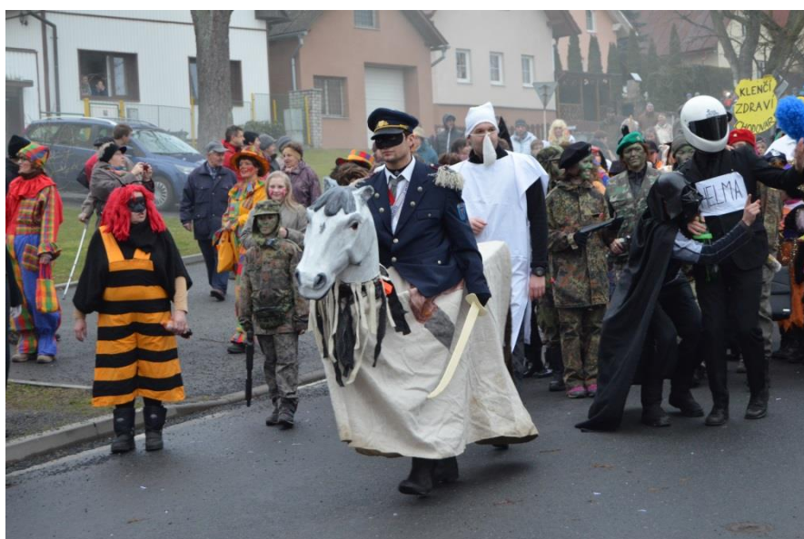
Obrázek 12: Tradiční masopustní maska jezdce na koni z Postřekova.