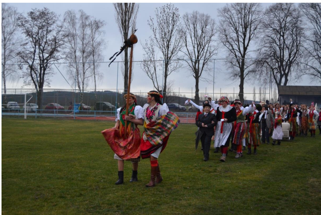
Obrázek 7: Droužky s houslemi a za nimi "chodská svatba".