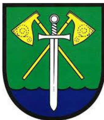
Obrázek 5: Postřekovský znak

Nejznámější vsí horního Chodska je bezpochyby Postřekov. Zároveň je největší a nejlidnatější vesnicí celé této oblasti. Má zhruba 1150 obyvatel. Její pojmenování je zřejmě odvozeno od „postřehování“, což znamenalo pozorování, které Chodové prováděli ze strážnic na Haltravě. Obec se nachází v podhůří Českého lesa a je známa svou neúrodnou půdou. Jelikož byl tímto omezen zdroj obživy, museli se zdejší obyvatelé živit jinak. Proto zde kdysi dávno vznikla papírna, která byla postupem času předělána na brusírnu skla. Také zde vzkvétalo krajkářství a manufakturní tkalcovství, které bylo podomní záležitostí. V těsné blízkosti obce leží vesnička Mlýnec, která se po druhé světové válce připojila k obci Postřekov. 102 Tyto dvě obce jsou odděleny pouze Mlýneckým potokem, do kterého za svého času byl vhazován Masopust. 103