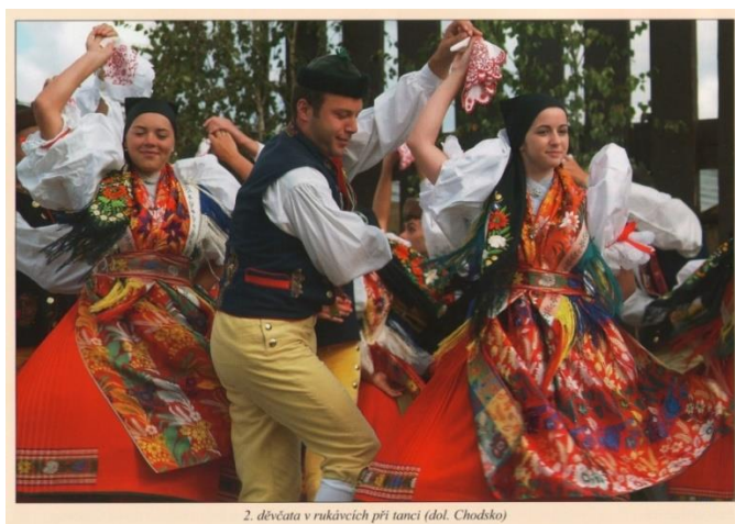
Obrázek 2: Mužský a ženský kroj dolního Chodska.