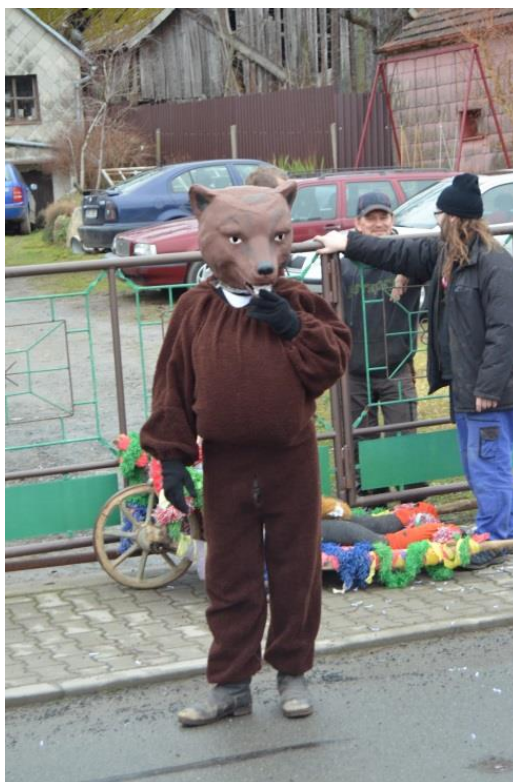
Obrázek 11: Tradiční masopustní maska medvěda z Postřekova.