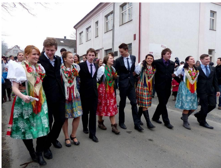
Obrázek 6: Kytičkový průvod.

Pořadí písní je řazeno také podle toho, kolem které části obce, či památky průvod prochází. Začíná se většinou písní „Hadamouc hospoda“. Když je průvod u kaple Svatého Jakuba, zpívá se „Postřekovský kostelíček“. Mezi poslední písně patří „V dolyjší hospodě muzika hraje“. Ta se zpívá, když je průvod téměř u hotelu. Před ním se poté utvoří jedno velké kolo, je – li mnoho párů, udělá se ještě jedno menší uvnitř kruhu. Uprostřed vždy stojí kapela a ostatní tancují kolem ní. Poté se všichni přesunou do hotelu, kde se zazpívá ještě jedna píseň a po ní předávají dívky kytičku svému chlapci. Přišpendlí mu ji na sako na levou stranu. Následně se přesouvají na večeři. Dříve bývalo zvykem, že chlapci chodili na večeři k dívce, od které dostali kytičku. Jelikož poslední dobou se kytičkového průvodu účastní i přespolní, večeři se vždy u toho z páru, kdo je místní Jsou – li z Postřekova oba, záleží na jejich domluvě. Po večeři se vrací všichni zpět do hotelu, kde se veselí a pijí do noci. K tance jim hraje dechová kapela Vrchovanka. 112