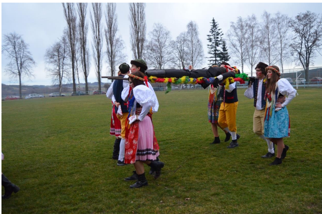
Obrázek 9: Legrůti s masopustem na nosítkách.

Za kapelou jdou hlavní aktéři průvodu. Jedná se legrůty, kteří nesou na ramenou, na pohřebních márách figurínu Masopusta k popravě. 121 Je to určitá pocta, která se chlapcům nabízí jen jednou za život. Dříve bývali legrůty ti chlapci, kteří na zimu rukovali na vojnu. Dnes již není povinná vojenská služba, přesto se tento zvyk dodržuje a legrůti jsou každý rok místní chlapci, kteří dovrší věku osmnácti let. Na sobě mají mužský kroj a na hlavách čepici vydrovku. Tito chlapci jsou později probírání v masopustní řeči při závěrečném obřadu.