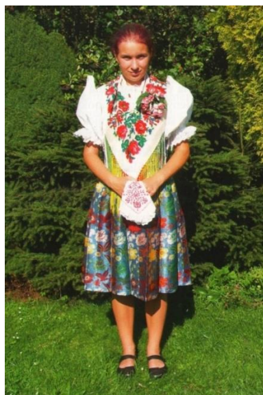
Obrázek 3: Ženský kroj z horního Chodska.

Do ruky patří vyšívaný šáteček, stejně jako na dolním Chodsku. A v pase se váže široká barevná stuha. 57