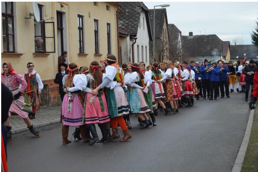
Obrázek 8: Družičky s kapelou Vrchovankou v pozadí.

Hudební doprovod obstarává v posledních letech kapela Vrchovanka, která je v těsném závěsu za družičkami.