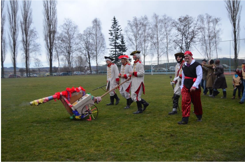
Obrázek 13: Tradiční masopustní masky vojáků s dělem.

Celý průvod uzavírá šlechta. Někdo ji nazývá jako kníže s kněžnou, někdo jako baron s baronkou. Jedou vždy na konci průvodu na káře, která je v současné době tažena čtyřkolkou. V jedné ruce mívají skleničku s alkoholem a tou druhou kynou přihlížejícím.