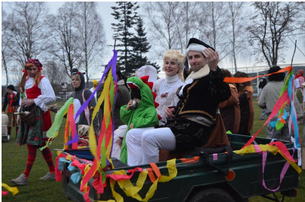
Obrázek 14: Představitelé šlechty, kteří uzavírají celý průvod.

Celý průvod uzavírá šlechta. Někdo ji nazývá jako kníže s kněžnou, někdo jako baron s baronkou. Jedou vždy na konci průvodu na káře, která je v současné době tažena čtyřkolkou. V jedné ruce mívají skleničku s alkoholem a tou druhou kynou přihlížejícím.