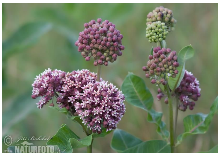
Obrázek 5 Klejicha hedvábná

Klejicha pochází z teplých oblastí Severní Ameriky, odkud byla intrudována dále do Evropských zemí pro svůj ojediněle atraktivní vzhled. Její druhové jméno syriaca vytvořil švédským přírodovědcem C. Linné po stanovení chybné domněnky, že klejicha svým původem pochází ze Sýrie. Na územní České republiky je výskyt možný datovat již v 18. století, kdy klejicha byla pěstována za účelem okrasné rostliny a byla vysazována kupříkladu v zámeckém parku v Lánech. V současné době se vyskytuje v teplejších oblastech, zejména tedy v Polabí a na Moravě (Pyšek et al. 2012).