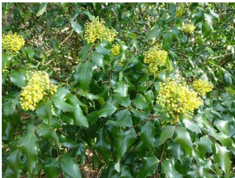
Obrázek 10 Mahónie cespíolistá

Dřevo mahónie se využívá k barvení vlny a v minulosti byla využívána k dobarvování vín. Mimo svůj okrasný aspekt je mimo jiné mahónie pěstovaná pro svou hustotu jako prvek živého plotu. V Severní Americe je rostlina pro svůj antibakteriální a antiseptický charakter využívána v léčitelství pro léčbu atopické dermatitidy a suchých kožních vyrážek, avšak předávkování způsobuje zvracení a křeče dýchacích cest (Ross. 2006).