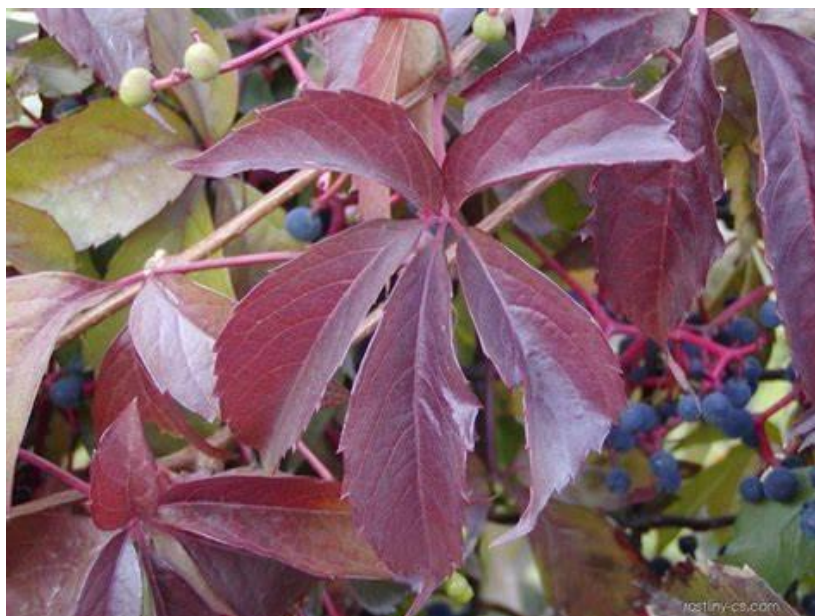
Obrázek 7 Loubinec pětilistý

Dříve nebyl v České republice odlišován od loubince pětilistého nebo byl odlišován chybně. Do Evropy byl tento druh zavlečen před rokem 1800. Je pěstován v zahradách a parcích jako okrasná liliána z důvodu svého atraktivního vzhledu a pro svou plazivou schopností po površích, který je využíván jako krytí zdí či jako součást živých plotů (Slavík, 1997).