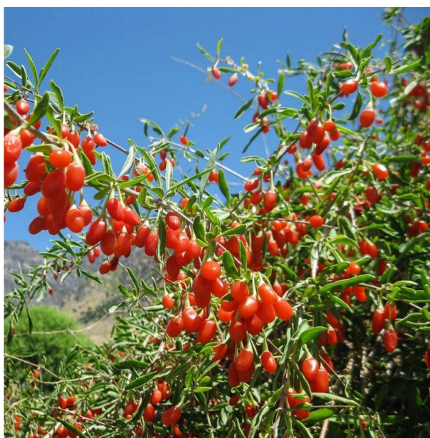
Obrázek 4 Kustovnice čínská

Rostliny z rodu lycium zahrnuje více jak 70 druhů, které se vyskytují v subtropích napříč celým světem. V euroasijské oblasti se vyskytují celkem 3 druhy, a to kustovnice čínská, evropská a cizí, které jsou již dlouhou dobu pěstovány jako kulturní rostlina (Wang et al. 2019).