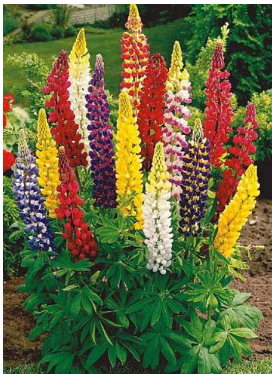
Obrázek 6 Lupina mnoholistá ( )

Lupina mnoholistá pochází z oblasti Severní Ameriky, avšak postupně zdomácněla napříč Jižní Amerikou a Evropou. První zmínka výskytu lupiny na území České republiky je datováno v 19. století. Lupina, jakožto světlomilná rostlina, jež se hojně vyskytuje v lehkých půdách, je běžně pěstována v zahradách pro své vyšlechtěné barevné kultivary, avšak její pěstované zahradní hybridy jsou vysoce toxické (kvetenacr.cz).