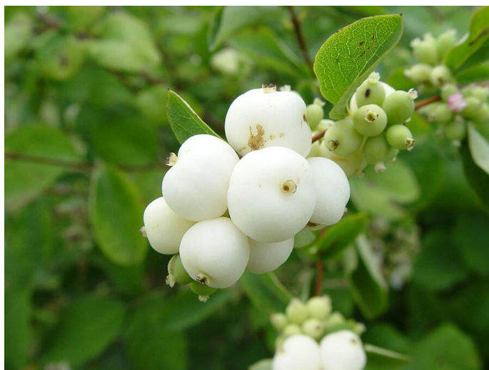
Obrázek 9 Pámelník bílý

Pámelník bílý pochází ze Severní Ameriky. Je rozšířen na většině území od Aljašky až po Kalifornii, Nové Mexiko a Severní Karolínu. Roste především v nižších a středních polohách. Pámelník bílý je vysazován v parcích, sadech, sídlištích a kolem cest, odtud zplaňuje a šíří se do okolí obcí, podél komunikací (Hassler, 2016).