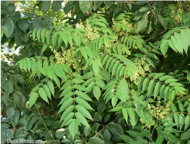
Obrázek 2 Pajasan žláznatý