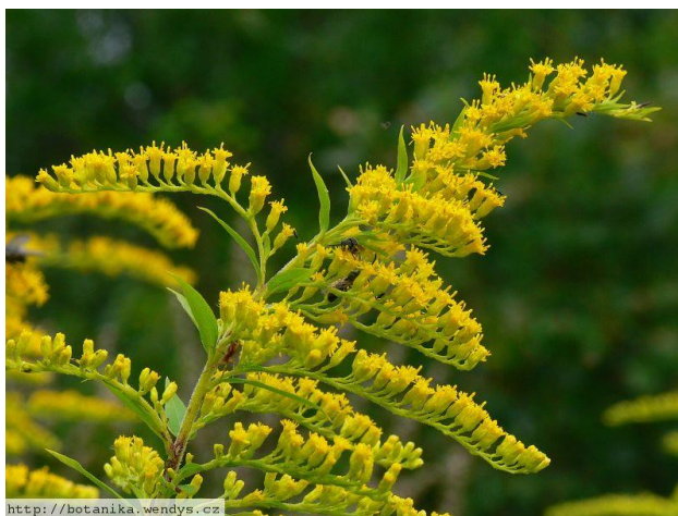
Obrázek 3 Zlatobýl kanadský

Rostliny rodu Solidago pochází ze Severní Ameriky, kdy původní pás výskytu se táhne od Aljašky po Mexiko. První zmínka o zavlečení zlatobýlu do Evropy pochází z roku 1648 z Francie. Na území České republiky je možné rostliny druhu solidago možné dohledat od roku 1838. Pás výskytu se rozjímá od severních a severovýchodních až po Slezsko. Je možné ho nalézt skoro po celém území republiky mimo horské oblasti. Ve srovnání s již výše uvedenými silně invazivní druhy, rostliny tohoto druhu jsou poměrně nenáročné na živiny a vysoce odolné sušším podmínkám. Osidlují zejména stanoviště ruderalní, ruderalně ovlivněných nebo nitrofilních. Tím, že se jedná o helyofitní rostlinný druh, jsou zlatobýly pevně vázané na intenzitu slunečního záření (Mlíkovský, Stýblo 2006).