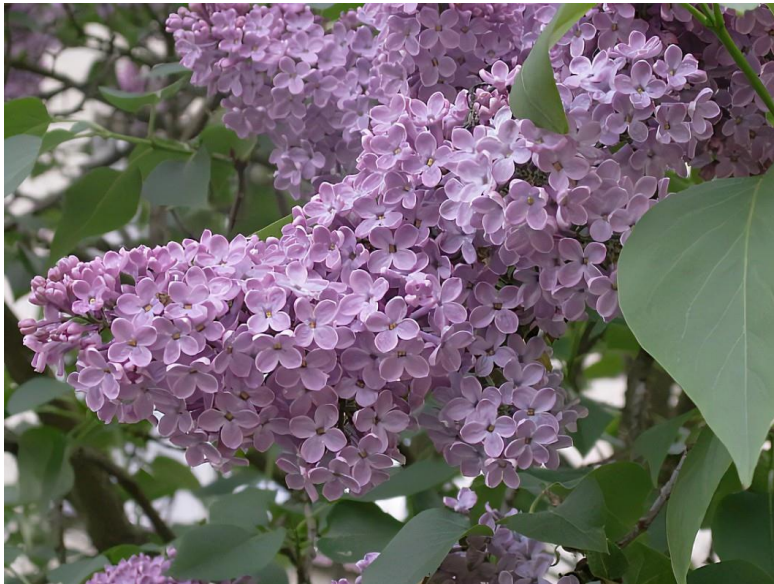
Obrázek 8 Šeřík obecný