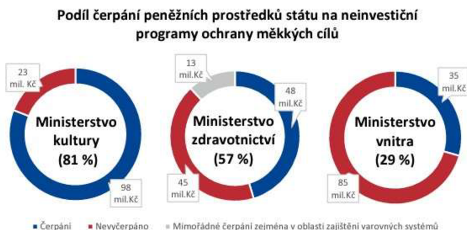
Obrázek č. 1 – Čerpání financí na programy ochrany měkkých cílů

Zdroj: NEJVYŠŠÍ KONTROLNÍ ÚŘAD. Kontrolní závěr z kontrolní akce č. 21/21: Peněžní prostředky státu vynakládané na systém ochrany měkkých cílů [PDF]. 2022.