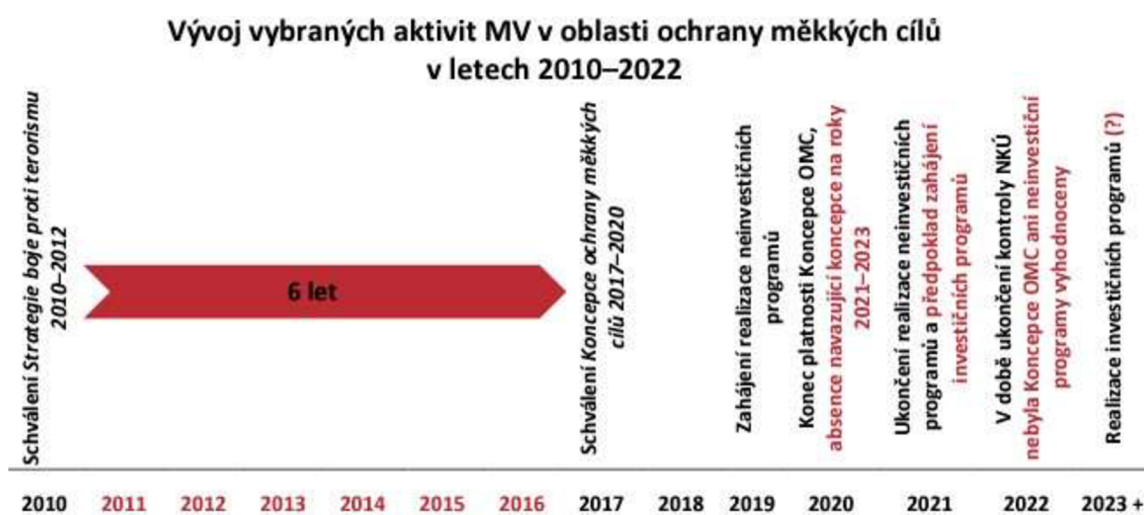
Obrázek č. 2 – Vývoj aktivit Ministerstva vnitra v oblasti ochrany měkkých cílů