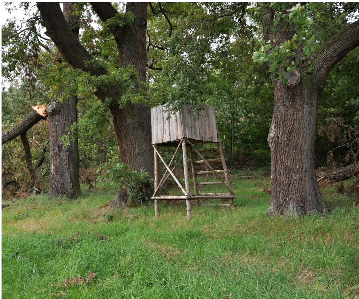
Obr. č. 9: Kazatelna pro lov nátláčkou.