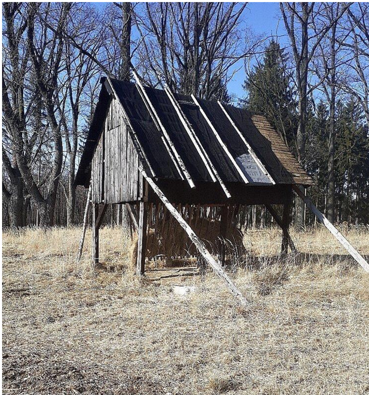
Obr. č. 3: Krmelec s horním zásobníkem, Obora Slavice.