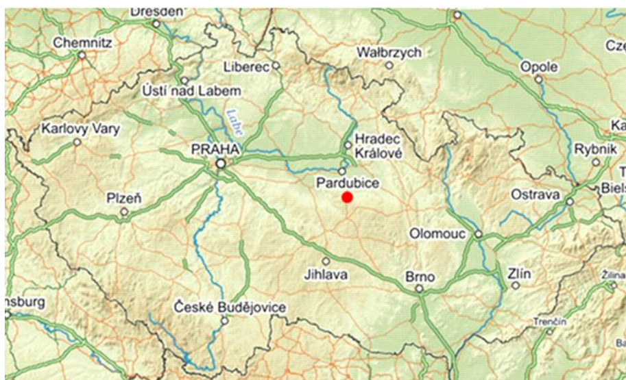
Obr. č. 12: Poloha obory Slavice, Zdroj: www. mapy.cz

Kontroloval jsem jejich technický stav, umístění a vzhled v krajině. Dále byla zjištěna jejich poloha, která byla zaznamenána do mapy obory. Průzkum v oboře byl možný kdykoli po domluvě s odborníkem. Veškeré informace týkající se obory mi byly poskytovány formou konzultace s odborníkem. Terénní průzkumy byly prováděny v jarních měsících. Dále jsem provedl fotodokumentaci zařízení.