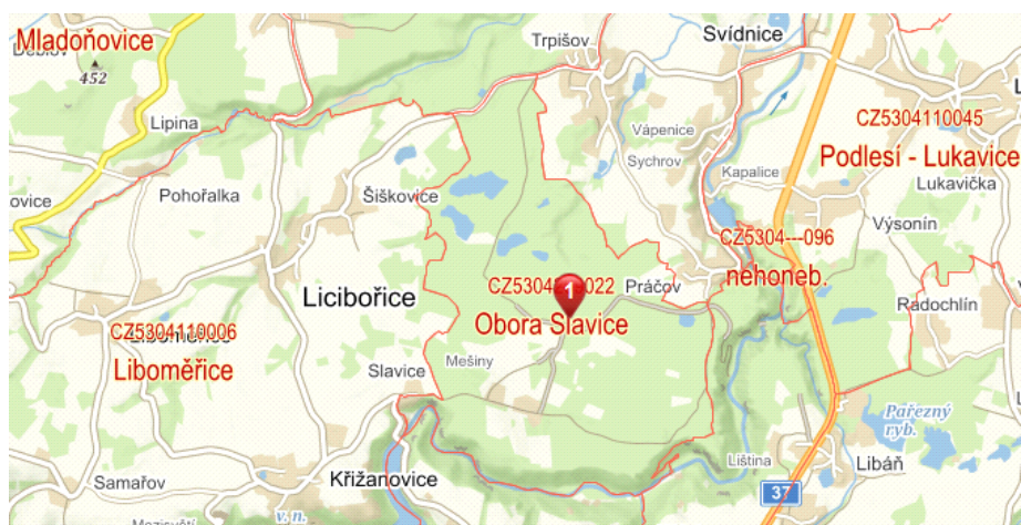
Obr. č. 13: Mapa s vyznačením polohy obory Slavice

Oborní plot je dřevěný a jeho délka je 11,5 km. Plot je vyroben z dřevěných podélných latí a betonových kolíků. Plot se kontroluje jednou týdně za normálního počasí, pokud je vítr, tak probíhá kontrola ihned a v případě déle trvajících větrného počasí i častěji. Oborní brány jsou kovové, pouze jedna je dřevěná. Celkový počet je sedm bran. Brány se nachází směr Křižanovice, Vyhlídka, Krkanka, Práčov, Trpišov a Myšiny. Poslední jmenovaná je jediná dřevěná. Záskoky jsou tři a záběhy v oboře se nenacházejí.