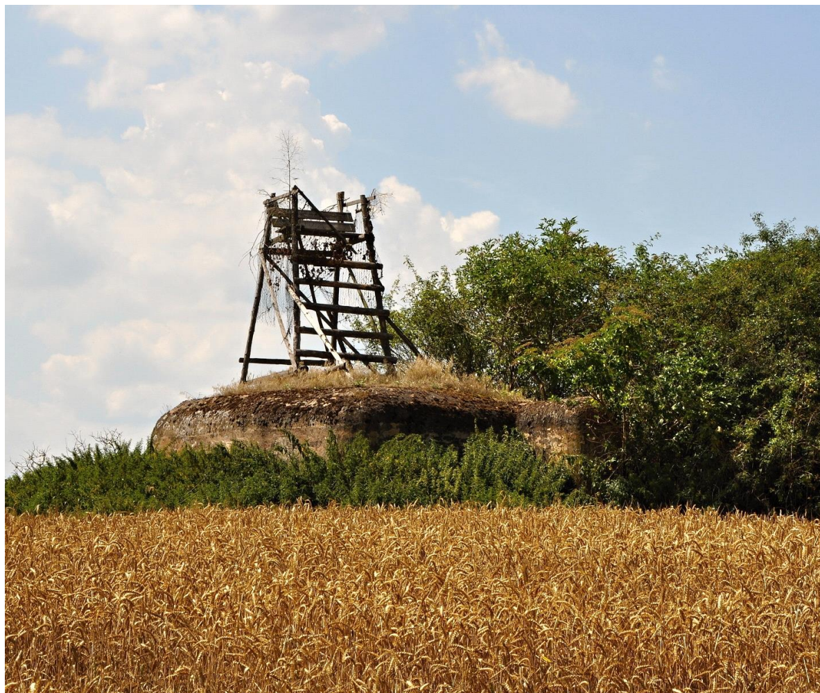
Obr. č. 5: Žebříkový posed s integrovaným podstavcem, postavený na řopíku.