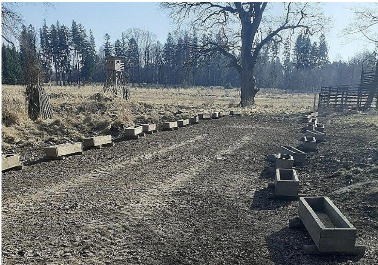
Obr. č. 4: Korýtka, v pozadí vlevo kazatelna, v pozadí vpravo odchytné zařízení. Obora Slavice.