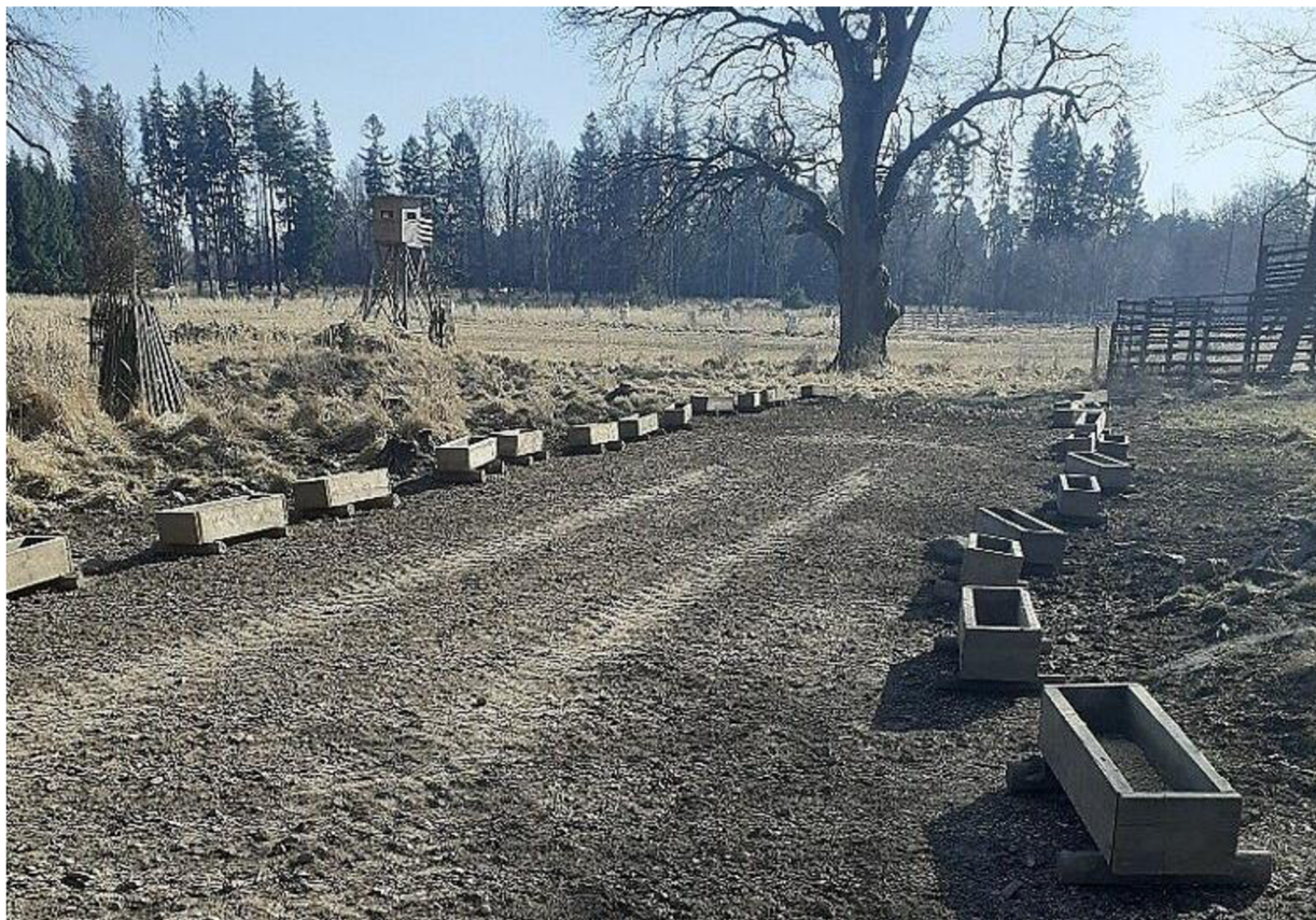
Obr. č. 4: Korýtky, v pozadí vlevo kazatelna, v pozadí vpravo odchytové zařízení. Obora Slavice.