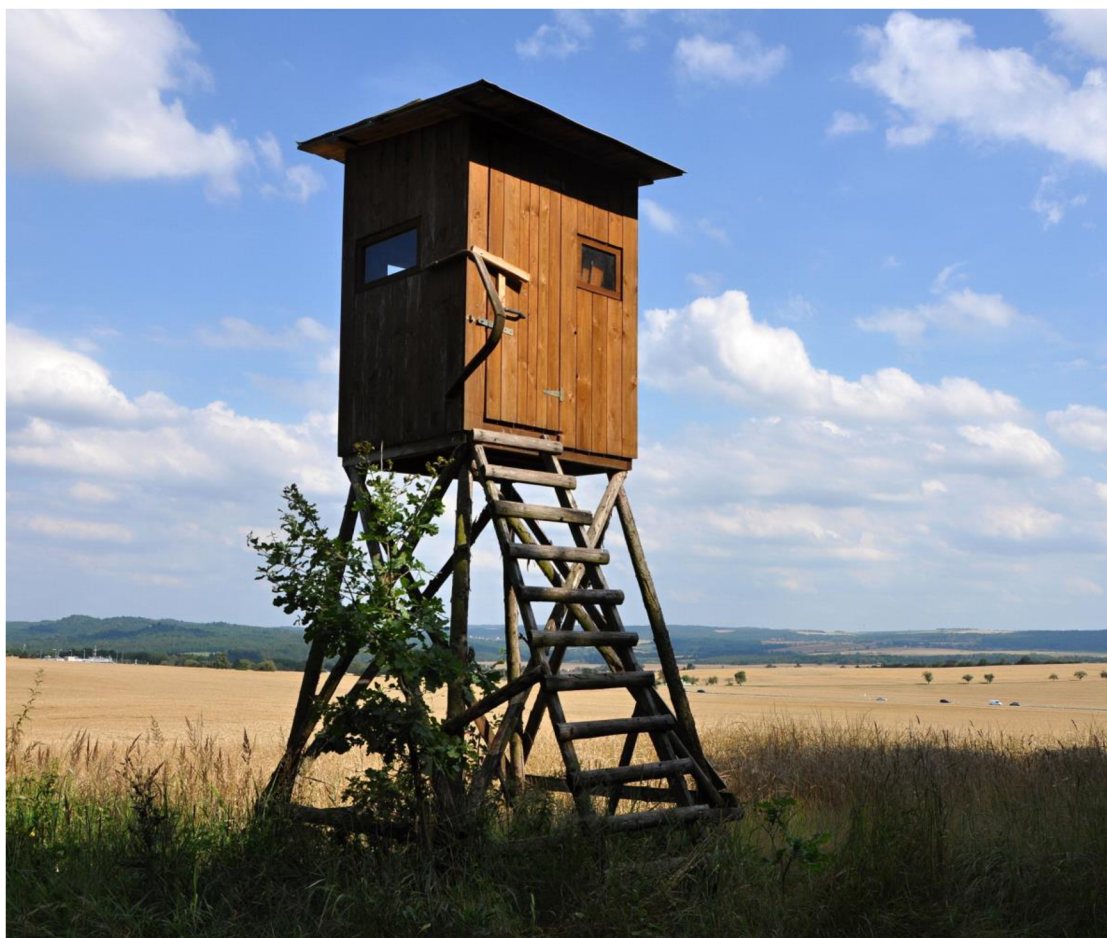
Obr. č. 11: Uzavřená kazatelna

Autor také zmiňuje pojízdné pozorovatelné, které se dají rychle přemístit a dnes patří neodmyslitelně do honitby. Umožňuje zařízení přemístit do míst, kde zvěř působí škodu nebo i na říjiště. Ke stavbě pojízdné pozorovatelné se doporučuje použít jakýkoliv přívěsný vozík, který má v pořádku osu.