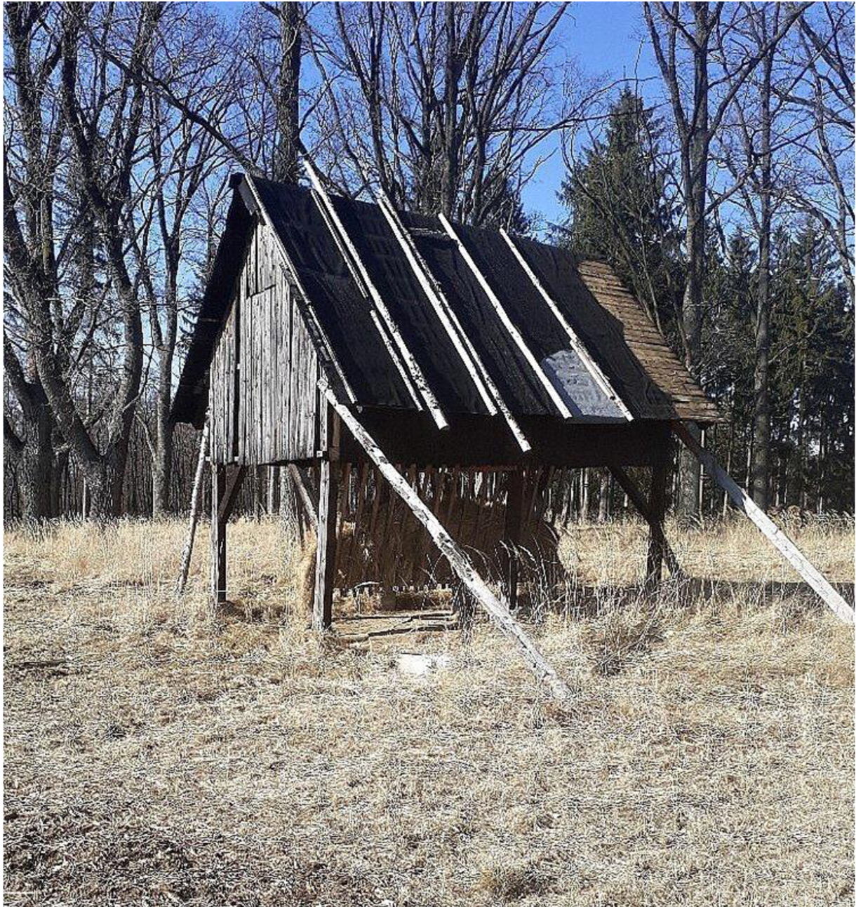
Obr. č. 3: Krmelec s horním zásobníkem, Obora Slavice.