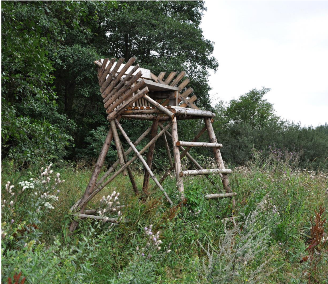
Obr. č. 8: Žebříkový posed s podlážkou

Podle Schmida (2006) se jedná o nejpoužívanější typ žebříkového posedu. Podlážka sice skýtá větší pohodlí, ale zvyšuje celkovou hmotnost posedu.