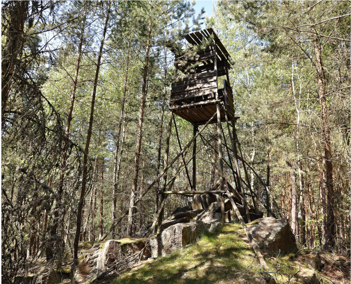
Obr. č. 10: Kazatelna s průběžnými stojinami, delší dobu nepoužívaná. Původně byla postavená na vyvýšeném místě, ale okolí výsadba borovice již kazatelnu přerostla.

U tohoto typu posedu je potřeba věnovat velkou pozornost pevnému spojení se zemí. Podle Schmida (2006) to platí především pro svislé stojiny, ale i pro šikmé, dole od sebe roztažené stojiny, protože jejich rozepření nemůže být tak široké jako u dvoukřídlého posedu s podstavcem. Dobrého spojení se zemí lze dosáhnout i pomocí upevnění na ocelové úhelníky, zapuštěné do dostatečně těžkých betonových základů. Použít se dají i šroubovací kotvy, které nelze použít na příliš kamenitém podloží nebo půdě silně prorostlé kořeny.