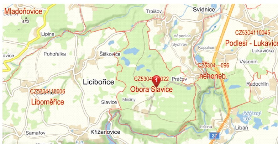
Obr. č. 13: Mapa s vyznačením polohy obory Slavice

Oborní plot je dřevěný a jeho délka je 11,5 km. Plot je vyroben z dřevěných podélných latí a betonových kolíků. Plot se kontroluje jednou týdně za normálního počasí, pokud je vítr, tak probíhá kontrola ihned a v případě déle trvajícího větrného počasí i častěji. Oborní brány jsou kovové, pouze jedna je dřevěná. Celkový počet je sedm bran. Brány se nachází směr Křižanovice, Vyhlídka, Krkanka, Práčov, Trpišov a Myšiny. Poslední jmenovaná je jediná dřevěná. Záskoky jsou tři a záběhy v oboře se nenacházejí.