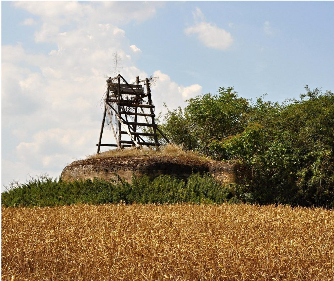
Obr. č. 5: Žebříkový posed s integrovaným podstavcem, postavený na řopíku.