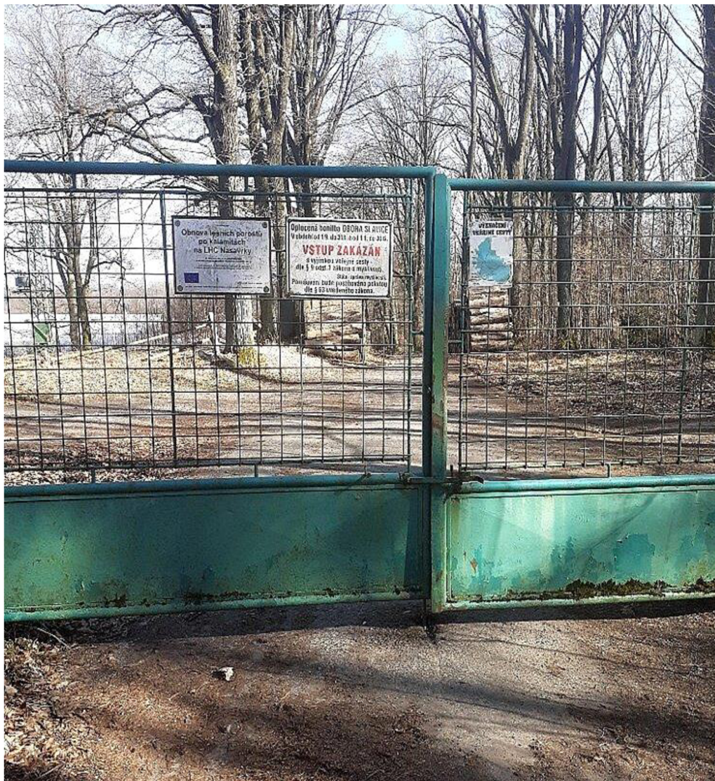
Obr. č. 2: Oborní brána, Obora Slavice.