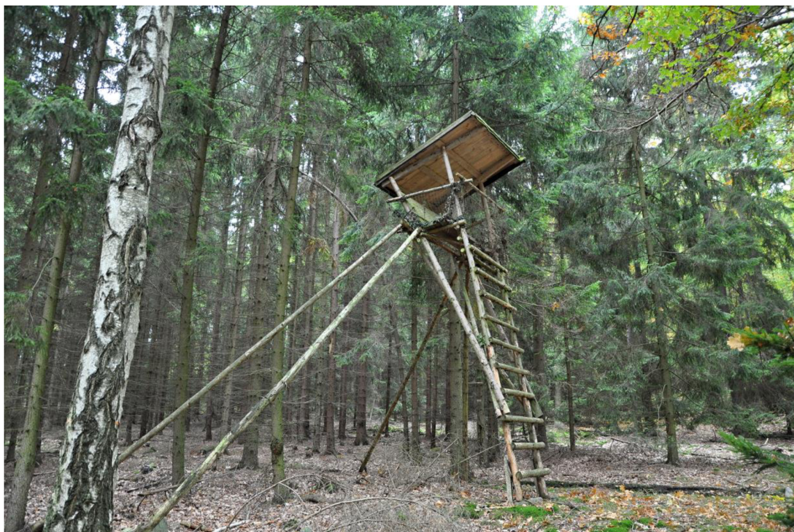
Obr. č. 7: Žebříkový posed s podpěrami sedacího nástavce doplněný o stříšku.

RAHN (2008) tento posed označuje jako trojnohý žebřík. Domnívá se, že tento typ je vhodný používat před postavením pevného posedu nebo uzavřené kazatelny, neboť umožní prozkoumat zamýšlenou část honitby. Její zhotovení a převoz považuje za snadný, neboť k tomu postačí přívěsný vozík za osobní auto. Považuje jej také za poměrně pohodlný a uvádí, že za opěradlem zad je dost místa pro uložení batohu. Pro jeho zhotovení doporučuje dubové dřevo, na příčky žebříku douglaskové dřevo a na zbytek borové.