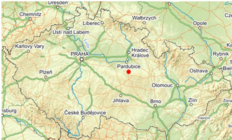
Obr. č. 12: Poloha obory Slávice, Zdroj: www. mapy.cz

Kontroloval jsem jejich technický stav, umístění a vzhled v krajině. Dále byla zjištěna jejich poloha, která byla zaznamenána do mapy obory. Průzkum v oboře byl možný kdykoli po domluvě s odborníkem. Veškeré informace týkající se obory mi byly poskytovány formou konzultace s odborníkem. Terénní průzkumy byly prováděny v jarních měsících. Dále jsem provedl fotodokumentaci zařízení.