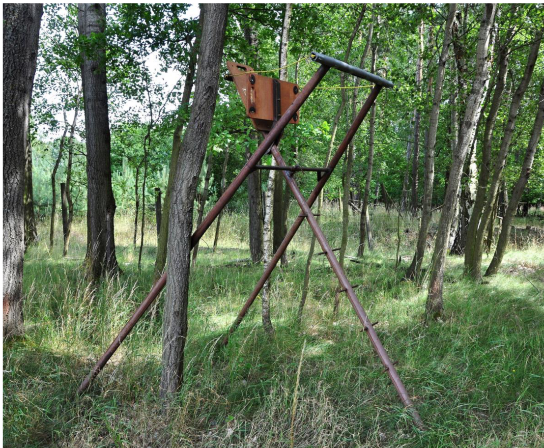
Obr. č. 6: Žebříkový posed skládací, přenosný.

rozebrání. RAHN (2008) se domnívá, že skládací žebřík může přenést jedna osoba a na kratší vzdálenosti jej lze i táhnout. Ke zhotovení doporučuje borové dřevo, které nakonec napustíme konzervačním prostředkem, jako ochranu před nepřízní počasí. Autor uvádí jako přednost tohoto posedu to, že jej lze umístit i do úplně divokých částí nebo k polím, kde zvěř právě škodí.