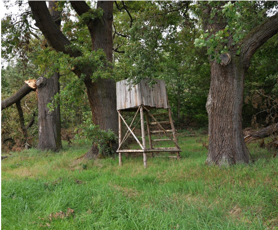
Obr. č. 9: Kazatelna pro lov nátláčkou.