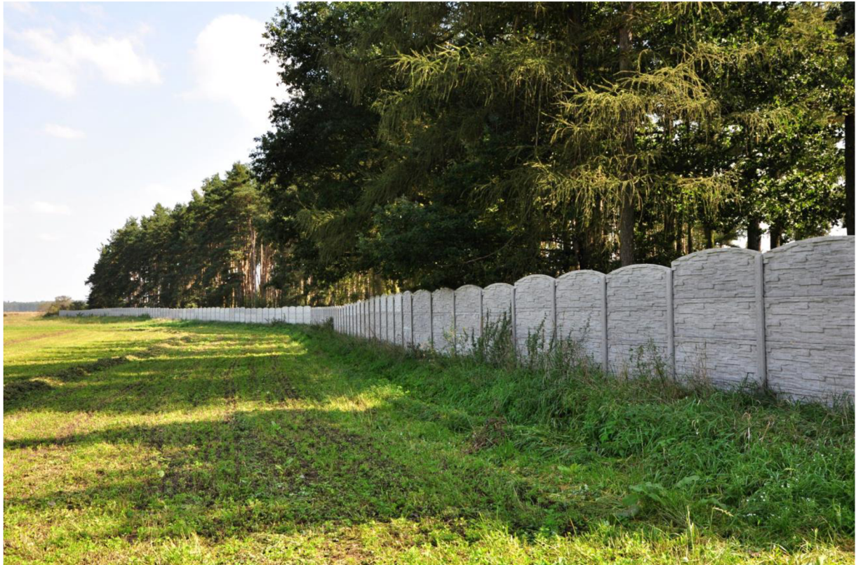
Obr. č. 1: Oborní plot z betonových prefabrikátů, Obora Svárava.