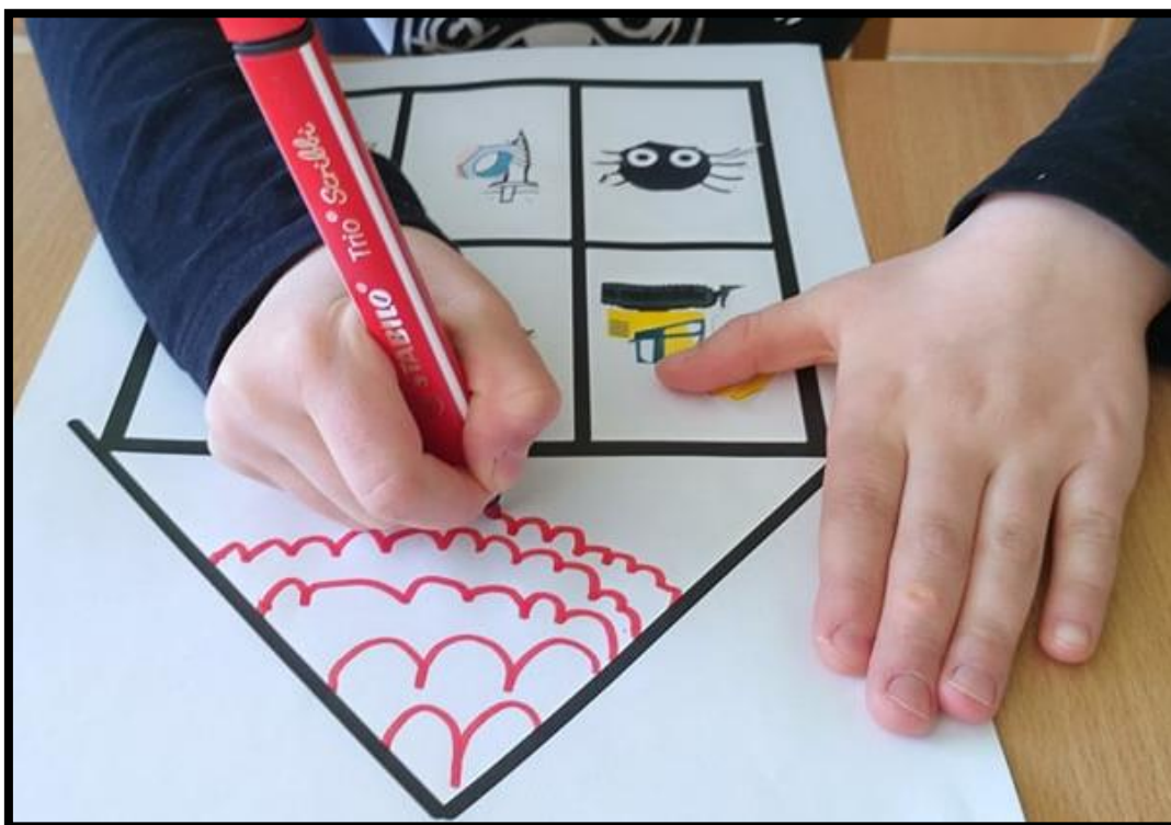
Fotografie č.4 – Čendova paměť (pravolevá orientace, rozšiřování slovní zásoby, grafické znaky)