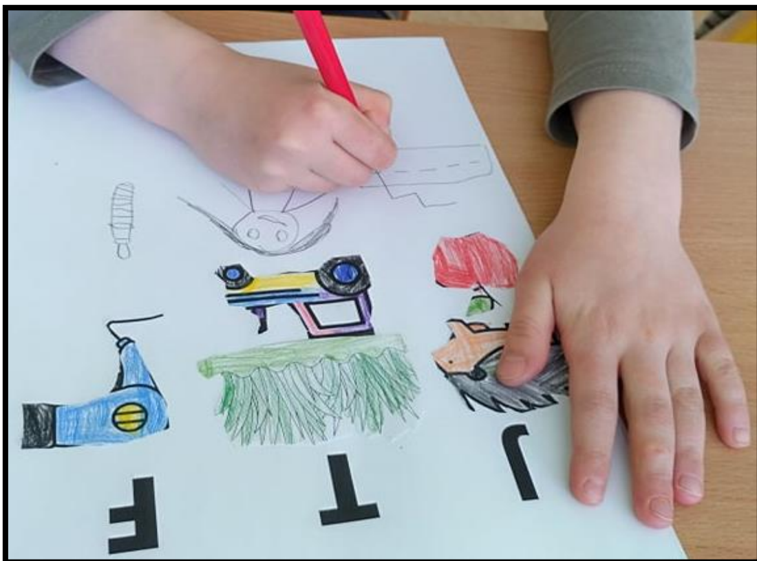
Fotografie č.6 – sluchová percepce, první hláska ve slově