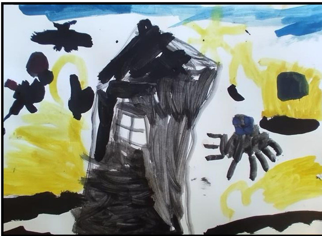
Fotografie č.3 – malba na základě prožitku