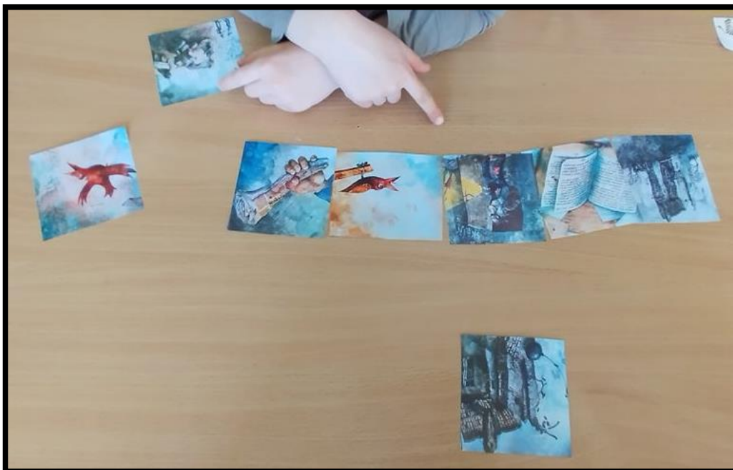
Fotografie č.2 – Matematická posloupnost, převyprávění příběhu