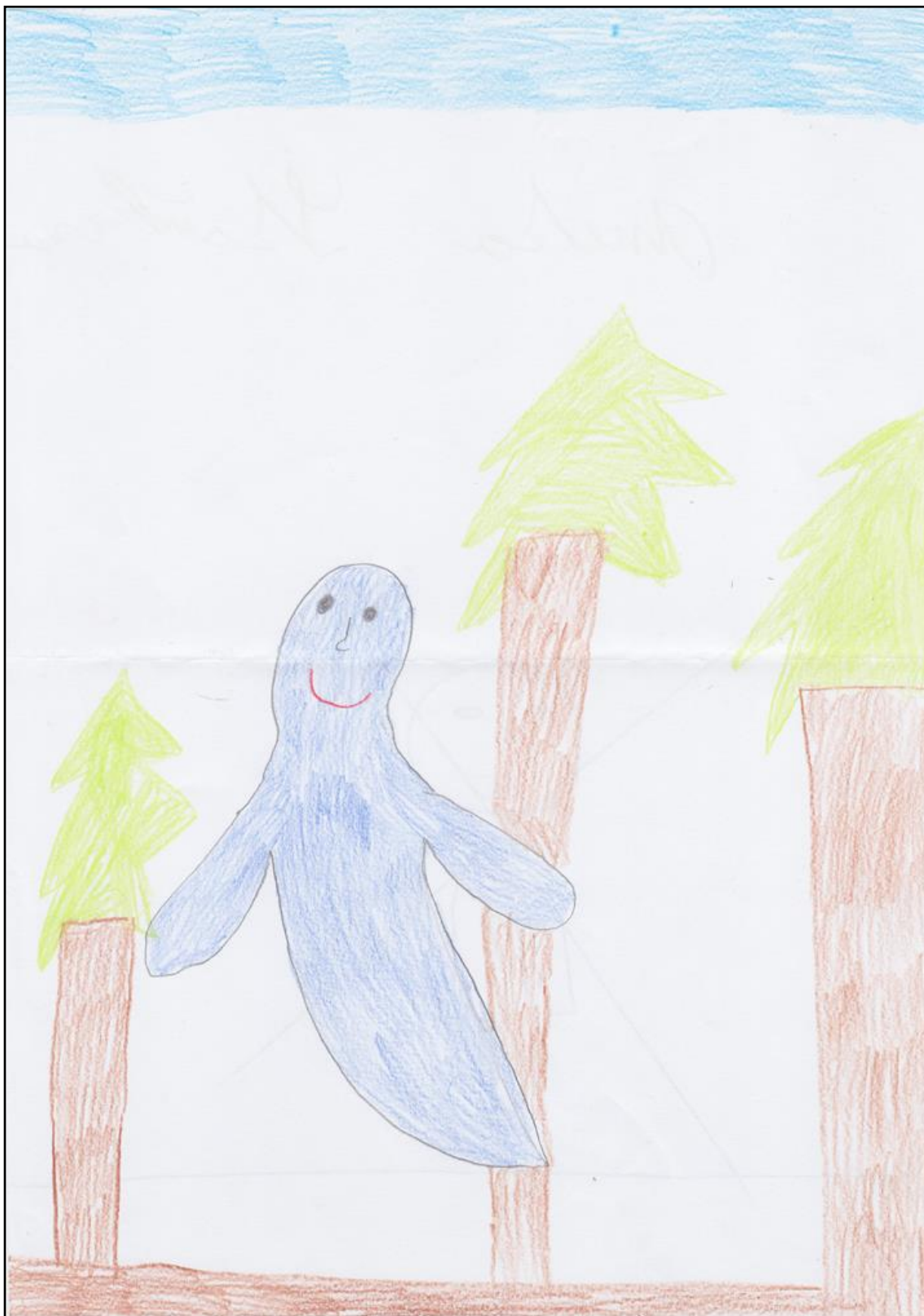
Obrázek 1: Duše letí do nebe (práce žáka 3. třídy)