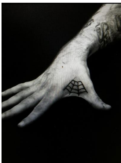
Obr. 9 Pavučina