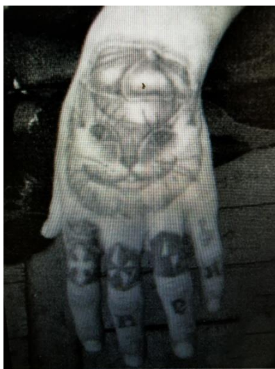
Obr. 8 Hlava kocoura/kočky