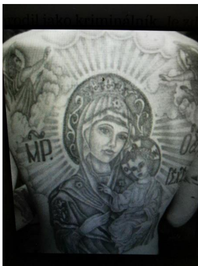
Obr. 4 Madona s dítětem, zdroj: https://www.investigace.cz/tetovani-a-rusky-organizovany-zlocin-obcanka-vyryta-do-kuze/