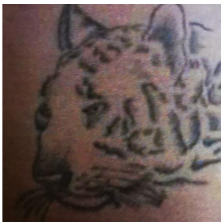
Obr. 6 Hlava tygra, zdroj: B. Vegrichová, Symbolika kriminálního tetování