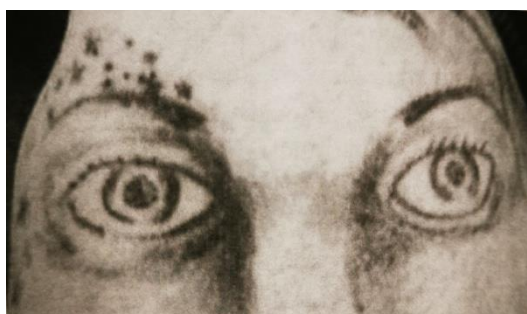
Obr. 5 Oči, zdroj: B. Vegrichtová, Symbolika kriminálního tetování