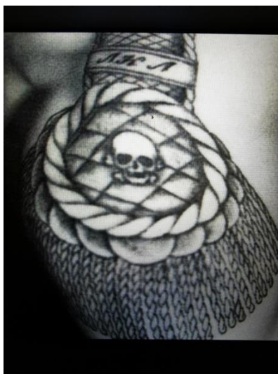
Obr. 2 Epolety, nárameníky, zdroj: https://www.investigace.cz/tetovani-a-rusky-organizovany-zlocin-obcanka-vyryta-do-kuze/