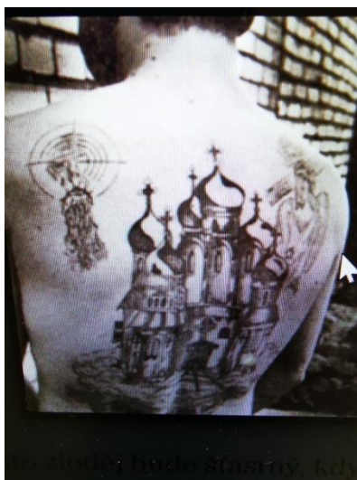
Obr. 3 Sakrální budovy