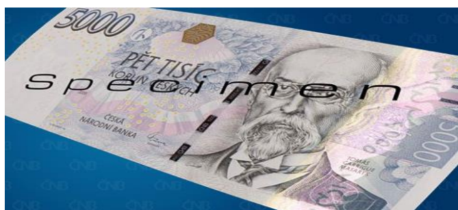
Obrázek 13 Ochranný prvek: Iridiscentní pruh

Zdroj: ČESKÁ NÁRODNÍ BANKA: České bankovky – animace (16).