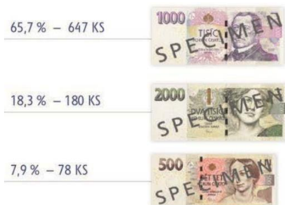
Obrázek 17 Zadržené padělky podle nominální hodnoty 2018