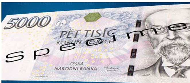
Obrázek 12 Ochranný prvek: proměnlivá barva

Zdroj: ČESKÁ NÁRODNÍ BANKA: České bankovky – animace (16).