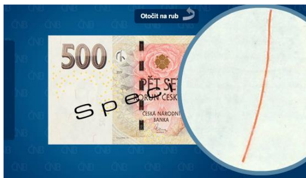
Obrázek 9 Ochranný prvek: barevná vlákna