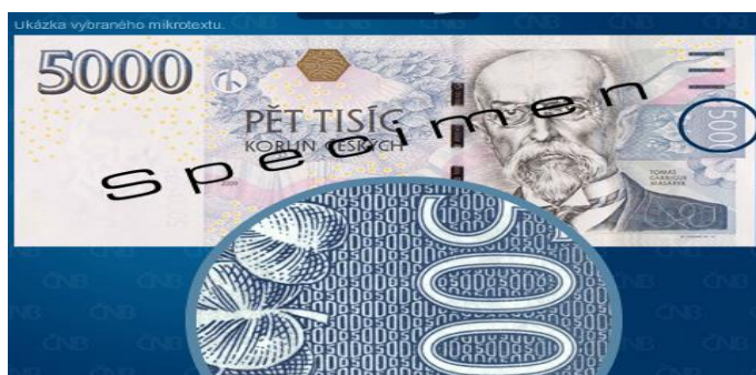
Obrázek 14 Ochranný prvek: mikrotext