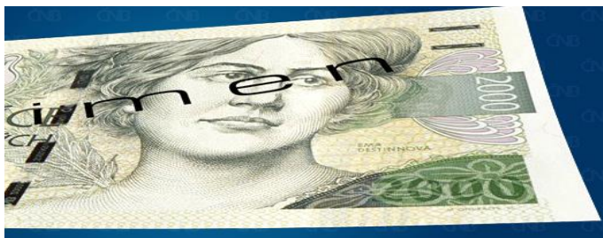
Obrázek 11 Ochranný prvek: skrytý obrazec