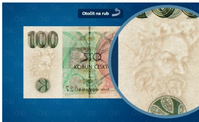
Obrázek 7 Ochranný prvek: vodoznak