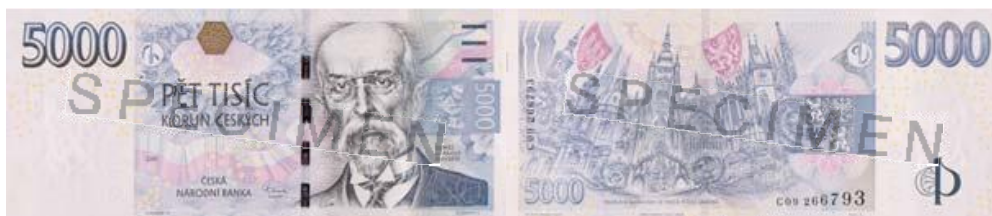
Obrázek 6 Vzhled bankovky 5 000 Kč