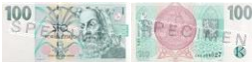
Obrázek 1 Vzhled bankovky 100 Kč