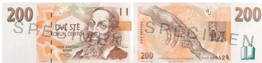
Obrázek 2 Vzhled bankovky 200 Kč