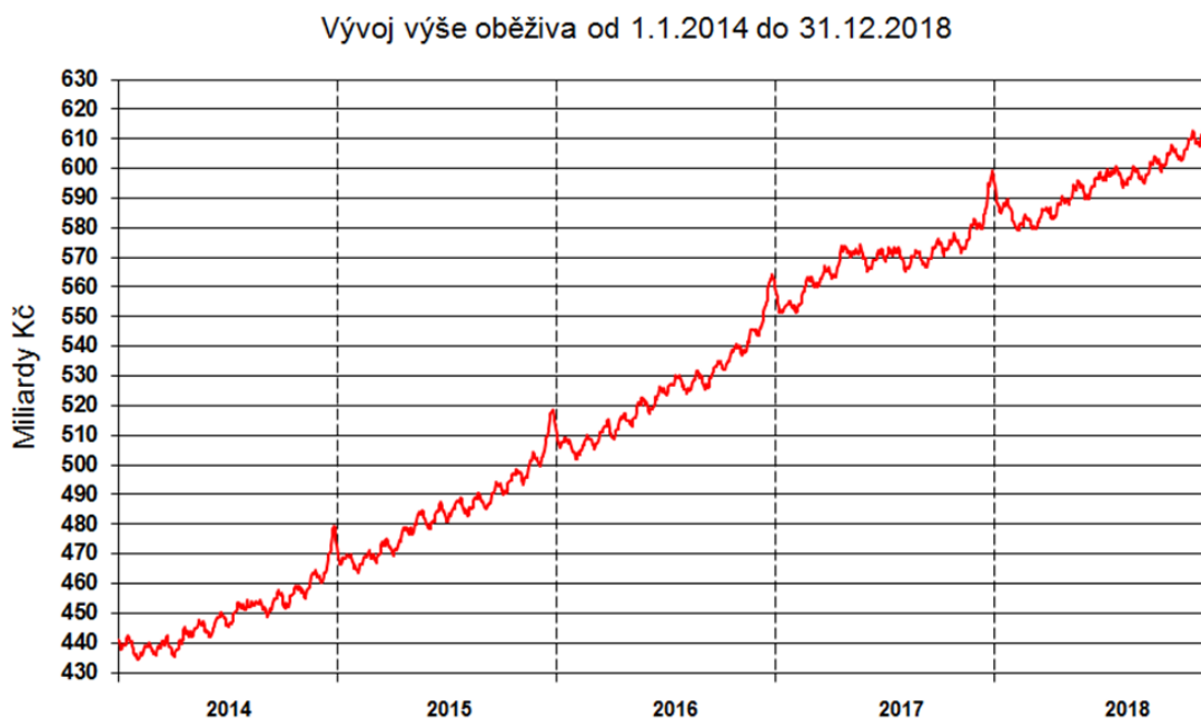
Obrázek 16 Vývoj oběživa