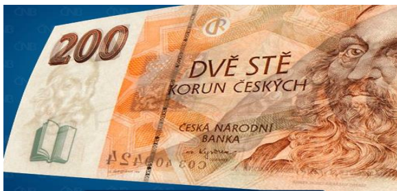
Obrázek 8 Ochranný prvek: okénkový proužek s mikrotextem