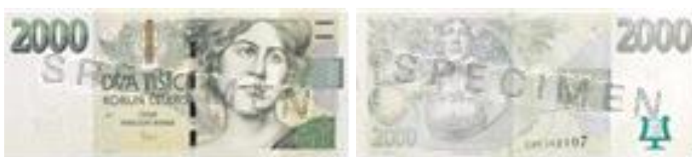
Obrázek 5 Vzhled bankovky 2 000 Kč