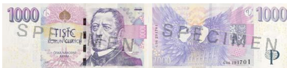
Obrázek 4 Vzhled bankovky 1000 Kč