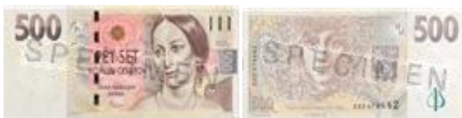
Obrázek 3 Vzhled bankovky 500 Kč