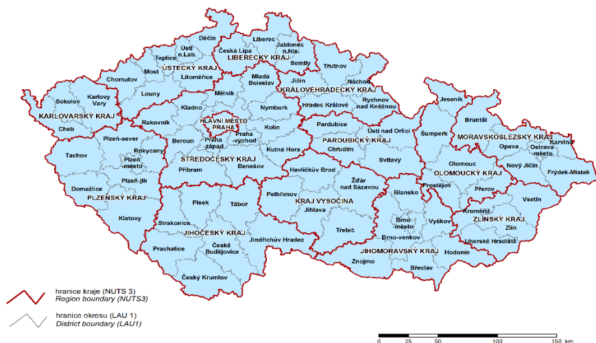
Obrázek 2 NUTS a LAU ČR

NUTS (Nomenclature of territorial units for statistics) jedná se tak o systém klasifikace územních jednotek, který je používán v rámci Evropské unie pro statistické účely a analýzy. Systém má za cíl rozdělení území Evropské unie na tři úrovně územních jednotek: NUTS 1, NUTS 2 a NUTS 3. Rozdělení v ČR viz Obrázek č. 2.