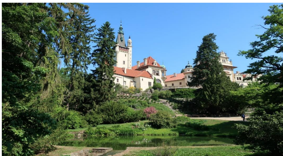
Obrázek 6 Průhonický park

Průhonický park viz Obrázek č. 6 je známou památkou spolu se zámkem a kostelem. Jedná se totiž i o památku na seznamu památek UNESCO a je i Národní kulturní památkou. Dominantou parku je jeho utvoření a harmonii přírodních prvků. Protéká zde potok Botič, který krajinu utváří. Nachází se zde slunné plochy, malé lesy, rybníky, nejrůznější druhy okrasných keřů květin atd. Najít se zde dá i jedna z největších sbírek kosatců na světě, velké množství rododendronů a nejpočetnější sbírka růží v republice. K těmto příležitostem je vytvořen i kalendář kvetení na stránkách Průhonického parku. Parkem vedou celkem 3 okruhy o různých délkách. Nejkratším je základní o délce 2,5 km. Prostředním okruhem si návštěvník udělá procházku o délce 5 km a posledním o délce 10 km. Jde zřejmě o nejdůležitější a nejvýznamnější památku této lokality (Průhonice 2022).