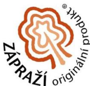
Obrázek 4 Znak MAS Říčansko (Zdroj: https://mas.ricansko.eu/ ) Obrázek 5 Značka Zápraží (Zdroj: https://mas.ricansko.eu/ )

MAS Říčansko viz Obrázek č. 4 se na zdejší životě podílí velkou mírou. Snaží se přinášet do oblasti udržitelný regionální rozvoj. Přes MAS jsou vyhlášovány nejrůznější výzvy z programů IROP, PRV, OPZ, Animace škol atd. Díky tomu do jejich území proudí peníze, které následně podporují zdejší život. Podílí se na mnoha aktivitách přínosných pro širokou veřejnost. Na svůj provoz čerpají také prostředky z EU pomocí IROP.