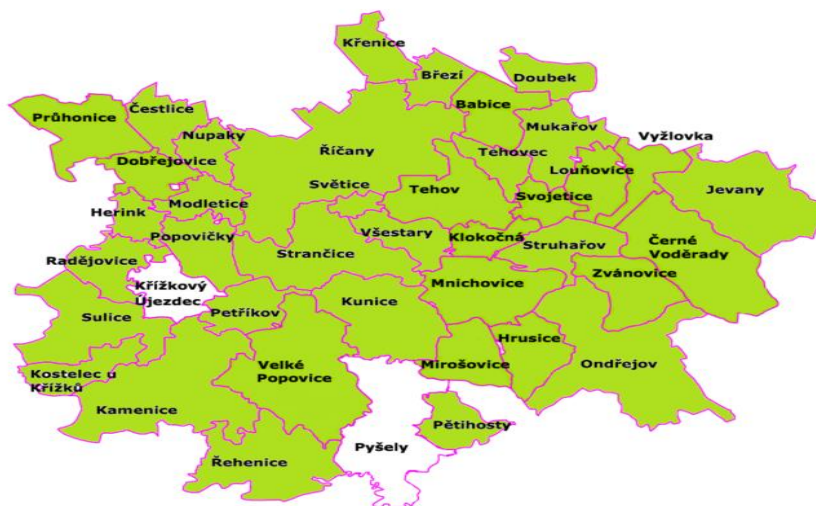
Obrázek 3 Mapa území MAS Říčansko (Zdroj: https://mas.ricansko.eu/mapa-uzemi/uzemi-mas-2021-2027/ )

Území MAS Říčansko viz Obrázek č. 3 bylo vybráno z důvodu jeho polohy. Nachází se v blízkosti hlavního města Prahy ve Středočeském kraji. Rozléhá se na 29 178 ha, především v okrese Praha – východ a malou částí do okresu Benešov a Praha – západ. MAS Říčansko zabírá celkově 40 katastrálních území: Křenice, Říčany, Břeží, Babice, Doubek, Mukařov, Tehovec, Tehov, Světlá, Louňovice, Vyžlovka, Jevany, Černé Voděrady, Zvánovice,