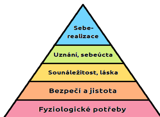
Obrázek 1 Maslowova pyramida potřeb

Primárně lidské potřeby vychází z Maslowovy pyramidy hierarchie potřeb, s kterou přišel roku 1943 viz Obrázek č. 1. Jde o potřeby motivující člověka k chování, výběru a jednání k dosažení životní náplně. Maslow jednání rozdělil na základě intenzity, kdy na nejnižším stupni figurují Fyziologické potřeby. Fyziologické potřeby – jsou takové, díky nimž člověk žije (spánek, jídlo, pohyb atd.), další na žebříčku je Bezpečí a jistota – automatické vyhýbání se se ohrožení. Prostřední potřeba je Sounáležitost a láska – slouží k naplnění intimity a někam patřit. Uznání a sebeúcta – uznání osoby od okolí, ale i sebe samým, ne vždy je této fáze dosaženo. Na vrcholu pyramidy je usazena Seberealizace, reprezentuje potřebu rozvinout svůj talent a touhy po vědění (Lester 2013).