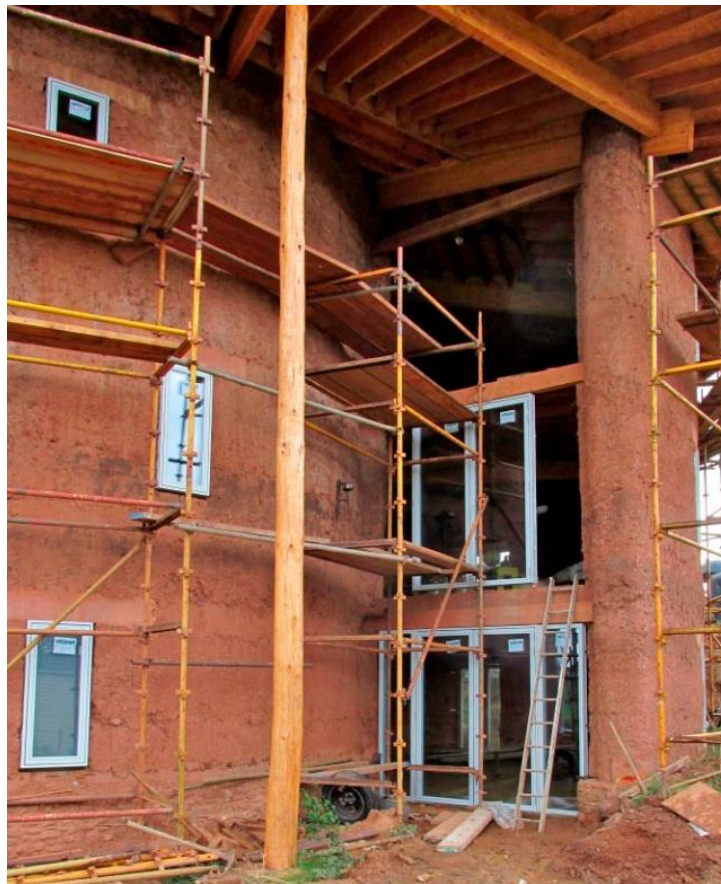
Obr. 3 Nabíjaná hlinená stena [ https://www.imaterialy.cz/rubriky/technologie/vrstvene-hlinene-steny_47226.html ]