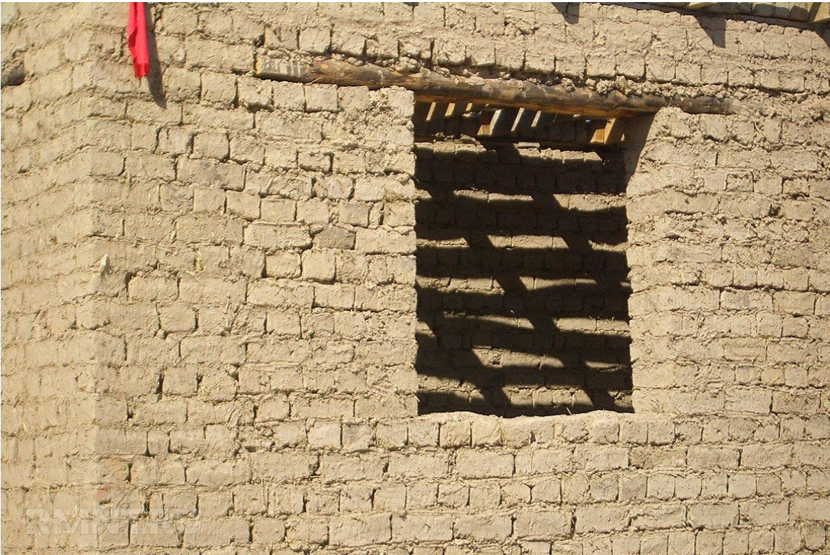
Obr. 4 Nepálená adobe hlinená stavba [ https://m-eng.ru/sk/drain-system/samannyi-kirpich-tehnologiya-izgotovleniya-osobennosti-stroitelstva-kak.html ]