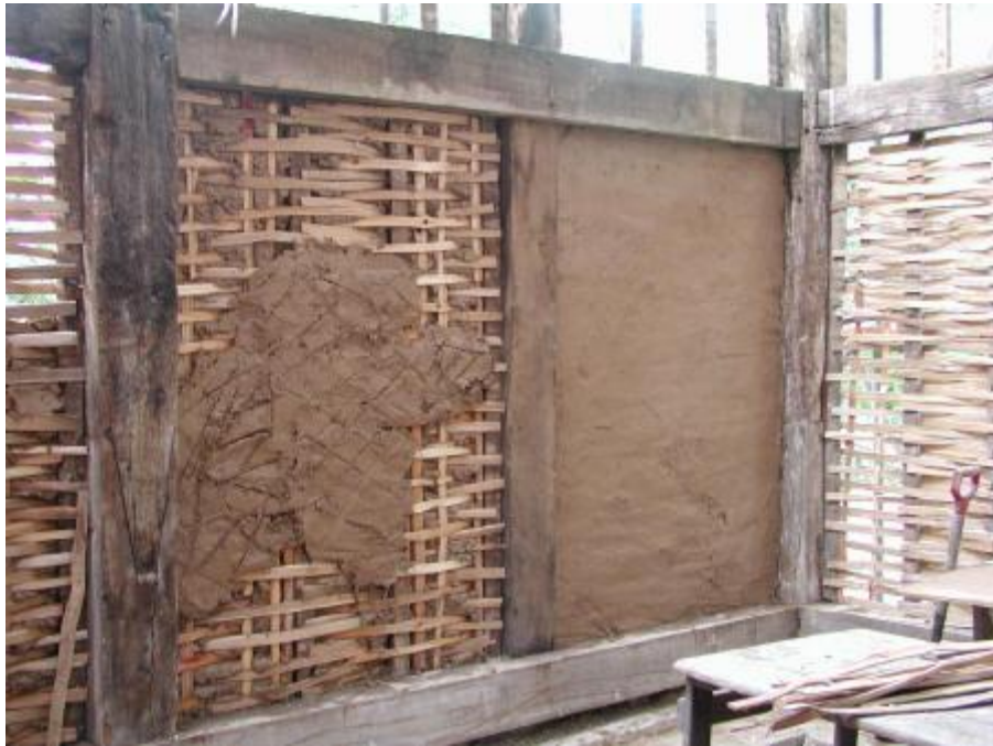
Obr. 7 Daub hlinená stena

[ https://domzhliny.wordpress.com/typy_konstrukcie/daub/ ]