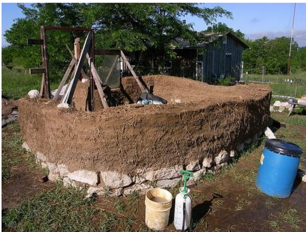
Obr. 2 Cob hlinená stavba

[ https://domzhliny.wordpress.com/typy_konstrukcie/ako-postavit-dom-z-hliny-material-cob/ ]