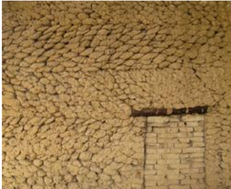
Obr. 5 Válková hlinená stena [ https://www.sardova.cz/Exkurze.html ]