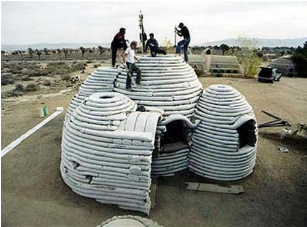
Obr. 6 Superadobe hlinená stavba