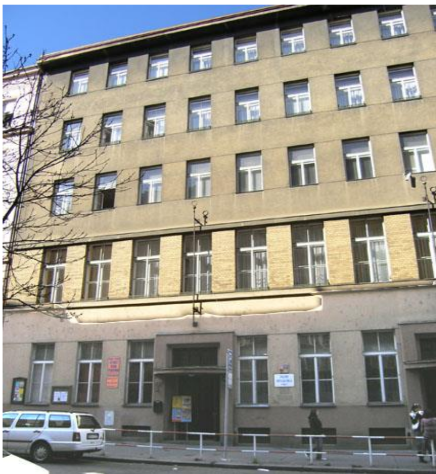
Obrázek č. 2, Hlavní budova DDM P7, Zdroj: www.ddmpraha7.cz

Venkovní část budovy se nijak neliší od jiných školních budov, ale uvnitř budovy je znát, že se o ni někdo pečlivě stará a snaží se, aby se tam lidé cítili dobře. Minulý rok, bylo DDM nově vymalováno. V současné době probíhá rekonstrukce vstupu do budovy a přízemí. Objekt má rovněž velkou výhodu, že je situován blízko parku Stromovka. Některé sportovní kluby využívají možnost pronajmout si v budově šatnu a zájmovou činnost provádět v parku. Blízkost parku využívá ve svých činnostech i CPD, kam většinou směřují jejich procházky.