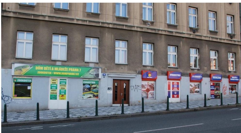
Obrázek č. 4, Zoo koutek, Zdroj: www.ddmpraha7.cz

Ve Veletržní ulici se nachází další z nemovitostí, které má DDM v nájmu a kde provozuje zoo koutek. Zájmová činnost je zaměřena na akvaristiku, teraristiku a vivaristiku. Děti sem chodí a učí se pracovat s různými zvířátky, starat se o ně, krmit je. Opět je objekt velmi dobře dostupný, nachází se kousek od tramvajové zastávky Veletržní palác a je tedy také v blízkosti hlavní budovy DDM v Šimáčkové ulici.