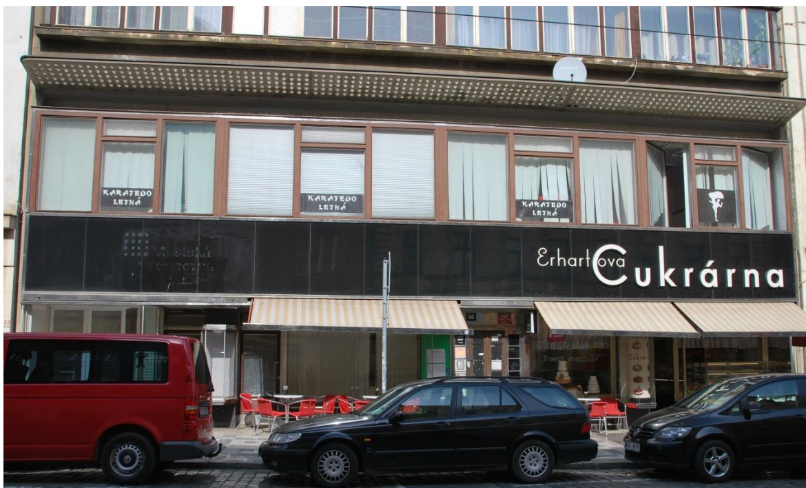
Obrázek č. 6, ulice Milady Horákové

Činnost střediska v Havanské ulici zahrnuje schůzky oddílů Vlků, Vlčic a Pterodactylů, kteří dokonce spadají pod Český svaz ochránců přírody a mají devatenáctiletou tradici. V klubovně se konají pravidelné schůzky jedenkrát týdně ve všední den a dále je zde materiální základna pro víkendové akce, které se pořádají většinou mimo Prahu. Místnost, kterou má DDM pronajatou v této budově není až tak vytížená, schůzky se tu konají pouze v odpoledních hodinách od pondělí do středy, a tak je tento objekt hodně pronajímá i lidmi mimo DDM, nebo interním zaměstnancům pro schůzky jiných kroužků. Turistické oddíly se o objekt velmi dobře starají a místnost a vzhled interiéru je velmi vkusně zařízen.