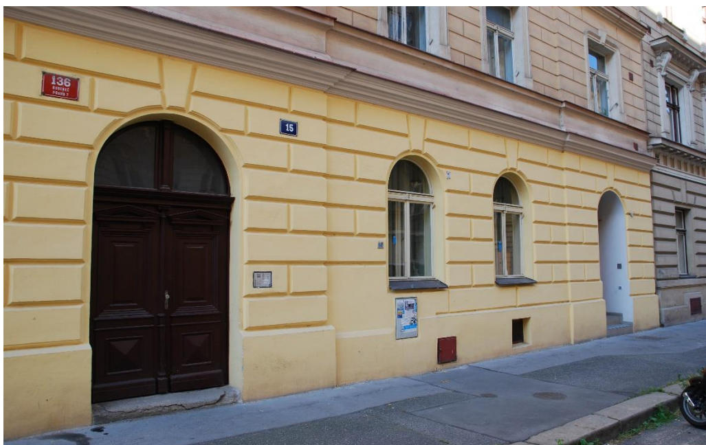
Obrázek č. 7, ulice Havanská, Zdroj: www.ddmpraha7.cz

V Tusarově ulici je poslední budova na Praze 7, kterou si DDM pronajímá a kde sídlí další oddíl, který se zabývá experimentální archeologií. V tomto objektu má svoji klubovnu a pro své hry občas využívá i dvorek spadající k domu. Také je to místo, kde můžete nalézt obří autodráhu, která tu je zde pro děti DDM k dispozici a sídlí tu automodelářský klub. Je to celé jedno přízemní patro, které má DDM v pronájmu a kde se mohou realizovat děti ve svých zájmových kroužcích. Do budoucna se zde připravují prostory, pro rozšíření dramatických útvarů.