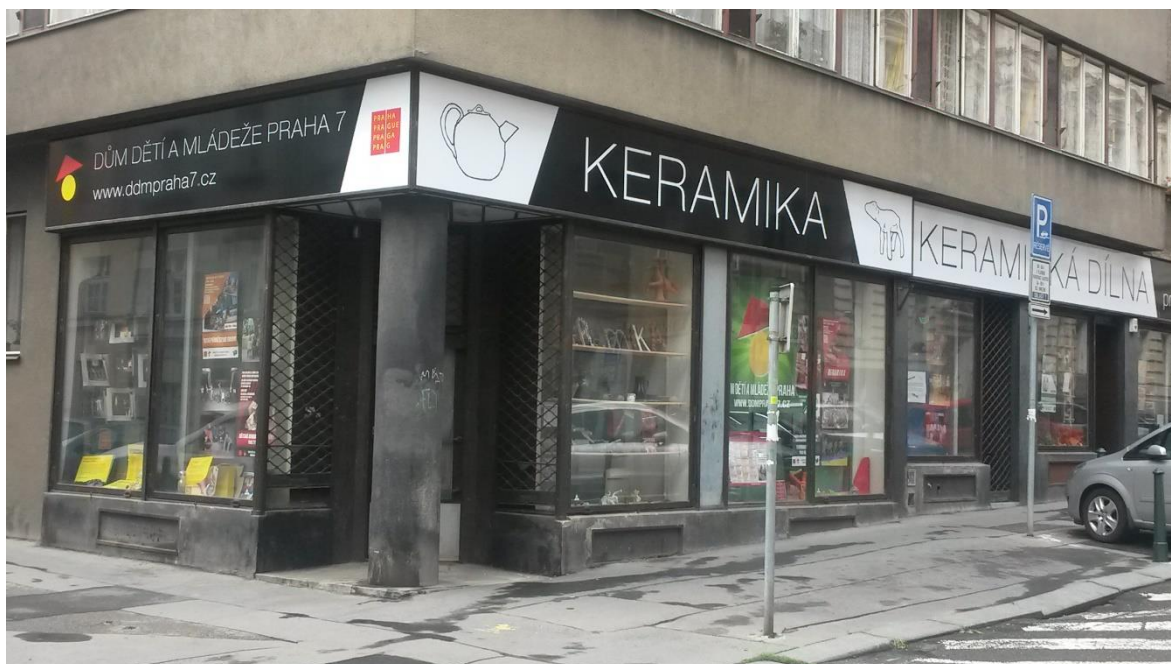
Obrázek č. 5, Keramika DDM, Zdroj: www.ddmprahe7.cz

Keramická dílna, místo pro kreativní rozvoj dětí, je hojně navštěvovaná a nachází se v ulici Janovského. Jedná se o přízemní prostor v bytovém domě a tato dílna má k dispozici dvě pece a dva hrnčířské kruhy. Dále je vybavena různými keramickými materiály včetně glazur, engob, atd. Keramika zde probíhá každý všední den a opět se jedná o minimální vzdálenost od hlavní budovy.