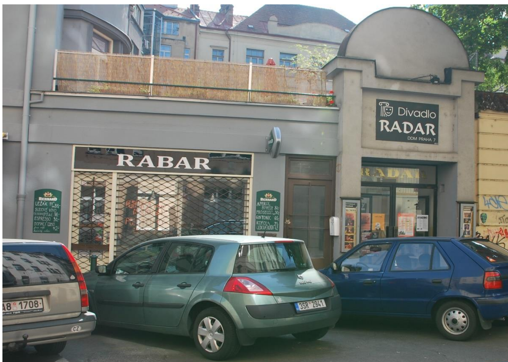
Obrázek č. 3, Divadlo Radar, Zdroj: www.ddmpraha7.cz

Ve Veletržní ulici se nachází další z nemovitostí, které má DDM v nájmu a kde provozuje zoo koutek. Zájmová činnost je zaměřena na akvaristiku, teraristiku a vivaristiku. Děti sem chodí a učí se pracovat s různými zvířátky, starat se o ně, krmit je. Opět je objekt velmi dobře dostupný, nachází se kousek od tramvajové zastávky Veletržní palác a je tedy také v blízkosti hlavní budovy DDM v Šimáčkové ulici.