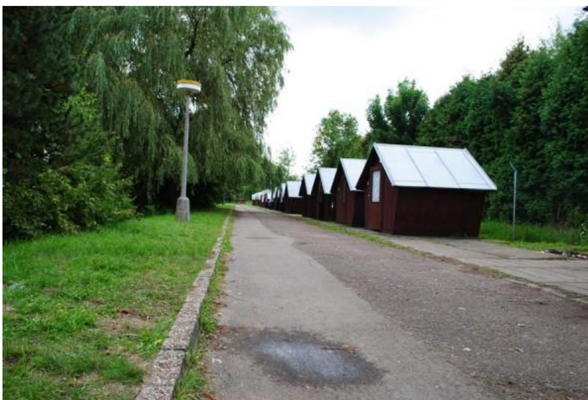
Obrázek č. 9, táborové středisko Bakov nad Jizerou

Poslední nemovitost, s kterou je ale i nejvíce práce je táborová základna Bakov nad Jizerou, kde si DDM pronajímá od města pozemek a veškeré buňky a chatky si spravuje sama. Totéž platí o údržbě pozemků. Častokrát je to v praxi realizováno tak, že například na sekání trávy tam jezdí volnočasoví pedagogové, aby dostáli úvazku, na který jsou v DDM zaměstnáni a samozřejmě i dopomohli k tomu, aby se tam mohli pořádat tábory a kempy. Nejedná se pouze o přípravu na hlavní sezónu, ale během celého roku je tam stále potřeba pracovní síla. Ředitel DDM využívá manuálně zdatnější zaměstnance, kteří jsou i podle jejich slov rádi, že mají díky tomu příjemnou změnu a tato výpomoc jim nevadí.