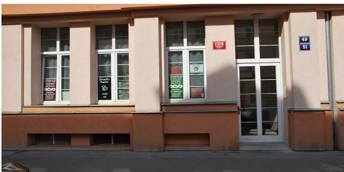
Obrázek č. 8, ulice Tusarova, Zdroj: www.ddmpraha7.cz

V Tusarově ulici je poslední budova na Praze 7, kterou si DDM pronajímá a kde sídlí další oddíl, který se zabývá experimentální archeologií. V tomto objektu má svoji klubovnu a pro své hry občas využívá i dvorek spadající k domu. Také je to místo, kde můžete nalézt obří autodráhu, která tu je zde pro děti DDM k dispozici a sídlí tu automodelářský klub. Je to celé jedno přízemní patro, které má DDM v pronájmu a kde se mohou realizovat děti ve svých zájmových kroužcích. Do budoucna se zde připravují prostory, pro rozšíření dramatických útvarů.