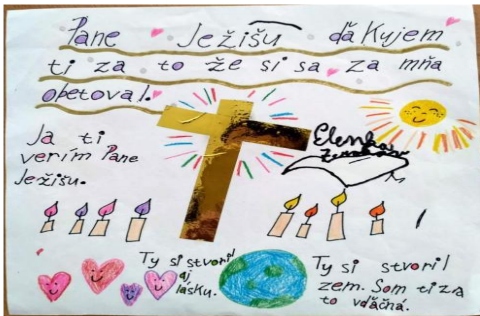
Obr. 5 Kresba s názvem „Otče náš“; věk autora neznámý, pravděpodobně 5–7 roků.