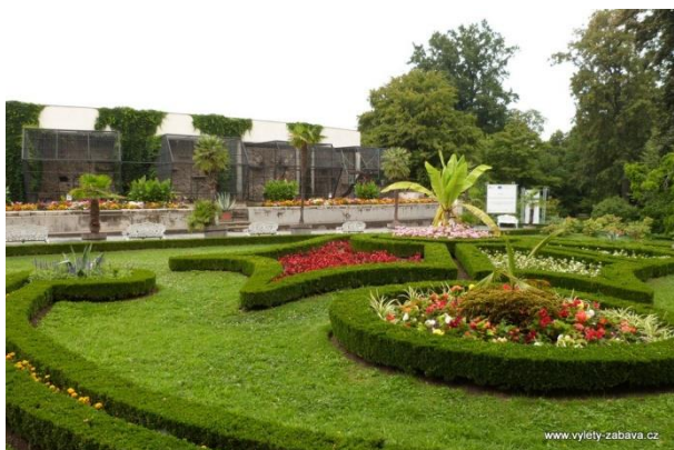
Obr 5 – Podzámecká zahrada.