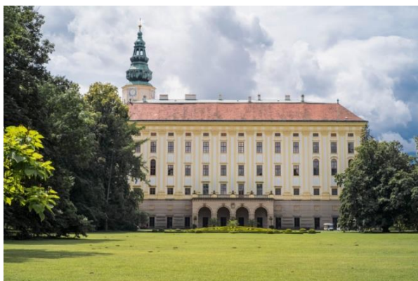
Obr. 1 - Arcibiskupský zámek.

Učitel promítne na tabuli fotky památek a staveb souvisejících s Kroměříží