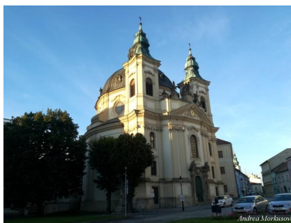
Obr. 4 – Kostel Sv. Jana Křtitele.