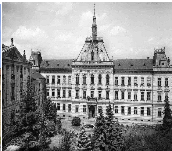
Obr 2 – Arcibiskupské gymnázium.