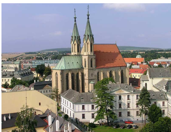
Obr. 3 – kostel Sv. Mořice.