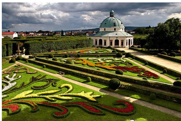
Obr. 2 – Květná zahrada.