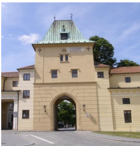
Obr 1 – Mlýnská brána.