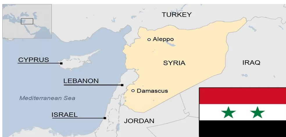
Obrázek 2: Mapa upřesňující polohu státu a jeho sousední státy.

Sýrie leží v jihozápadní Asii, sdílí hranice s Tureckem, Irákem, Jordánskem, Izraelem a Libanonem. Velká část země je pokryta Syrskou pouští, která zasahuje i do dalších států (Britannica, 2017). Sýrie je rozlohou asi 2,5x větší než Česká republika, konkrétně zaujímá rozlohu 185 180 km 2 . Žije zde zhruba 22 milionů obyvatel a úředním jazykem je arabština (BBC, 2023). Patří mezi jednu z nejstarších obydlených oblastí na Zemi (History.com, 2018).