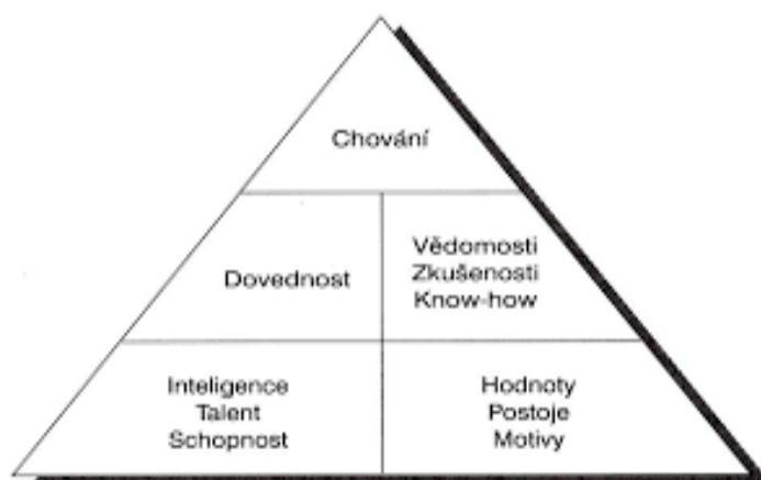
Obrázek 2 Hierarchický model struktury kompetence

Anatomie kompetence znázorňuje vše, co stojí za očekávaným chováním (Kubeš, aj. 2004, s. 27).