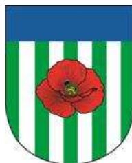
Obrázek 1 Znak obce Veselí