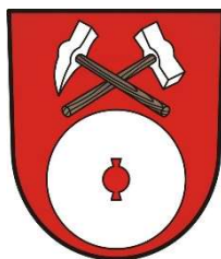
Obrázek 2 Znak obce Choltice