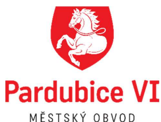
Obrázek 5 Znak Statutárního města Pardubice - Městského obvodu Pardubice VI