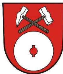
Obrázek 2 Znak obce Choltice