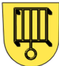
Obrázek 4 Znak obce Přelouč