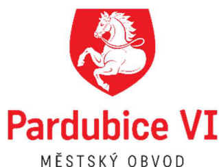
Obrázek 5 Znak Statutárního města Pardubice - Městského obvodu Pardubice VI