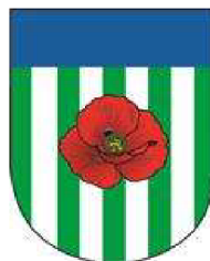
Obrázek 1 Znak obce Veselí