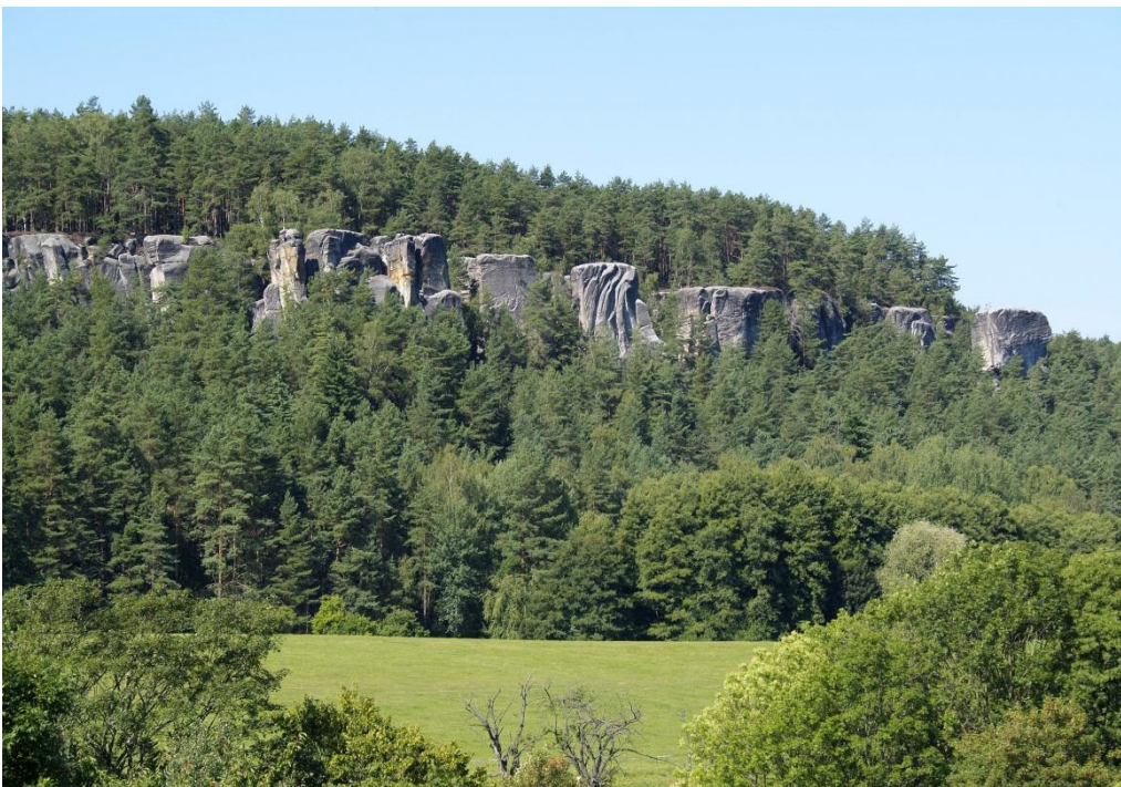
Ilustrace 6: Betlémské skály se sloními hřbety, Klokočské skály

Nejrozsáhlejší podzemní prostor oblasti je jeskyně Postojna - Amerika v Zeleném dole. Jedná se o největší pseudokrasovou jeskyni na území Českého ráje. Ze skalní stěny jsou výhledy na severní a jihovýchodní část Českého ráje. Dominantou PR je zřícenina hradu Rotštejn nacházející se v jihovýchodní části skal (KUDYZNUDY b, 2023). Na ilustraci 6 jsou zobrazeny Betlémské skály se sloními hřbety.