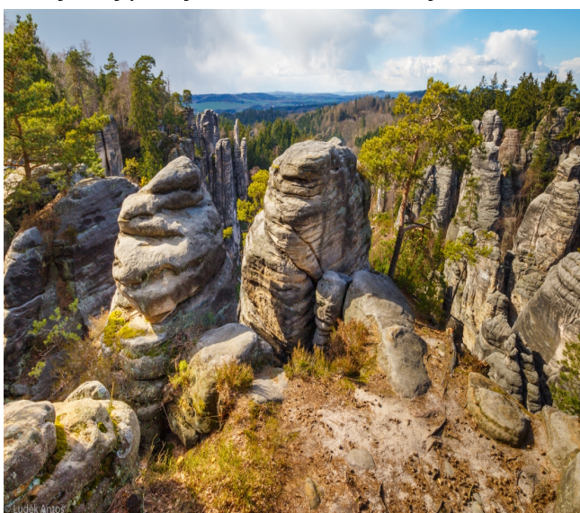
Ilustrace 4: Prachovské skály

V horkých letních dnech mohou turisté využít přírodní koupaliště U Pelíška, které nese název v duchu těchto skal (KUDYZNUDY d, 2023). Na ilustraci 4 se nachází Prachovské skály s typickými skalními útvary.