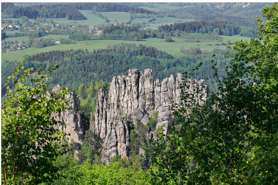
Ilustrace 3: Suché skály, Maloskalsko

Celým územím prochází hustá síť silnic, cest i značených turistických stezek. Pro sportovce a turisty se tu nachází velké množství sportovních a rekreačních zařízení. Vodáci mohou sjíždět řeku Jizeru na kánoích či raftech, zatímco cyklisté mohou využít cyklotrasu Greenway Jizera, která vede údolím Jizery z Turnova na Malou Skálu a dále do Líšného (CESKY-RAJ.INFO a, 2023). Na ilustraci 3 jsou zobrazeny skalní hřebety Suchých skal s přilehlým okolím.