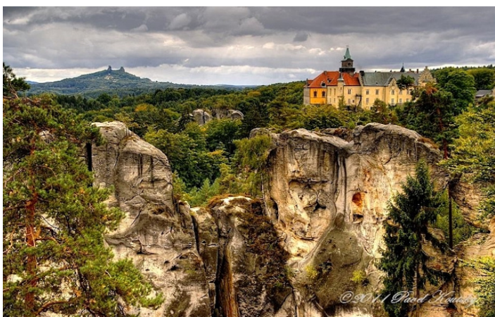
Ilustrace 2: Mariánská vyhlídka, Hruboskalsko

K oblíbeným místům Hruboskalska patří skalní vyhlídky (Janova, U Lvíčka, vyhlídka na Kapelu, Mariánská) a arboretum Bukovina (první pokusná plocha na pěstování severoamerických dřevin ve střední Evropě). Pod Mariánskou vyhlídkou se nachází symbolický hřbitov horolezců, který je věnován památce horolezců, kteří tragicky zahynuli při svých výpravách (KUDYZNUDY a, 2023). Na ilustraci 2 se nachází Mariánská vyhlídka, z které je výhled na okolní skupiny skal, hrad Trosky a zámek Hrubá Skála.