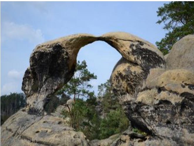
Ilustrace 5: Skalní oblouk, Příhrazské skály

Ve skalním městě se nachází vytesaná modlitebna Hynšta, která v 17. století sloužila jako úkryt pronásledovaným českým bratřím. Nedaleko Modlitebny Hynšta stojí významná zřícenina hradu Valečov s přilehlými valečovskými světničkami. (KUDYZNUDY e, 2023). Na ilustraci 5 je vyfocen jeden z typických skalních oblouků nacházející se v Příhrazských skalách.